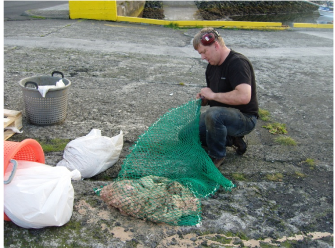
Mynd 2 Slóg í netapoka. Á myndinni er verið að lkoa poka sem í eru um 15 kg af slógi

Útbúnir voru netapokar sem rúmuðu sýnin, með 20 mm, 30 mm og 45 mm möskvastærðum svo að aðgangur fiska og botndýra væri misgreiður. Sýnin voru sett í netapokana í landi og þau vigtuð og ljósmynduð. Þrír mismunandi sýnapokar voru festir saman og netasteinar settir á sinn hvorn endann til að halda sýnunum föstum á