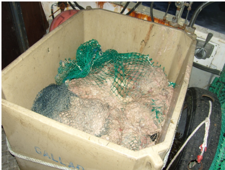
Mynd 1 Mynd af slógi í ker. Á henni sjást líka netapakarnir sem notaðir voru við tilraunina. Möskvastærð þeirra var mismunandi og er skýrt nánar út hér að neðan

Við vinnslu á slógi er spurning um að hvort ekki megi flokka slógið að einhverju marki og koma einstökum hlutum þess í verð. Traustur farvegur er fyrir nýtingu á lifur sem á annað borð kemur að landi í frekari vinnslu, niðursuðu eða bræðslu. Nokkuð er um að hrogn séu hirt og seld til frekari vinnslu til mannelis. Aðrir hlutar eru nýttir í minna mæli. Þó má í flestum tilfellum gera ráð fyrir að