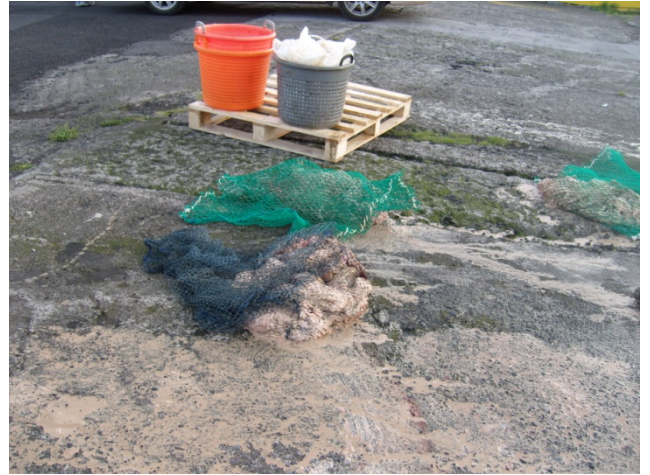
Slóg í netapokum af mismunandi möskvastærðum