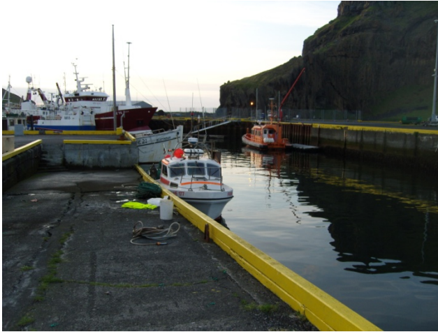
Fallegur morgun í Vestmannaeyjarhöfn