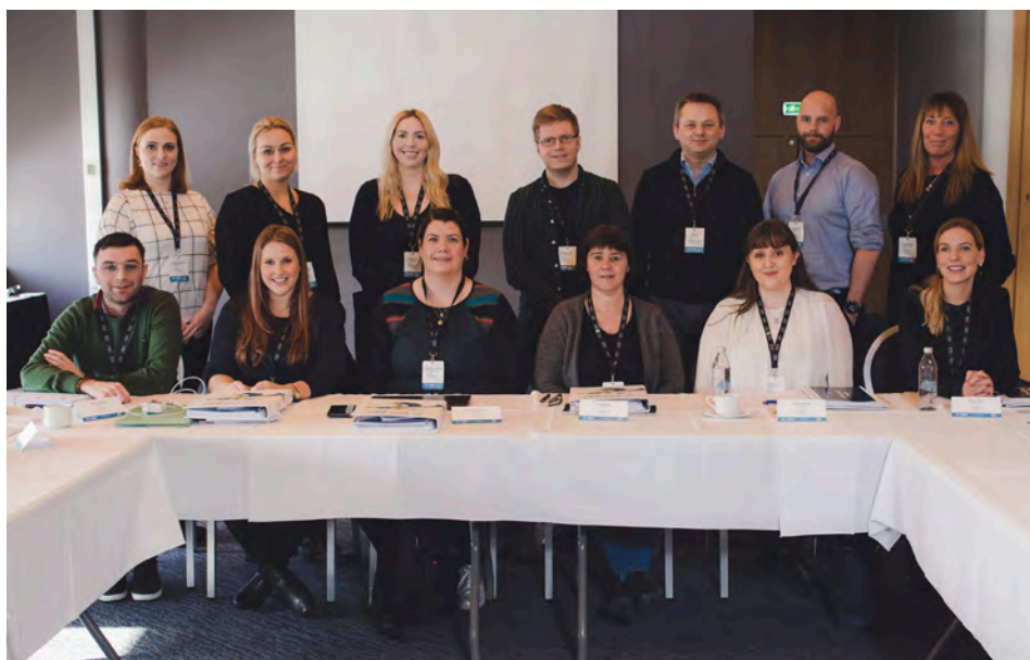
Allherjarnefnd 3 - Ungt fólk á vinnumarkaði - tæknibreytingar.