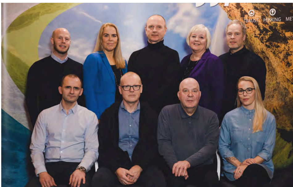
Nýkjörin stjórn SSF 2019-2022.