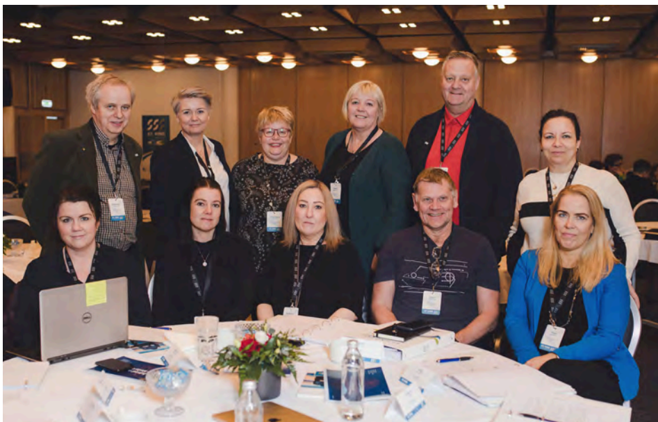
Allsherjarnefnd 1 - Jafnréttismál, fjölskyldan, tekjujöfnuður.