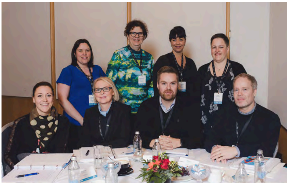
Allsherjarnefnd 2 - Heilbrigðismál og velferð borgaranna.