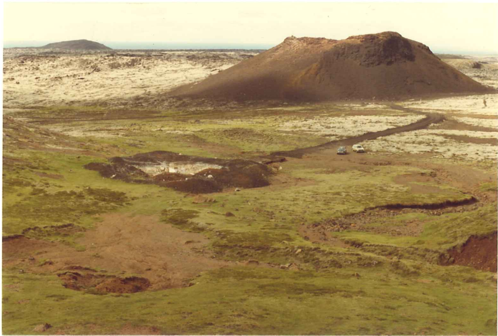
Mynd 3. Gryfja umhverfis H-6 í Trölladyngju fyrir miðri mynd