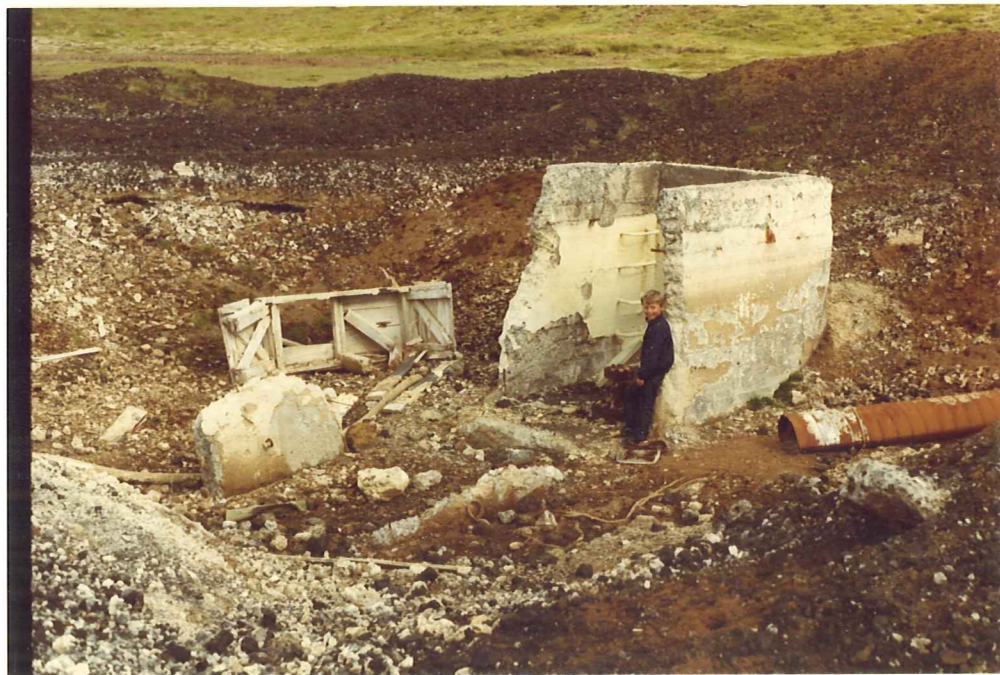
Mynd 4. Leifar af kjallara við H-6 í Trölladyngju.