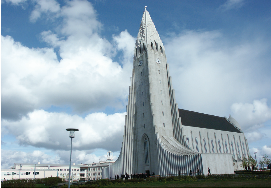
Hallgrímskirkja í Reykjavík er stærsta kirkjubyggingin á Íslandi. Hún er nefnd eftir séra Hallgrími Péturssyni sem orti Passíusálmana.

Orðið kirkja getur bæði átt við samfélag kristinna manna og bygginguna sem það notar fyrir starfsemi sína. Byggingin er líka kölluð guðshús því þar eru haldnar guðsþjónustur og ýmsar aðrar helgiathafnir fara þar fram.