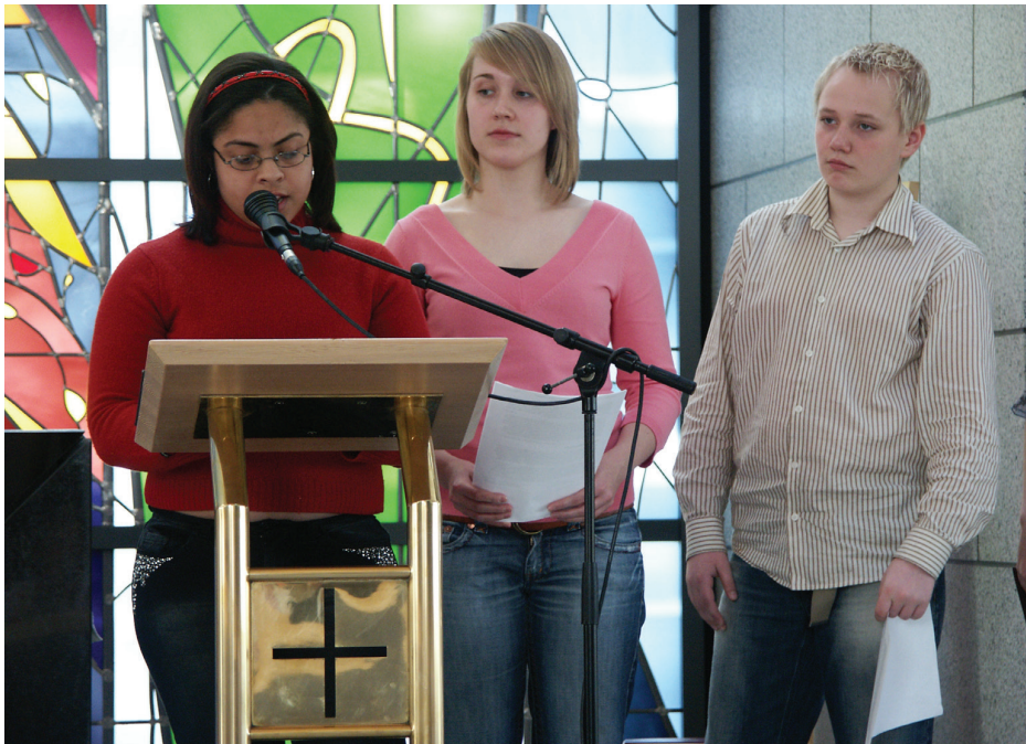
Ungmenn lesa biblíutexta við guðspjónustu í Grafarvogskirkju á hvítasunnudegi.

Sumir kristnu helgidagarnir eru til að fagna gleðilegum atburðum í sögu trúarinnar. Jólin, pálmásunnudagur, páskar og hvítasunna eru í þessum flokki. Aðrir dagar eru sorglegir svo sem skírdagur og föstudagurinn langi.