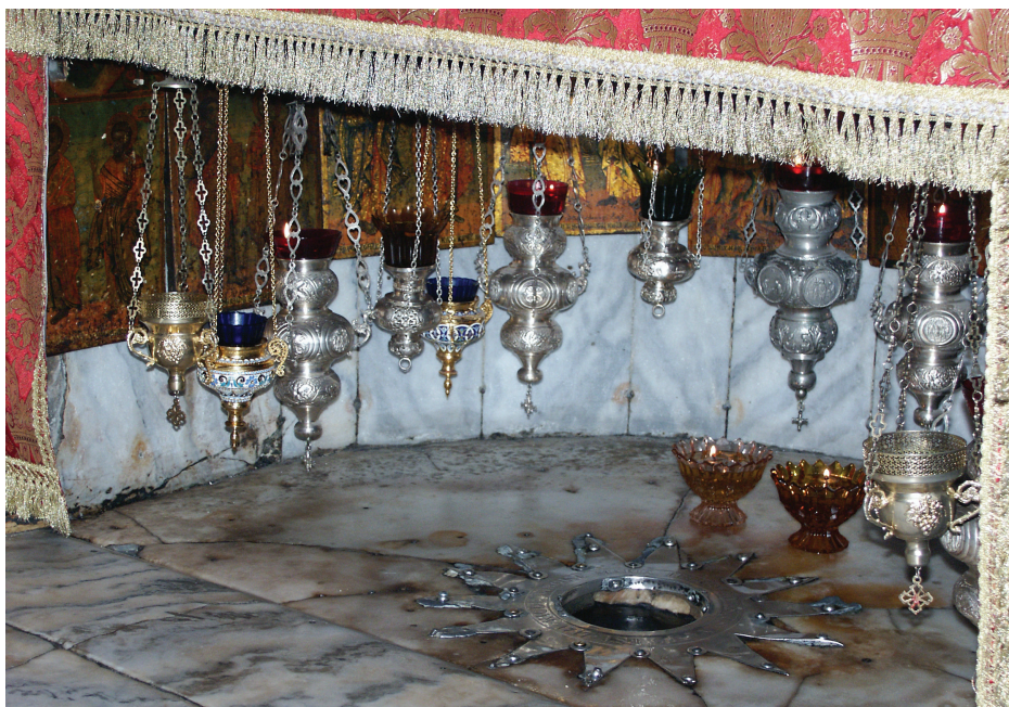
Staðurinn í Betlehem þar sem talið er að Jesús hafi fæðst.

Langt var liðið á meðgönguna þegar boð kom frá yfirvöldunum um að allir íbúar landsins ættu að láta skrásetja sig og skyldi hver fara til síns heimabæjar. María fór þá til Betlehem í Júdeu ásamt Jósef, eiginmanni sínum, sem var þaðan. Þar sem fjöldi manns var kominn til bæjarins vegna skrásetningar voru öll herbergin á gisti-húsinu upptekin. Þau urðu því að hafast við í fjárhúsi. Þar fæddi María lítinn dreng sem var gefið nafnið Jesús.