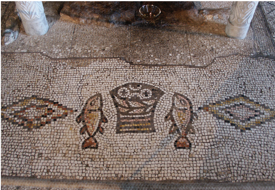
Mósaíkmynd í kirkju við Galíleovatn, þar sem Jesús mettaði fimm þúsund manns með tveim fiskum og fáeinum brauðum.

Auk þess er talað um alls konar kraftaverk önnur, svo sem að breyta vatni í vín, stilla storm, ganga á vatni og metta þúsundir manna með tveim fiskum og fáeinum brauðum.