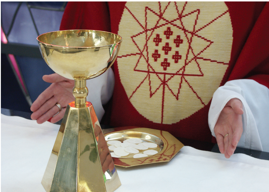
Kaleikur og oblátur.

Samkvæmt guðspjöllunum talaði Jesús oft um það við lærisveinana að hann yrði að fórnarlambi sínu fyrir mannkynið en að hann myndi rísa upp frá dauðum þremur dögum seinna.