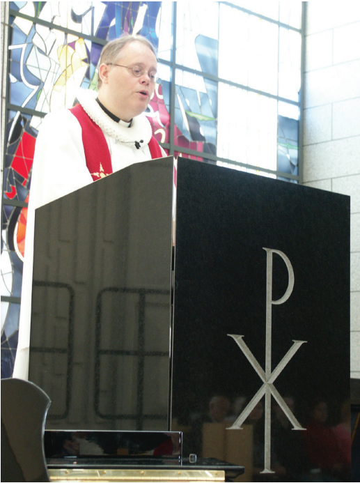
Prestur í predikunarstól.

Í flestum kirkjum eru predikunarstólar en það eru upphækkuð ræðupúlt, oft fagurlega skreytt með biblíumyndum eða trúartáknum. Þar flytur presturinn predikun sem þýðir að hann útskýrir Biblíuna og hvetur söfnuðinn til að lifa í samræmi við orð hennar.