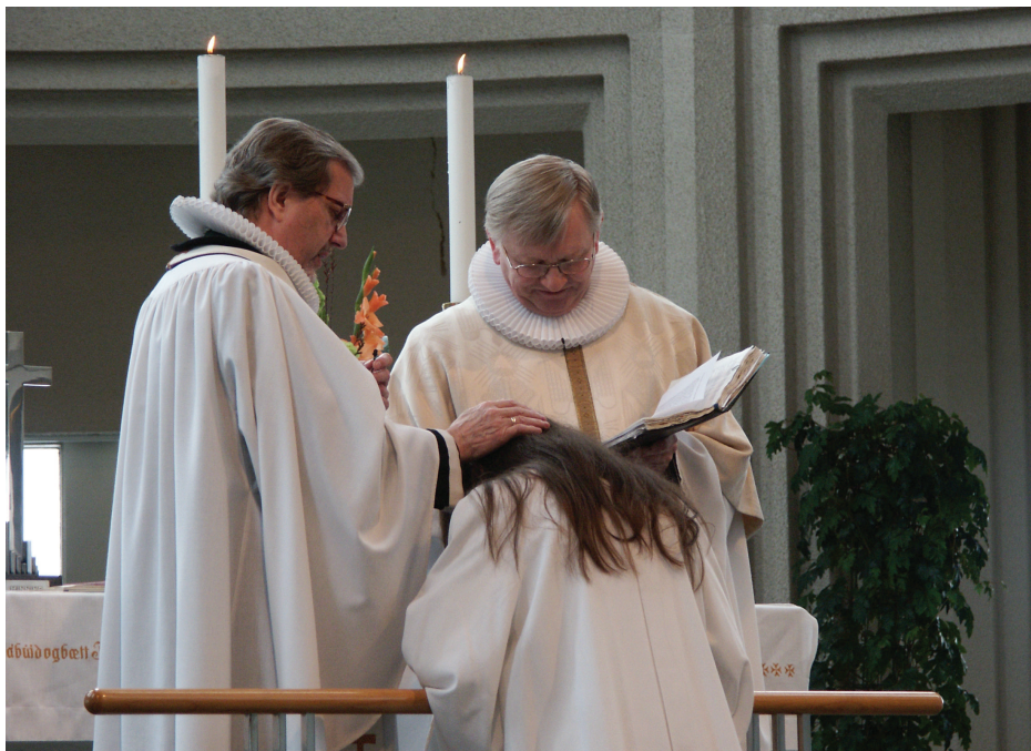
Prestar blessa fermingarbarn.

Það er hátíðleg stund þegar fermingarbörnin ganga inn kirkju-gólfið í hvítum kyrtlum sem eiga að minna á skírnaðkjólinn. Í lok athafnanna er unglingnum boðið að ganga til altaris sem fullgildur meðlimur safnaðarinnar. Eftir guðsþjónustuna er boðið til veislu og fermingarbarninu færðar gjafir í tilefni dagsins.