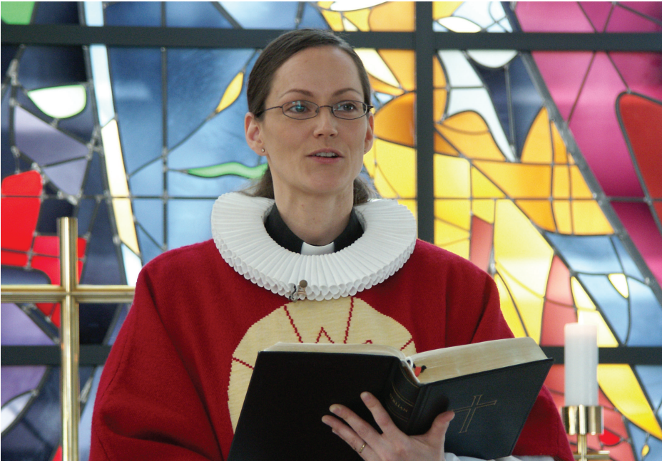
Prestur les úr Biblíunni við guðspjónustu.

Helgirit kristinna manna nefnist Biblían. Hún er safn bóka sem skrifaðar voru á mjög löngum tíma. Biblíunni er skipt í tvo hluta: Gamla og Nýja testamentið. Gamla testamentið inniheldur að mestu leyti sömu rit og helgirit gyðinga. Kristnir menn kalla þennan hluta Biblíunnar Gamla testamentið, sem þýðir gamli sáttmálinn, vegna þess að þeir líta svo á að Jesús hafi verið uppfylling sáttmálans sem Guð gerði við Ísraelsmenn og að hann hafi jafnframt stofnsett nýjan sáttmála, Nýja testamentið, en af honum dregur seinni hluti Biblíunnar nafn sitt.