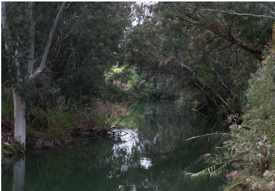
Jesús var skírður af Jóhannesi í ánni Jórdan.

Þegar Jesús var um það bil 30 ára gamall kom hann að bökkum árinna Jórdan. Þar hitti hann mann er Jóhannes hét sem skírði hann með því að dýfa honum ofan í ána, líkt og hann hafði gert við fjölda annarra til að undirbúa þá fyrir komu Messíasar.