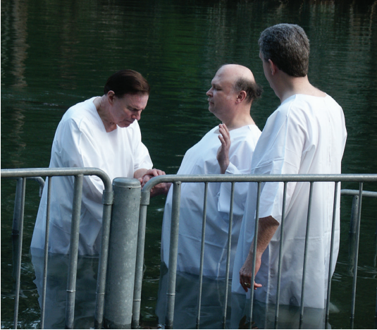
Skírn í ánni Jórdan.