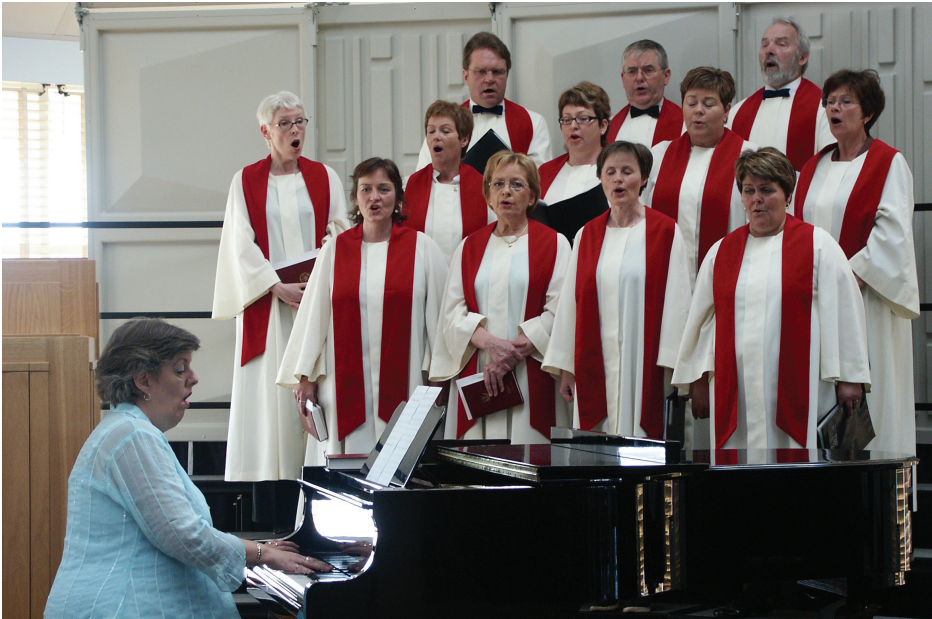
Frá guðsþjónustu í Grafarvogskirkju.

Meðan á orgelspilinu stendur snýr presturinn sér að altarinu með bakið í söfnuðinn en þegar því lýkur snýr hann sér við. Presturinn tónar ritningarvers og bænir úr Biblíunni og kirkju- kórinn syngur sálma. Meðhjálparinn, aðstoðarmaður prestsins, sér til þess að nóg sé til af sálmabókum svo að söfnuðurinn geti tekið undir sönginn.