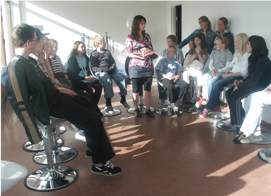
Barnafræðsla á vegum hvítasunnukirkjunnar Fíladelfíu.

Ýmislegt fleira er gert í kirkjunni. Nefna má barna- og unglinga-starf, starfsemi fyrir aldraða, fræðslufundi og kyrrðarstundir, auk margs konar menningarstarfsemi, svo sem tónleikahald.