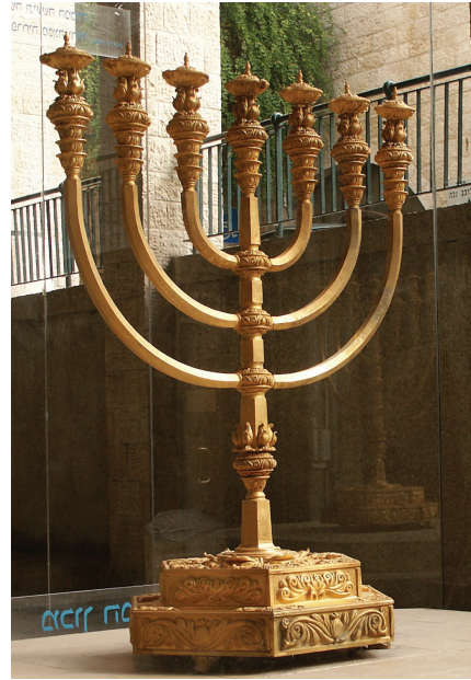
Nákvæm eftirlíking af ljósastjaka sem var í musterinu í Jerúsalem.

Skömmu eftir fæðinguna fóru María og Jósef með Jesú í musterið í Jerúsalem til að helga hann Guði eins og til siðs var meðal gyðinga. Þar hittu þau tvær gamlar manneskjur, Símeon og Önnu, sem voru bæði mjög bænærkin. Þegar þau sáu barnið glöddust þau mjög og sögðu að þessi litli drengur yrði frelsari þjóðarinnar.