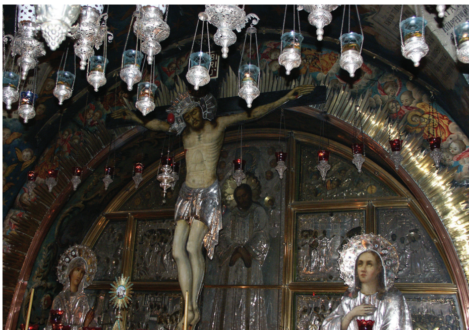
Þetta altari er á þeim stað þar sem talið er að krossinn hafi staðið.

Sama kvöld fór Jesús ásamt lærisveinunum í Getsemane-garðinn við rætur Olíufjallsins. Jesús reyndist sannspár: Júdas Ískariot sveik hann. Hann sagði æðstu prestum gyðinga frá því að Jesús væri í garðinum, fjarri mannföldanum. Um það bil sem Jesús og lærisveinarnir ætluðu að yfirgefa garðinn kom Júdas ásamt hópi vopnaðra manna.