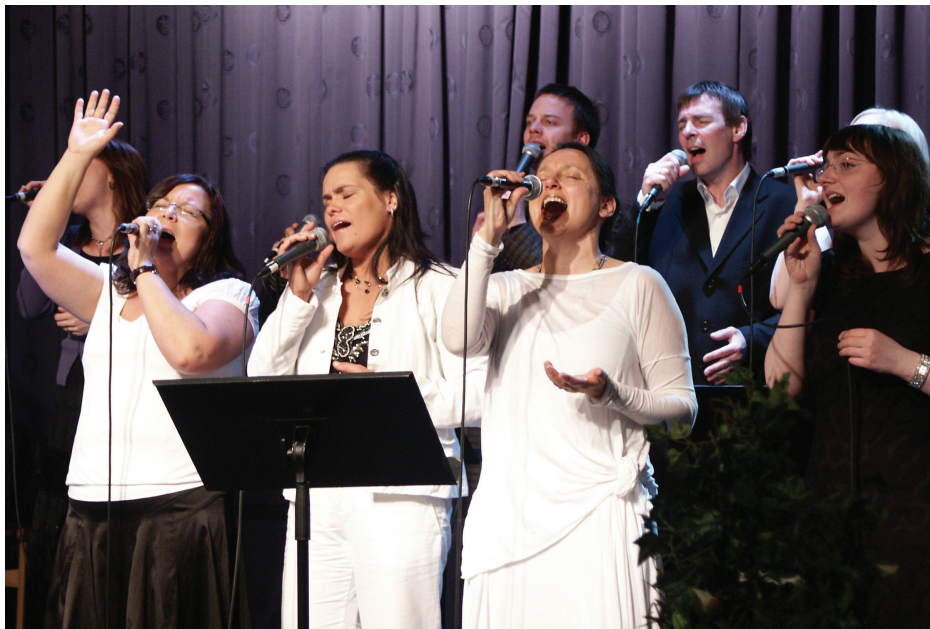
Kraftmikil tilbeiðslutónlist á samkomu hjá Hvítasunnusöfnuðinum Fíladelfíu.

Langflestir Íslendingar játa kristna trú og stærstur hluti þeirra er í þjóðkirkjunni sem er evangelísk-lúthersk kirkja. Biskup er æðsti embættismaður þjóðkirkjunnar og hefur aðsetur í Reykjavík. Ýmsar aðrar kristnar kirkjur og söfnuðir eru í landinu. Helstu kirkjur eru katólska kirkjan, rétttrúnaðarkirkjan og fríkirkjan en söfnuðir: Hvítasunnusöfnuðurinn, Krossinn, Vegurinn, Hjálpræðisherinn og Aðventistar. Að auki starfa hér söfnuðir Votta Jehóva og Kirkja hinna síðari daga heilögu, betur þekktir sem mormónar.