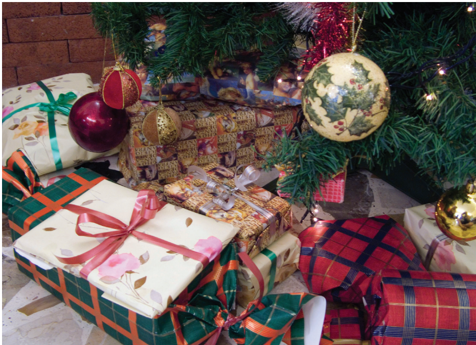
Jólagjafir og skraut.

jóla, þann 24. desember. Eftir að fjölskyldan hefur borðað saman jólamatinn eru teknar upp gjafir. Áður fyrr voru börn á Íslandi hrædd með því að ef þau væru óþekkt fengju þau enga nýja flík og þá mundi jólakötturinn éta þau. Þeim voru líka sagðar sögur af Grýlu sem átti það til að ræna óþægum krökkum og hafa þá í matinn. Jólasveinarnir synir hennar voru heldur ekki til fyrirmyndar. Þeir voru hrekkjóttir og stálu öllu steini léttara. Þessar þjóðsögur eru rifjaðar upp á hverjum jólum en eiga í harðri samkeppni við jólasveininn með rauðu skotthúfuna sem er öllu vinnjarnlegri. Helgisögnin um jólasveininn hefur verið rakin aftur til heilags Nikulásar, kristins biskups sem talið er að hafi átt heima í Tyrklandi á fjórðu öld. Hann var afar örlátur eins og jólasveinninn sem færir börnunum gjafir á jölunum. Börnin setja skó út í glugga áður en þau fara að sofa í von um að jólasveinninn setji eitthvað gott í hann á nóttunni. Ef þau hafa verið þæg fá þau gjöf í skóinn en séu þau óþekkt fá þau bara kartöflu.