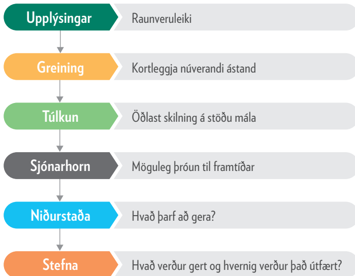
Mynd 1. Framsýniferlið

Framsýniaðferðum má skipta í þrjú flokka, leitandi aðferðir (e. Exploratory methods), skilyrtar aðferðir (e. Normative methods) og stuðningsaðferðir (e. Supplementary methods). Þær tvær síðari eru þó í raun ekki framsýniaðferðir en eru notaðar til stuðnings þeim.