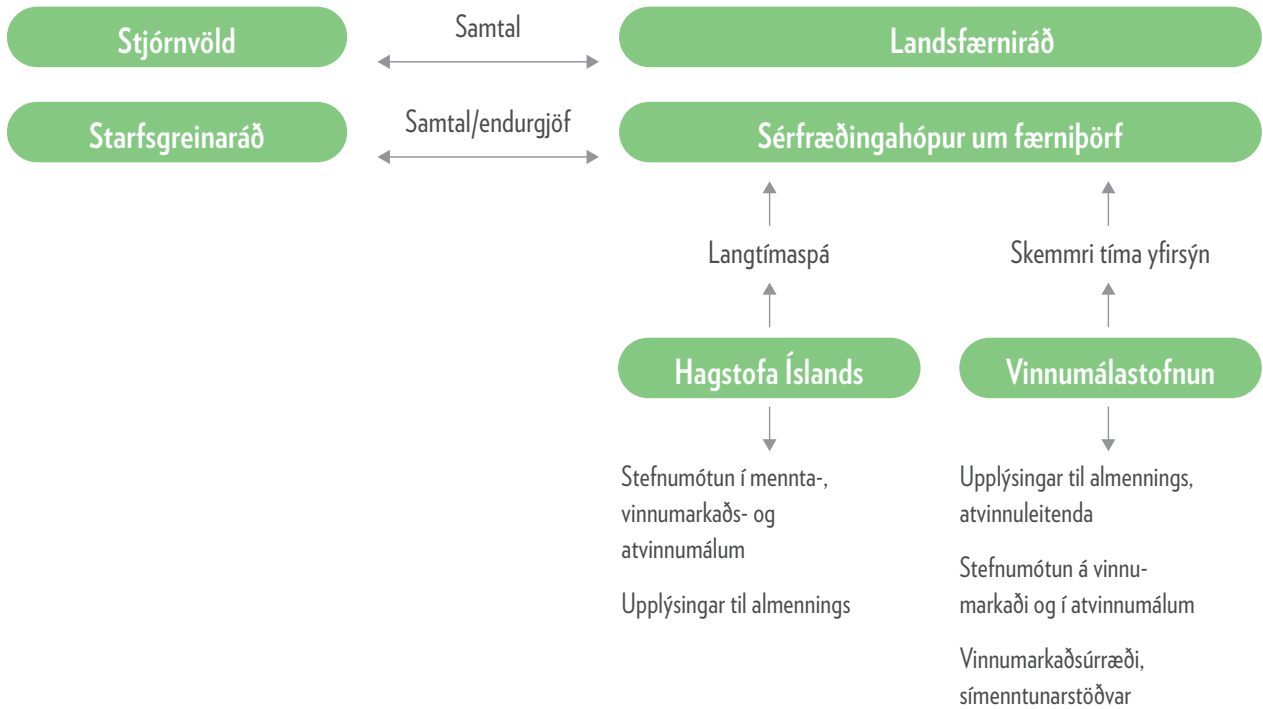
Mynd 3. Íslenskt spáferli