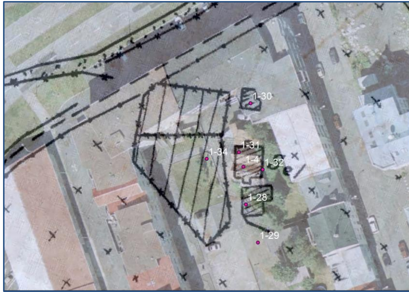
Mynd 9. Fornleifar á bæjarhlaði Stórasels. Rauðir punktar sýna staðsetningar fornleifa. 18