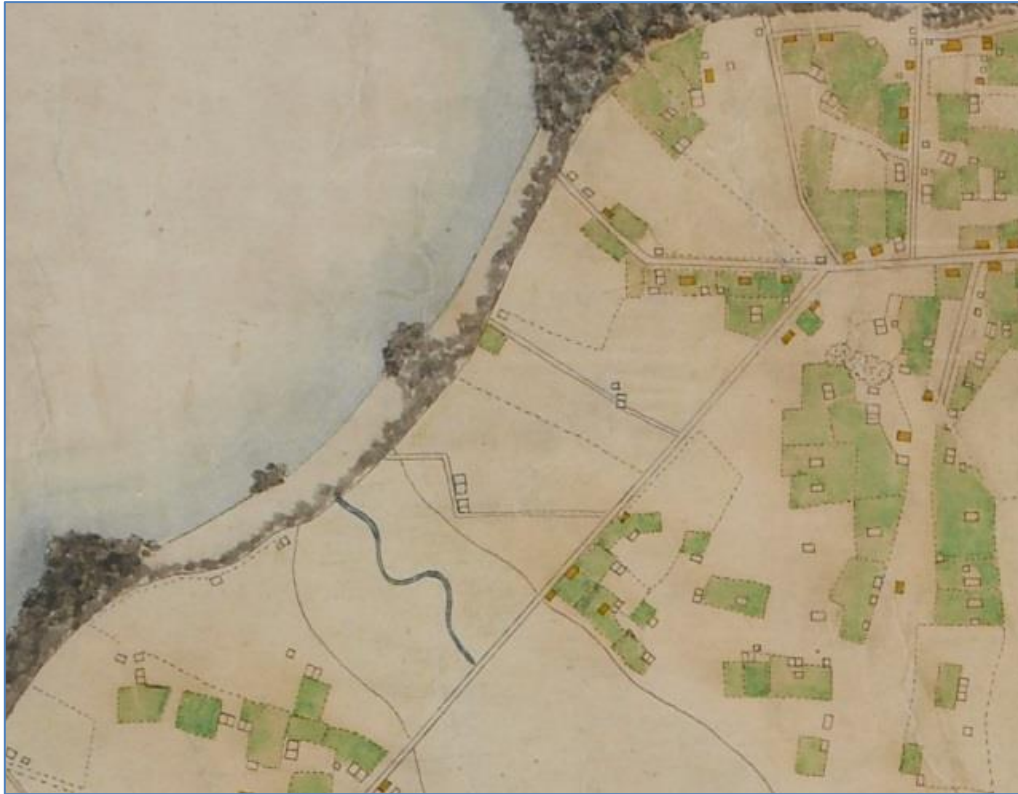
Mynd 3. Hluti af korti Benedikts Gröndal frá 1887. Stórasel er austan við lækinn. Húsin eru sýnd sem tveir tveggja bursta bæir austan við heimtröðina, en hún lá frá Framnesvegi vestur að bæjunum tveimur og til sjávar.

Árið 1888 keypti Reykjavíkurbær Sel og árið 1892 varð jörðin hluti af verslunarlóð bæjarins.