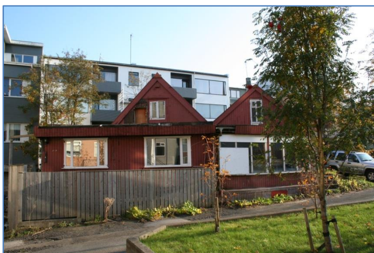
Mynd 8. Stórasel haustið 2014. 13