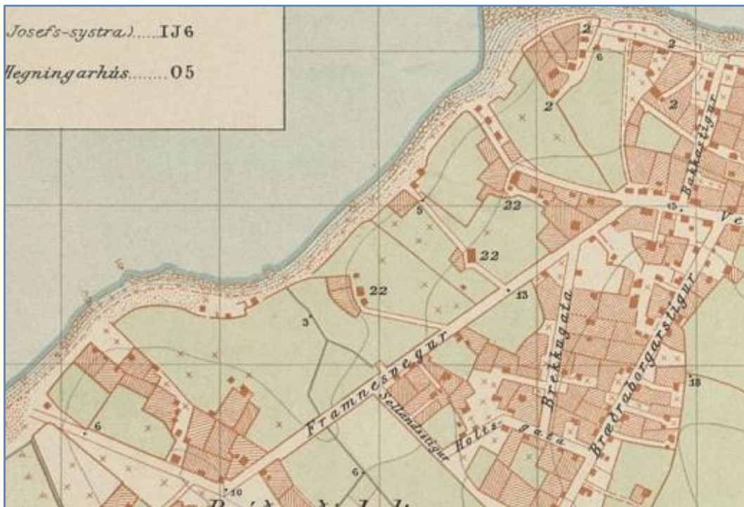
Mynd 4. Hluti af korti Herforingjaráðs frá 1907. Selsbæirnir eru merktir númer 22. Vestast er Stórasel, sem er þá þrjú hús, austar er Miðasel, sem er þá eitt hús og norðaustar eru Litlasel og Jórunnarsel, sem stóðu og standa enn hlið við hlið við Vesturgötu. Ívarssel, sem stóð hinum megin við Vesturgötu, er ekki merkt með tölunni 22.

Árið 1888 keypti Reykjavíkurbær Sel og árið 1892 varð jörðin hluti af verslunarlóð bæjarins.