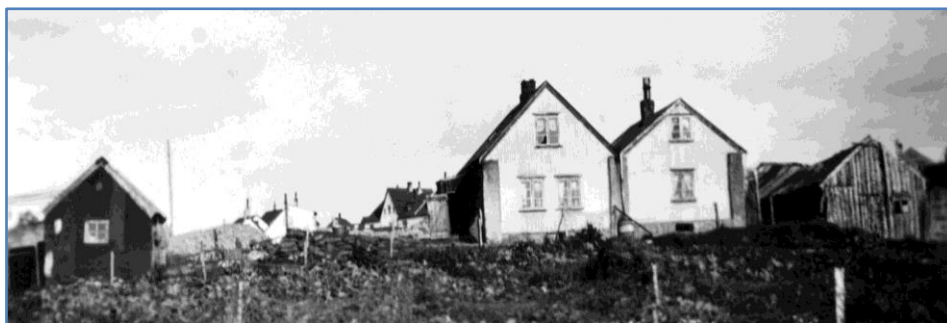
Mynd 6. Stórasel um 1922-1928. 11