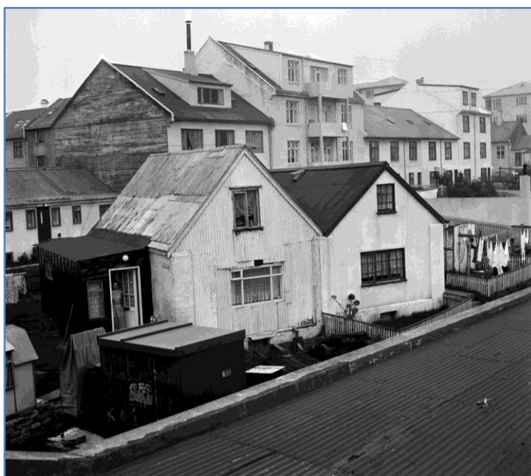
Mynd 7. Stórasel um 1970. 12