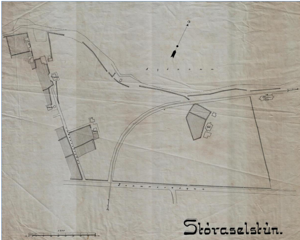
Mynd 5. Kort frá um 1913 sem sýnir Stóraselstún og húsin á Stóraseli, sem eru þá þrjú. Í gegnum túnið voru lagðir brautateinar fyrir jarnbrautina sem fór þar um vegna uppbyggingar á Grandagarði.

Á korti frá 1907 eru húsin við Stórasel orðinn þrjú, miðjuhúsið er það hús sem stendur enn í dag. Sel var um langt skeið hið mesta myndarbýli, með allmiklu túni á alla vegu og fyrirtaks útræði frá Stóraselsvör.