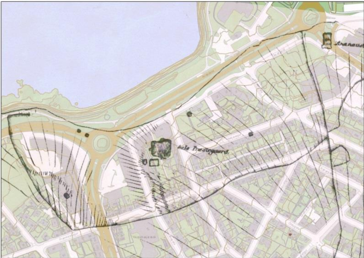
Mynd 1. Hluti af korti frá árinu 1801, sem mælt var og teiknað af Ohlsen og Aanum. Prestssetrið Sel er þar á miðri mynd og tún bæjarins er afmarkað með steinhlöðnum garði. Á kortinu má sjá Ánanaust norðaustur af Seli.

Fram til 1835 tilheyrði jörðin Seltjarnarneshreppi en var þá lögð undir lögsagnarumdæmi Reykjavíkur. 6 Útræði var frá Seli árið um kring og á 19. öld tóku að rísa í landi Sels býli tómthúsanna, en svo kölluðust þeir sem aðalatvinnu höfðu af fiskveiðum á opnum bátum. Tómthúsbylí sem byggðust upp í landi Sels drógu mörg nafn af heimajörðinni og líklega hefur nafn Sels þá breyst í Stórasel. 7 Selsbæirnir voru síðast taldir fimm og voru, auk Stórasels: Miðsel, Litlasel, Jórunnarsel og Ívarssel. Síðasta bæjarhús Stórasels, steinbær sem var reistur á árunum 1884-1893, stendur enn á lóðinni Holtsgötu 41b. Miðsel, steinhús reist 1874, er nú horfið en stóð þar sem nú er húsið nr. 19 við Seljaveg. Ívarssel, timburhús byggt 1869, stóð norðan Vesturgötu á lóðinni nr. 66b allt til ársins 2005 þegar það var flutt í Árbæjarsafn. Litlasel og Jórunnarsel eru sambyggðir bæir, byggðir 1881 og 1889, og standa enn á lóðinni Vesturgötu 61. 8