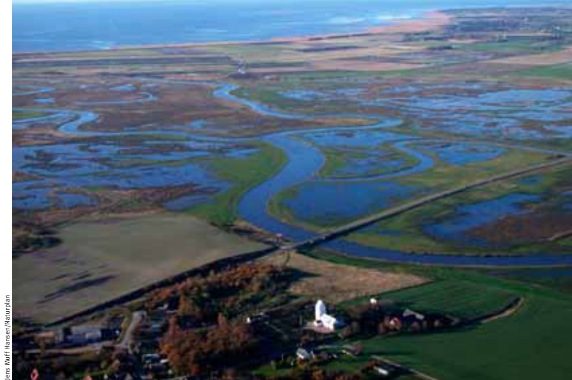
Jens Muff Hansen/Naturplan

Stargoði, Podiceps nigricollis , með unga á tjörn við eitt af bílastæðum svæðisins.