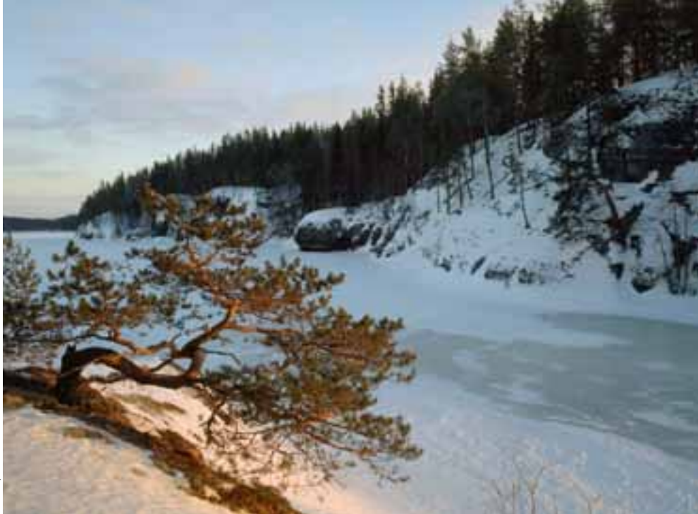
Vetur í Linnansaari.

upplýsingamiðstöð ferðamanna og lítil bryggja fyrir 10 báta, en borga þarf fyrir afnot af bryggjunni. Höfnin er einnig hentug fyrir seglbáta. Á tjaldstæðinu er hægt að kaupa veiðileyfi og kort af svæðinu en einnig er hægt að panta ferð með leiðsögumanni og leigja ýmiss konar útbúnað.