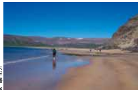
Gengið á ströndinni í Aðalvík.