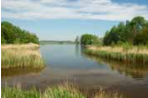
Endurheimt náttúruverndarsvæði við Nakkebøllefjörð.