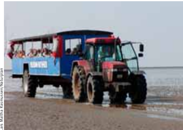
Í ferð með Mandøbussen.