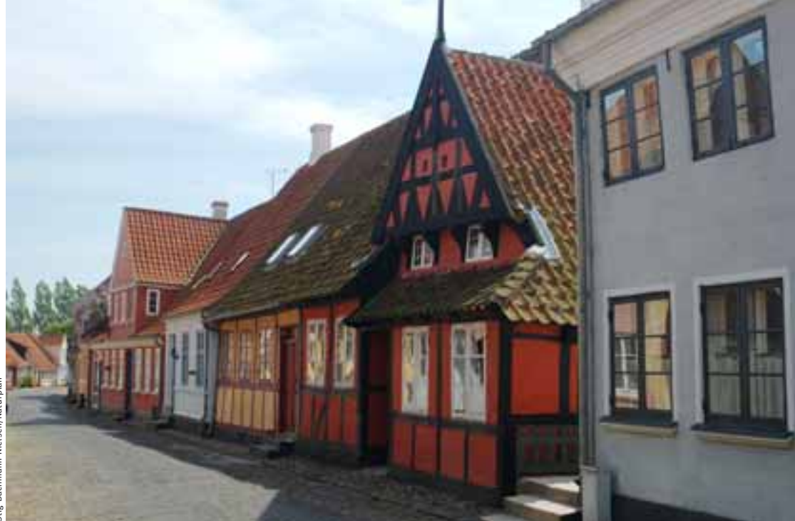
Gömul hús í Ærøskøbing.

Gamlir bæir: Ærøskøbing er sennilega best varðveitta 18. aldar þorpið í Danmörku en þar eru steinlagðar götur og mörg gömul hús. Einnig er þess virði að heimsækja Rudkøbing, „höfuðstað“ eyjunnar Langelands, en þar er hægt að upplifa stemningu gamals kaupstaðar. Í Fåborg er enn hægt að heyra söngva varðmanna yfir sumartímamann. Þar eru mörg vel varðveitt hús og gamlar verslanir. Við suðurströnd Fjónar