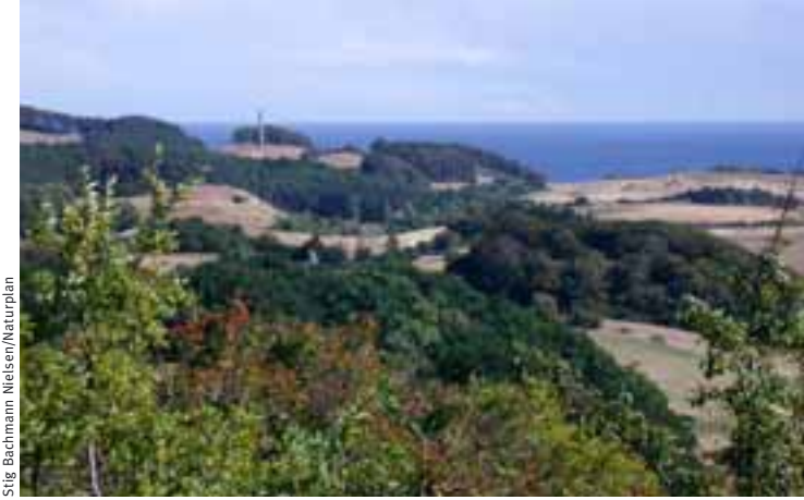
Stig Bachmann Nielsen/Naturplan