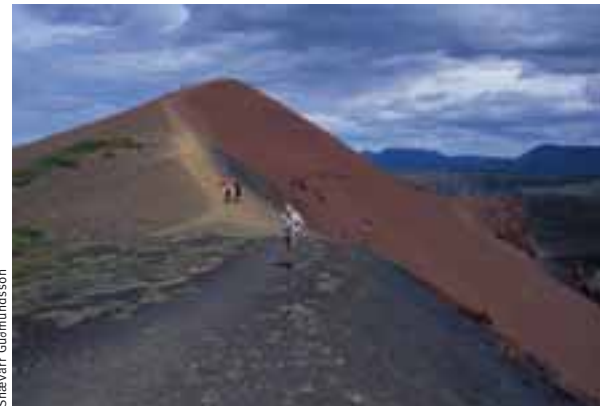
Rauðhólar, hluti af gamalli gígaröð.

Aðrir afþreyingarmöguleikar: Þjóðgarðurinn og nágrenni hans eru tilvalin til fugla-skoðunar því þar má finna ýmiss konar