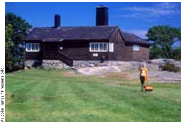
Veiðikofi sem innréttaður er sem gestastofa.

Fuglalífið er fjölskrúðugt. Æðarfugl Soma-