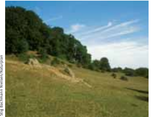
Stig Bachmann Nielsen/Naturplan

Allt árið: Møns Klint er spennandi staður allt árið þó hann sé líklega fallegastur á tímabilinu maí-október þegar skógurinn er í fullum blóma. Þeir sem hafa áhuga á að skoða sjaldgæfar orkídeutegundir ættu að heimsækja svæðið í maí og júní. Á votviðristímabilum á veturna er hættan á hruni meiri en á öðrum árstímum og á ströndinni undir klettunum getur verið erfitt að komast leiðar sinnar.