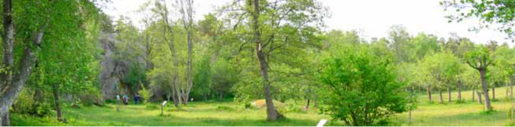
Engi í Boskär.