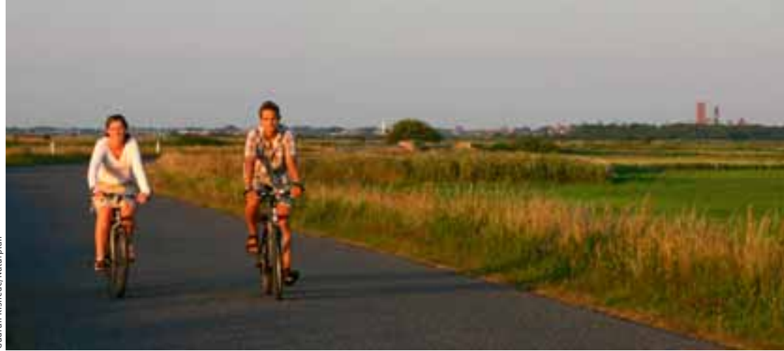
Fólk í hjólréiðatúr um flæðilandið, frá Ribe til Vadehavet. Dómkirkjan í Ribe í bakgrunni.

Sól og strönd: Bestu strendurnar eru á eyjunum Rømø og Fanø og á Skallingen sem er skagi á norðanverðu svæðinu, við vestanverðan Hoflóa, gegnt Vesterhavet. Á nokkrum stöðum er leyfilegt að aka bíl niður á strendurnar en sums staðar eru svæði afgirt og umferð bönnuð til verndar sjaldgæfum