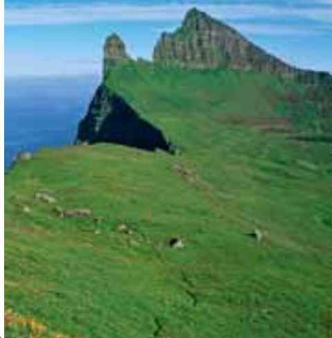
Hornbjarg, hæsti tindurinn er 534 m.

Afskekkt svæði: Hornstrandir búa yfir töfrum sem felast í því hvað svæðið er afskekkt. Þar eru engir vegir, rafmagn, sími eða far-símaþjónusta. Í þannig aðstæðum er auðvelt að ímynda sér þær harðneskjulegu aðstæður sem fólk þurfti að takast á við þegar byggð var á svæðinu.