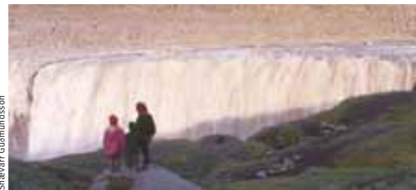
Dettifoss, kraftmikill foss.

er upplagt að fara í Kelduhverfi, Öxarfjörð og Melrakkasléttu. Ramsarsvæðið Mývatn er í um 100 km fjarlægð, heimspekkur fyrir fuglalífð sem þar er og fyrir jarðmyndanir umhverfis vatnið ( www.myv.is ). Frá Húsavík er hægt að fara í hvala- skoðun, daglegar ferðir frá maí til september, sjá upplýsingar á www.husavik.is . Á svæðinu eru nokkur athyglisverð söfn, upplýsingar á www.nordurland.is .