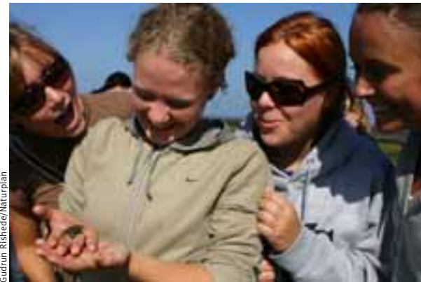
Krabbar skoðaðir í ferðalagi um Vadehavet.

Aðrir möguleikar: Flatt landið hentar vel til hjólaíða. Veiðimönnum má benda á að á vesturluta eyjanna, sérstaklega þar sem straumarnir eru, er gott að beita sandmaðki fyrir flatfisk. Áherslur gestastofanna eru mismunandi eftir árstíðum. Upplýsingamiðstöðvar ferðamanna við Vadehavet veita einnig upplýsingar um menningartengda viðburði á svæðinu.