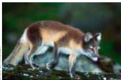
Refur Alopex lagopus konungur Hornstranda.

( www.holmavik.is/info ) veita nánari upplýsingar.