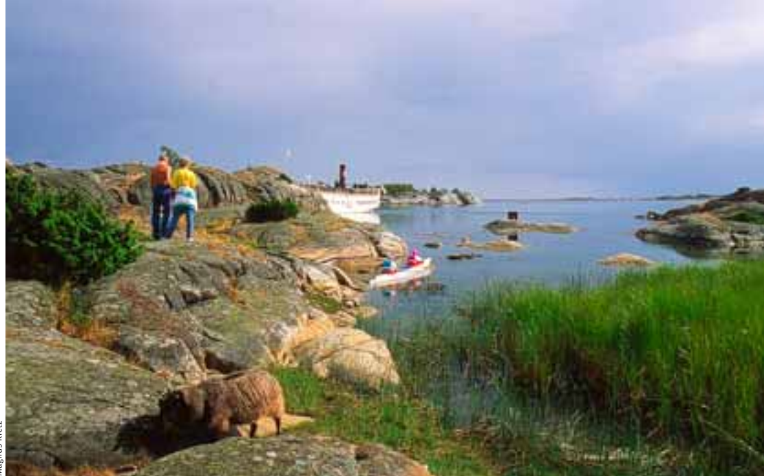
Bulleröneyja með sína beru kletta.