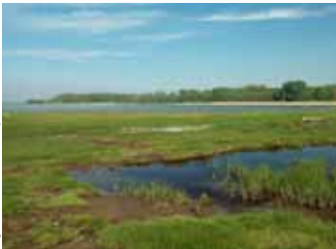
Flæðiengi við suður-fjónsku ströndina.

Menning smáeyjanna: Lyø er ein fallegasta eyjan á svæðinu en þar eru viðkunnalegir bóndabæir, hús með stráþökum og lítil kirkja. Á mörgum eyjum hefur verið haldið í gamlar hefðir sem annars eru horfnar í Danmörku. Sem dæmi má nefna að á eyjunni Avernakø hefur verið varðveitt ákveðin hefð í kringum vorsúluna (majtræet). Á eyjunni Lyø tíðkast þegar gengið er til kirkju að konurnar sitja í norðurhluta kirkjunnar en mennirnir í suðurhluta hennar.