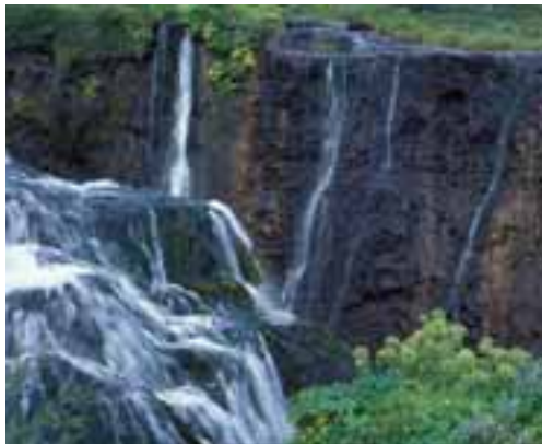
Lindarvatn í Hólmatungum.

Fornir eldgígar: Hljóðaklettur eru mikið vöndurhús af ótal klettaborgum með hellum og skútum í ýmsum stærðum, gömul gígaröð sem áin hefur þvegið allt lauslegt utan af.