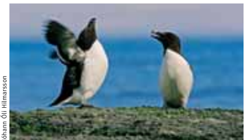
Álkur Alca tarda .

Í nágrenninu eru friðlönd og náttúruvætti sem vert er að skoða ( www.ust.is ), einnig er áhugavert að fara í hvalaskoðun ( www.saeferdir.is ). Utan Þjóðgarðs og í nærliggjandi bæjarfélögum eru margvíslegir afþreyingarmöguleikar, til dæmis söfn og sundlaugar. Upplýsingaskrifstofur ferðamála veita allar nánari upplýsingar. Einnig er vert að benda á heimasíðurnar www.west.is , www.snb.is , www.stykkisholmur.is , og www.grundarfjordur.is .