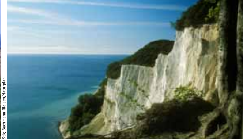
Stig Bachmann Nielsen/Naturplan