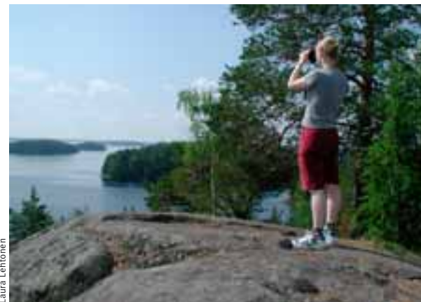
Hjáleiga í Linnansaari.