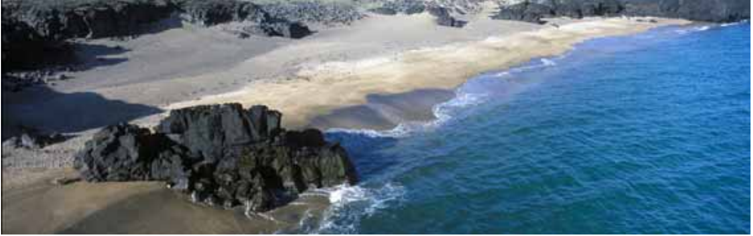
Sandströndin í Skarðsvík.

arins liggur vegslóði að bílastæði við Írskrabrunn. Stutt, stikuð leið er á milli Írskrabrunns og Gufuskálavara. Í vörinni má greinilega sjá för eftir kili báta.