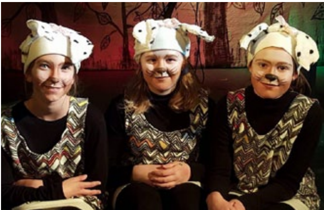
Dýrin í Hálsaskógi

sýningar þar sem 36 manns tóku þátt. Þar sem ekki var unnt að sýna fleiri sýningar á þeim tíma, stefnum við að því að setja sýninguna upp aftur í haust og vonandi verður það gerlegt.