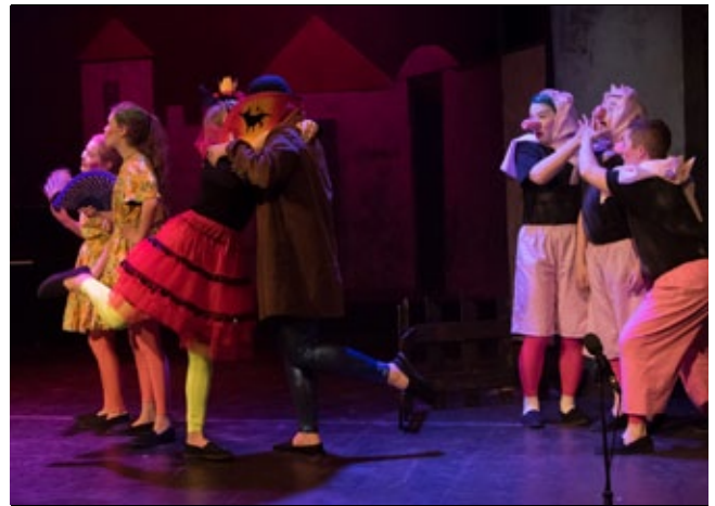
Klaufar og kóngsdætur