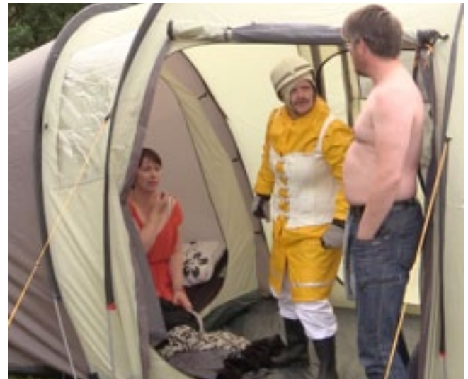
Aftur til nútíðar