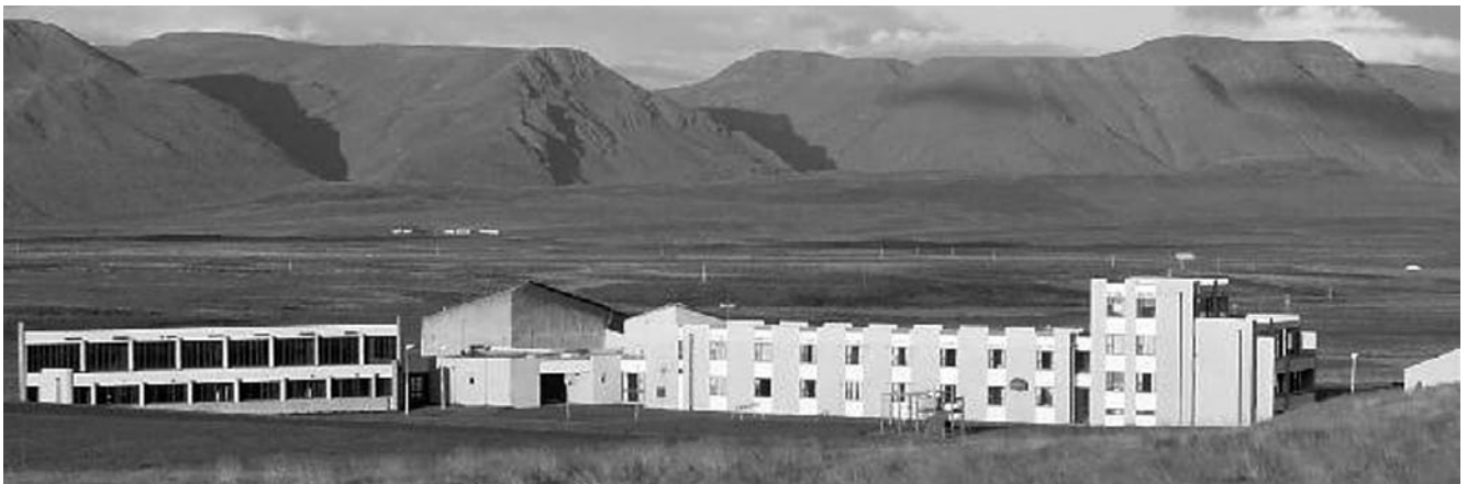
Húnavallaskóli í Húnavatnshreppi