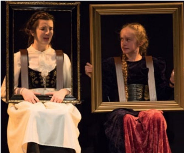
Leitin að Jólalandinu

í öðru sæti 2014. „Jólanótt Viktoríu“ var í 2. sæti 2013, „Jólaævintýrið“ skipaði 1. sæti 2012. Vorum í 2. sæti 2011 með „Óværuengla“ og 4. sæti 2010 með „Leikfangalíf“. Alltaf ánægjulegt að sjá árangur erfiðis síns og að almenningur kunni að meta það sem við höfum fram að færa. Sérstaklega þar sem allt er þetta frumsamið efni sem keppir við t.a.m. Astrid Lindgren og fleiri mæta leikrita-höfunda