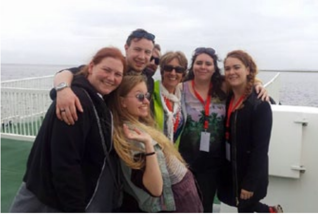
Hluti af íslenska hópunum með vinum okkar frá Írlandi

Gilitrutt, Bakkabræður og Djákninn á Myrká. Sýningin tókst í alla staði vel og fékk frábærar viðtökur með sínar skrítnu persónur, kaldhæðna húmor og þjóðlegan söng. Hópurinn var þrúspurður um atvinnumennsku sína í faginu en hafði aðeins áhugamennsku upp á að þjóða.