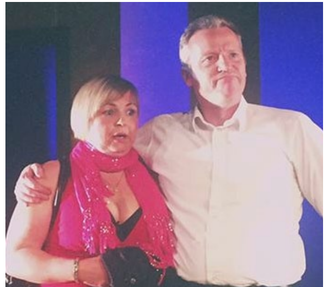
Híð vikulega, ágúst 2015

Innan sólarhrings var okkur tilkynnt að, einungis í febrúar, þá myndum við missa 7 æfingardaga, og einnig var óskað eftir því að við myndum sleppa 2 æfingadögum í viðbót í febrúar. Okkur fannst illa að okkur vegið og sendum við harðort bréf til bæjarins þar sem við tíunduðum það sem við töldum vera brot á samningi. Þar sem enginn menningarfulltrúi er starfandi þá var bréfið sent á bæjarfulltrúa, menningarráð og fleiri. Eftir á að hyggja þá hefðum við einungis átt að senda kvörtunina á forstöðumann Hafnarborgar og menningarráð, en við vorum ráðþrota og vildum fá skjót viðbrögð.