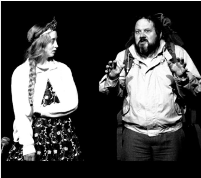
Ballið á Bessastöðum

22. nóv á afmæli BÍL var haldin afmælisvaka í Sýslumannshúsinu þar sem þrjú stuttverk sem valin voru úr stuttverkasamkeppni BÍL og voru þau flutt af meðlimum LH með tónlistar- og kaffiívaði. Þetta var skemmtilegt og tókst með ágætum.