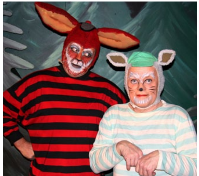
Dýrin í Hálsaskógi

Í jólamánuðinum 2015 var mikið að gera hjá jólasveinunum sem þjónusta leikfélagið. Þeir voru viðstaddir þegar kveikt var á jólatré Hveragerðisbæjar, báru út pakka til barna í Hveragerði á aðfangadag jóla, þjónusta sem vex ár frá ári. Þátttaka aldrei verið eins mikil og um þessi jól. Jólasveinarnir komu fram á Jólaballi Lions á Hótel Örk á annan í jólum. Salurinn var troðfullur af þrúðbúnum börnum og fullorðnum. Lionsklúbbur Hveragerðis á miklar þakkir skyldar fyrir þetta framtak.