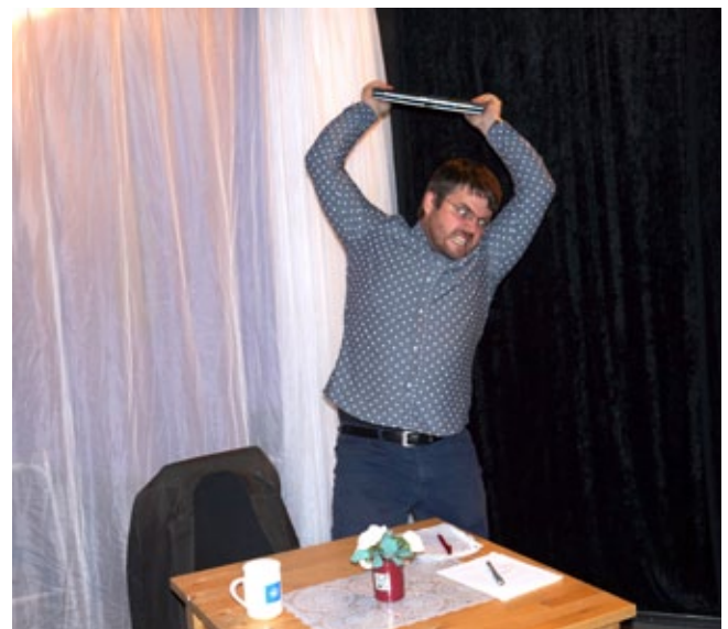
Einn rjúkandi kaffibolli