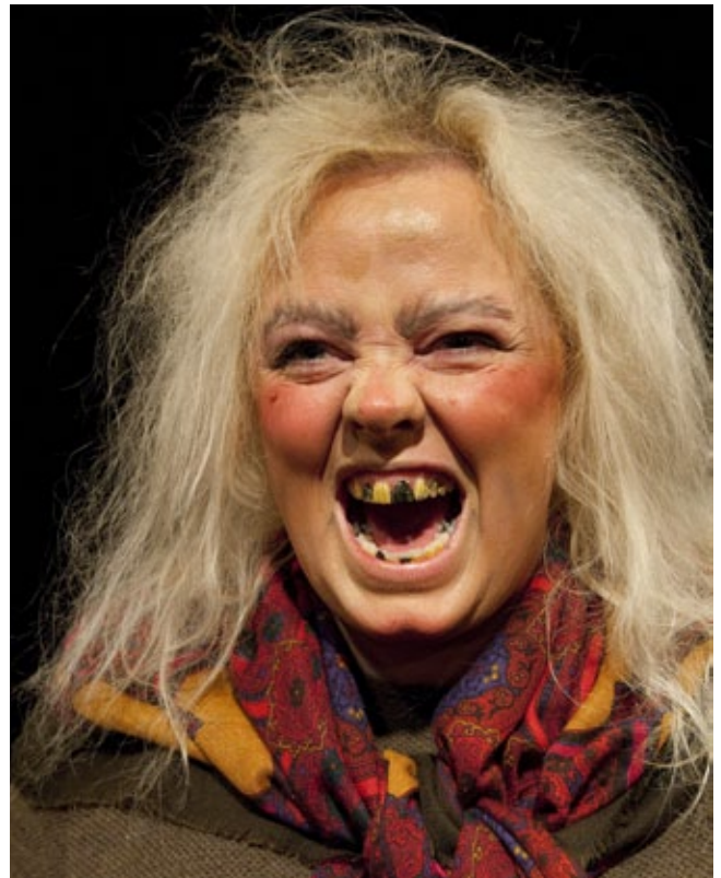
Kjánar og kynlegir kvistir

Leikfélagið réðst í þónokkrar framkvæmdir innanhúss síðasta sumar. Fyrir lá að klára að skipta um ofna í húsinu, nánar tiltekið í salnum. Þar sem rífa þurfti upp hluta af gólfinu í salnum var ákveðið að nýta tækifærið og rífa það allt upp og gera úrbætur á festingum fyrir sætin auk þess að skipta um teppi. Einnig voru klósett á efri hæðinni tekin umtalsvert í gegn.