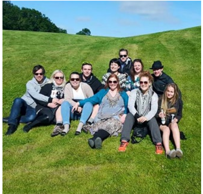
Allur hópurinn á grösugum lendum Danaveldis

Alls voru sýndar 10 sýningar frá 6 þjóðum. Mikil gleði og vinátta ríkti á hátíðinni þar sem allra þjóða kvikindi tóku saman lagið á kvöldin á ýmsum tungumálum en því er ekki að neita að íslenski hópurinn var ansi fyrirferðarmikill. Gestgjafarnir tóku því mjög svo fagnandi þegar hljómsveitin Viðriðin, sem var eins konar fjárflyunarverkefni fyrir ferðina, tók að sér að spila hátt í heila tónleika að loknum kvöldverði á lokakvöldinu.