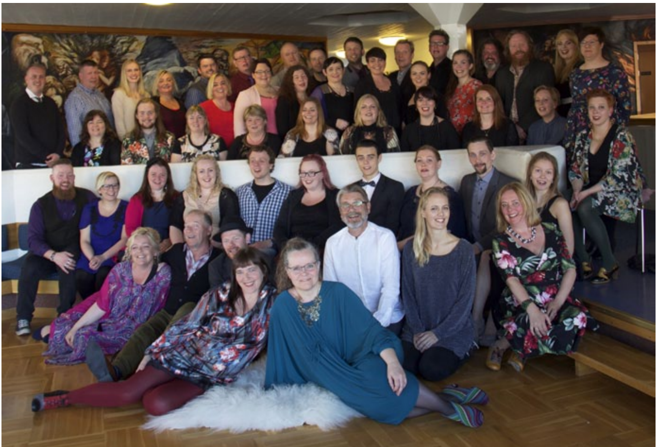
Allur hópurinn sparíklæddur fyrir lokakvöldverðinn