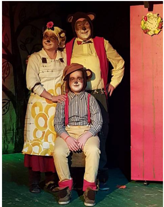
Dýrin í Hálsaskógi