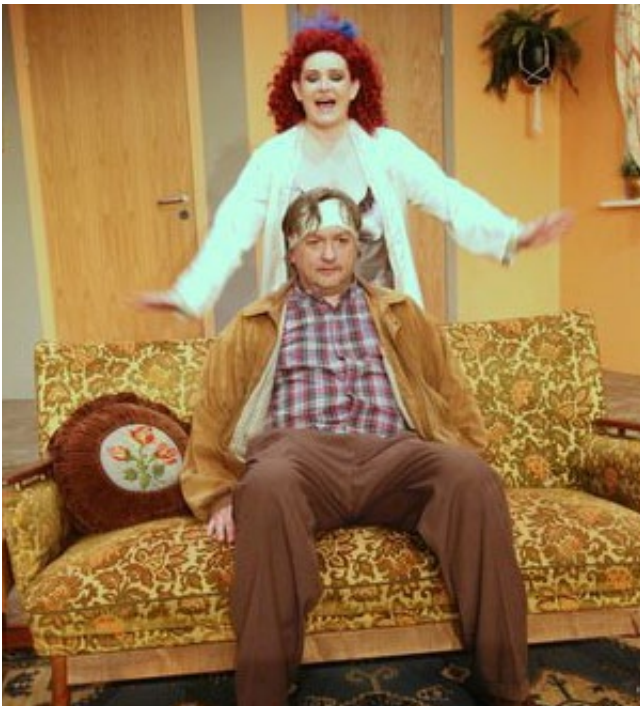
Með vífið í lúkunum