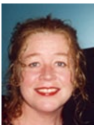
Skólanefnd Hrunn Ólafsdóttir Reykjavík