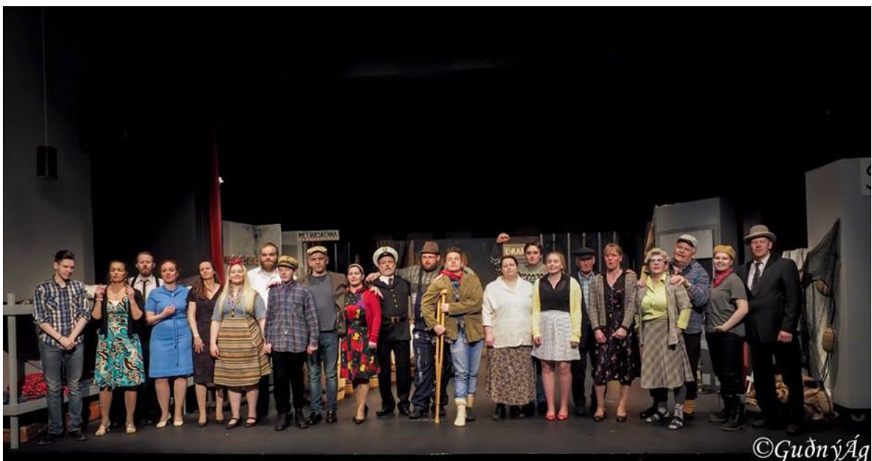
Síldin kemur og síldin fer