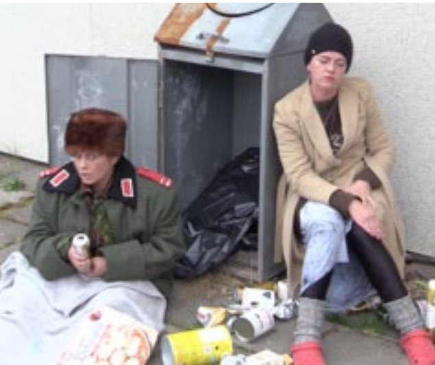
Beðið eftir strætó