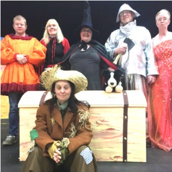
Galdrakarlinn í Oz