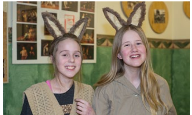
Dýrin í Hálsaskógi