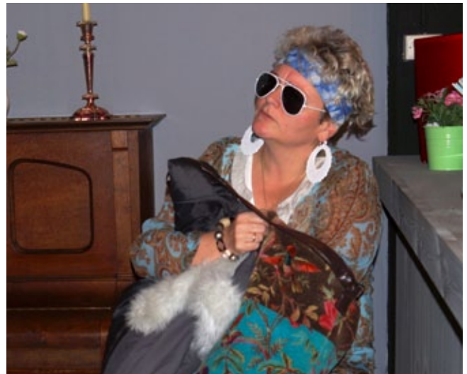
Einn rjúkandi kaffibolli

Ég vil hvetja félagsmenn til að fylgjast með á heimasíðu Bandalagsins, leiklist.is og kynna sér starfsemina betur og lesa fundargerð aðalfundarins þegar hún verður birt. Einnig vil ég benda félagsmönnum á að skrá sig á facebookhópinn Landsnet áhugaleikfélaga á Íslandi en þar er hægt að eiga samskipti við fólk í leikfélögum víðsvegar um landið.