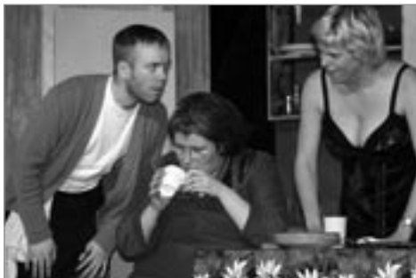
Fiskar á þurru landi

ungu meðlimir leikfélagsins. Með félaginu og Sauðfjársetrinu á Ströndum hefur verið mikil og góð samvinna, var sú samvinna einnig í gangi sumarið 2005. Tóku félagar þátt í Furðuleikum með því að keppa í hinum ýmsu greinum klæddir hinum skrýtnustu búningum og yngri kynslóðinni var boðið upp á andlitsmálun. Síðan tók leikfélagið að sér að sjá um skemmtidagskrá á Bændahátíð sem vera átti í lok sumars en var aflýst vegna ónógrar þátttöku.