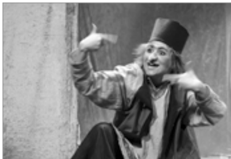
Hodja frá Pjort