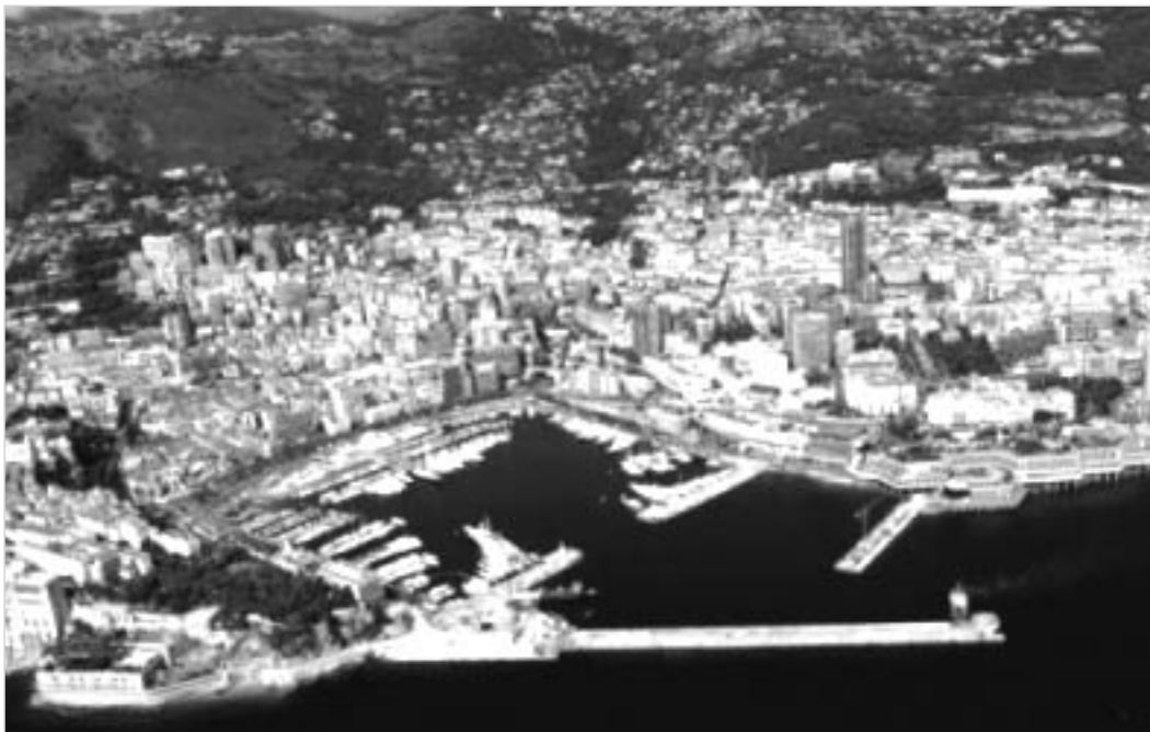
Það er bæði þéttbýlt og bratt í smárikinu Mónakó