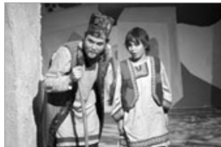
Leikfélag Hafnarfjarðar, Hodja frá Þjort