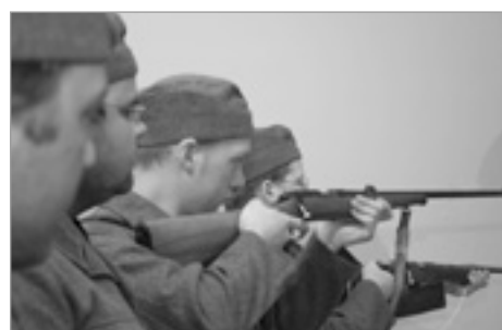
Dagrenning, Sveyk í síðari heimsstyrjöldinni