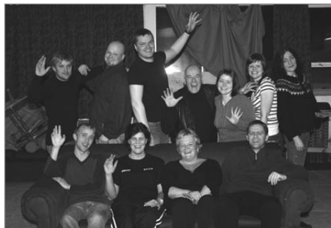
Með vífið í lúkunum