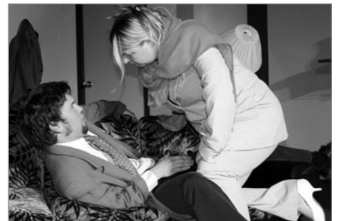
Sex í sveit

Af öðrum viðburðum sem leikfélagið kom að má nefna 100 ára afmæli Lagarfljótsbrúarinnar, Grýlugleði sem haldin var á Skriðuklaustri, Pálsvaka sem haldin var með stórkostlegum hætti í Safnahúsi Austurlands og opnun bensinstöðvarinnar Orkunnar.