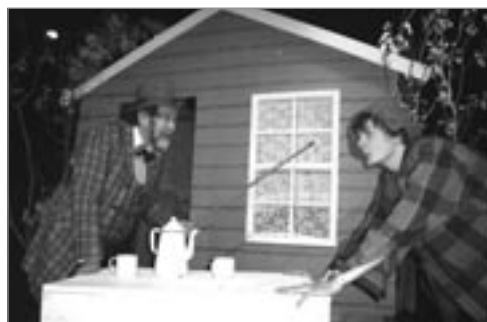
Litli Kláus og stóri Kláus