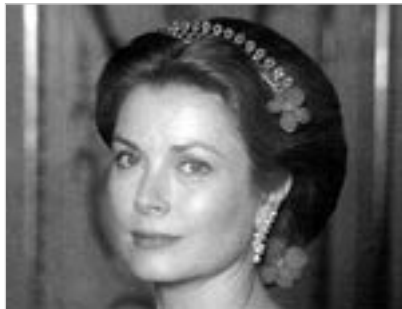
Annað leikhúsið var kennt við Grace prinsessu

Gert í Reykjavík 25. ágúst 2005 Vilborg Á. Valgarðsdóttir.