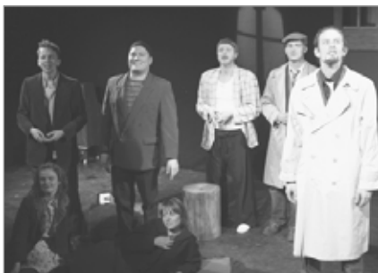
Leikfélag Kópavogs, Það grær áður en ...