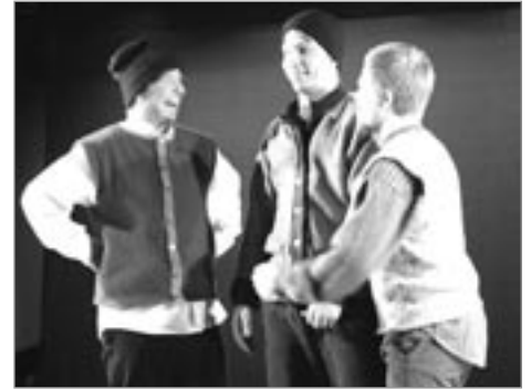
Puríður formaður og Kambsránið

Pátttakendur: 22 Sýningar: 20 Áhorfendur: 1200