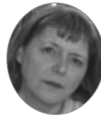
Skólanefnd Hentís Þorgeirsdóttir Mosfellsbæ