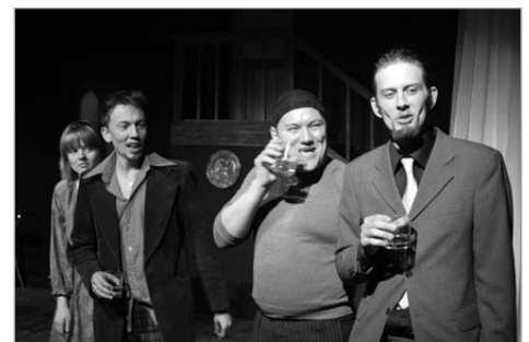
Það grær áður en þú giftir þig

LK fór í leikferð með tvær sýningar á Leikum núna! leiklistarhátíðina á Akureyri sem fram fór í júní sumarið 2005.