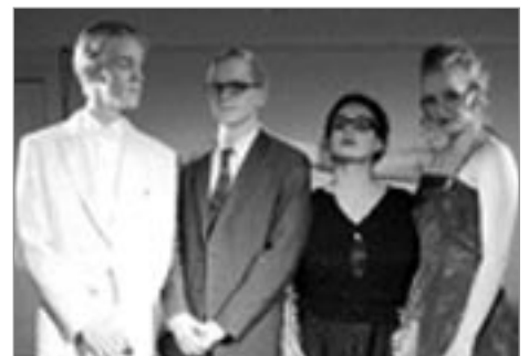
Fyrir luktum dyrum