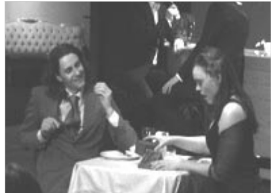
Í öruggum heimi

Gagnrýnendur völdu sýningu Hugleiks, Í öruggum heimi, bestu sýningu hátíðarinnar. Einnig tilnefndu þeir sýningar Leikfélags Selfoss, Geirþrúður svarar fyrir sig, og sýningu Hugleiks, Hannyrðir.