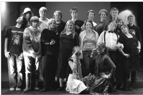
Petta er strútur, skiluru