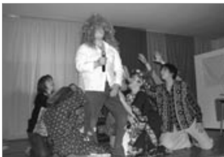
Ég elska alla