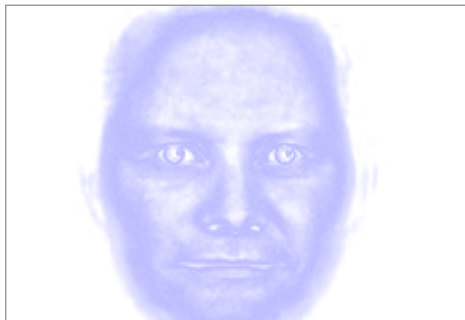
Hin endanlega hamingja