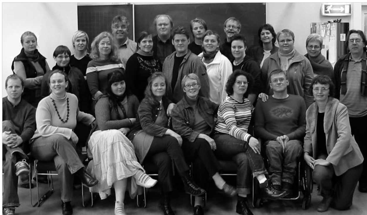
Hópmýnd af þátttakendum á fyrirlestrarhelgi Leiklistarskólans, einhverja vantar þó á myndina