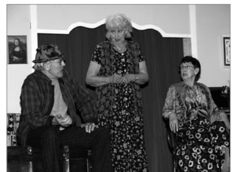
Glæpir og góðverk