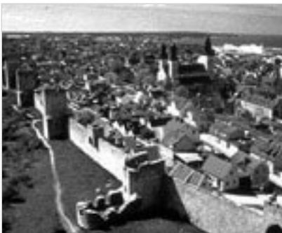
Séð yfir hluta Visby-borgar