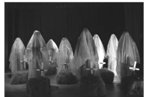
Vekjum upp draug

eftir leikhópin og leikstjórnann Margréti Tryggvadóttur. Þátttakendur: 7 Sýningar: 1 Áhorfendur: 200