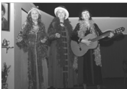
Snúður og Snælda, Glæpir og góðverk