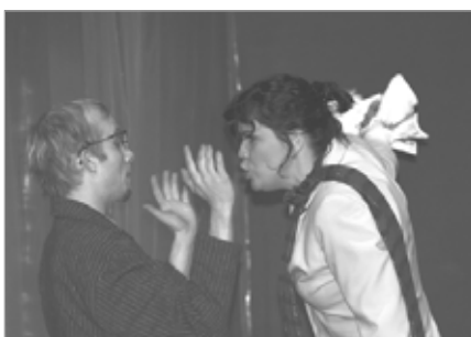
Leikfélag Sauðárkróks, Með vífið í lúkunum