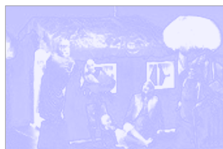
Leikfélag Vestmannaeyja, Skilaboðaskjóðan