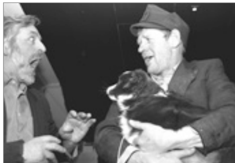
Sveik í síðari heimsstyrjöldinni