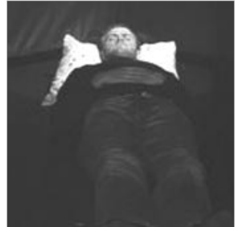
Það er frítt að tala í GSM hjá Guði