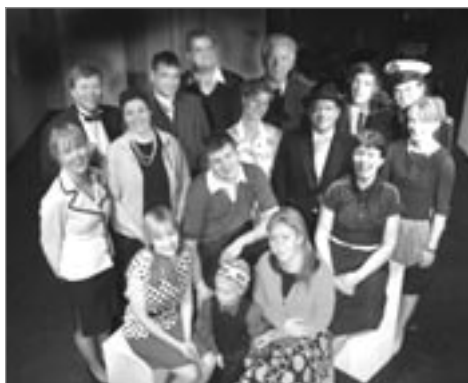
Prek og tár