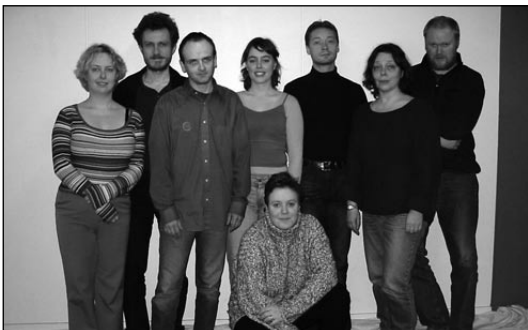
Upprunalegir leikarar og leikstjóri í Undir hamrinum ...