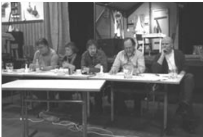
Hluti stjórnar og fundarstjórar