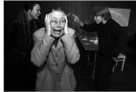
Snemma beygist krókurinn

höfundur Sigurður H. Pálsson, leikstjóri Guðmundur Erlingsson. Þátttakendur: 6 Sýningar: 2 Áhorfendur: 120