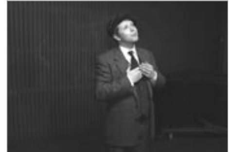
Hefur einhver sagt þér hvað þú ert líkur...