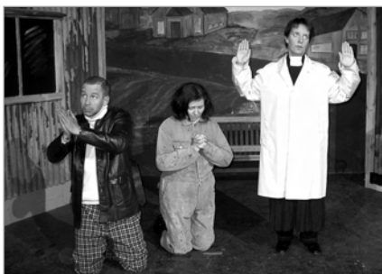
Leikfélag Reyðarfjarðar, Álagabærinn