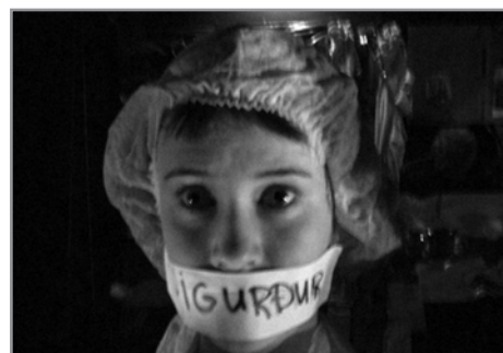
Davíð Oddsson – súperstar