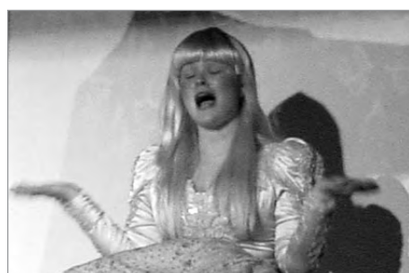
Leikfélag Mosfellssveitar, Ævintýrabókin