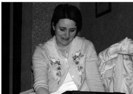
Freyvangsleikhúsið, Taktu lagið Lóa