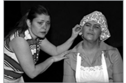
Prek og tár