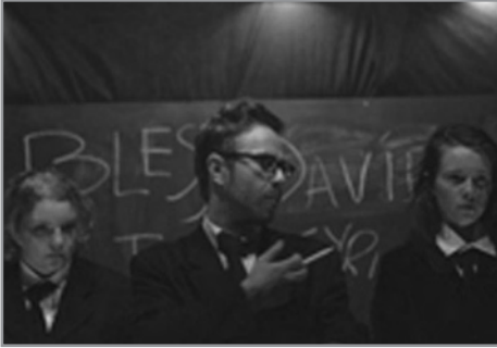
Pú veist hvernig þetta er