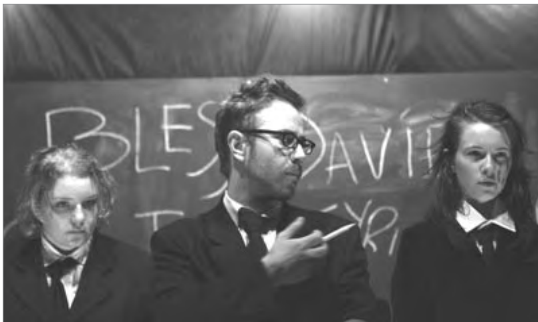
Úr sýningu Stúdentaleikhússins Þú veist hvernig þetta er