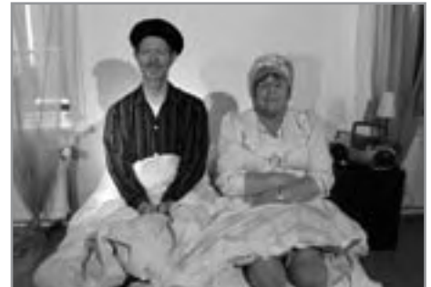
Þetta mánaðarlega – haust