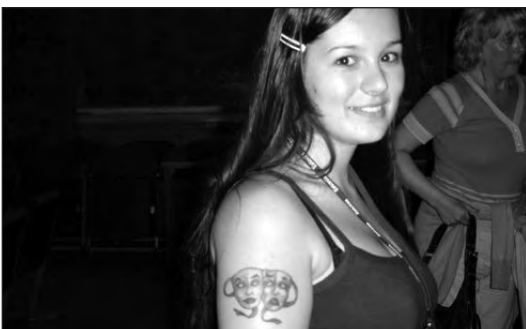
Ung blómarós með grímu-tattú á handleggnum