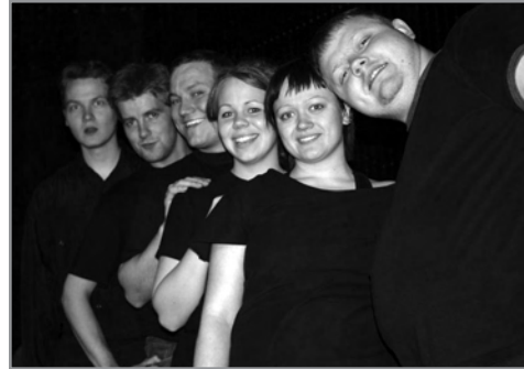
Allra kvikinda líki

Æfingar á Memento mori hófust af fullum krafti síðari hluta september í húsnæði Hugleiks að Eyjarslóð. Var æft þar framan af æfingatímabili en síðan fluttu menn sig í Hjúleiguna enda hafði verið tekin ákvörðun um að sýna þar. Sýningin var síðar frumsýnd í lok nóvember og fékk sérlega góða gagnrýni. Voru menn á einu máli um að hér væri á ferð afar frumleg og eftirtektarverð leiksýning sem skildi mikið eftir sig hjá áhorfendum. Valnefnd Þjóðleikhússins um Athyglisverðustu áhugaleiksýningu ársins sá enda ástæðu til að minnst sérstaklega á Memento mori í greinargerð sinni. Sýningin var sýnd nokkrum sinnum fyrir áramót og var tekin upp að nýju eftir jólahlé.