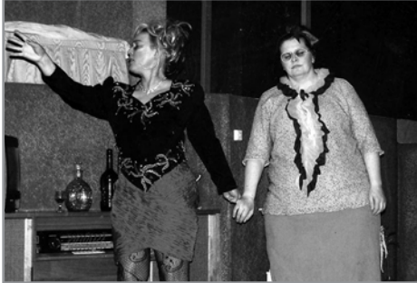
Taktu lagið Lóa