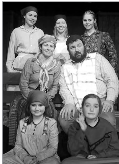
Fiðlarinn á þakinu