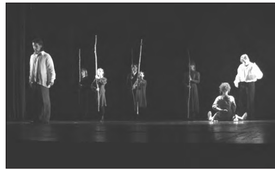
Úr sýningu Litháa