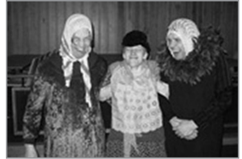
Skemmtiatriði á þorablóti

Á aðalfundi leikfélagsins í júní 2004 var ákveðið að halda upp á 60 ára afmæli félagsins. Skipuð var afmælisnefnd og tók hún til starfa um haustið.