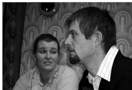
Leikfélag Hafnarfjarðar, Að sjá til þín maður