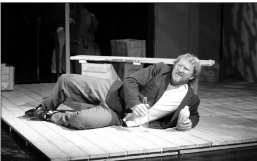
Úr sýningu Svía