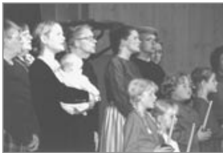
Í meðbyr og mótbyr