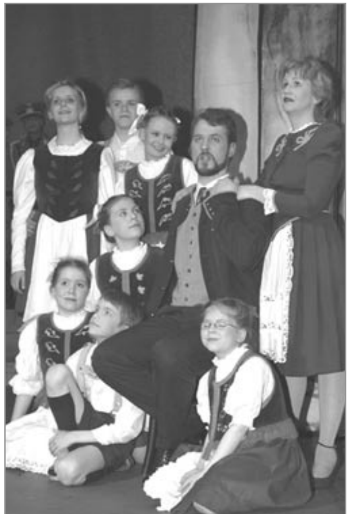
Úr Söngvaseið Litla leikklúbbsins

(Það má taka það fram hér í lokin að sýndar voru þrjár sýningar í Þjóðleikhúsinu fyrir fullu húsi og ætlaði fagnaðarlátum áhorfenda aldrei að linna. VV)