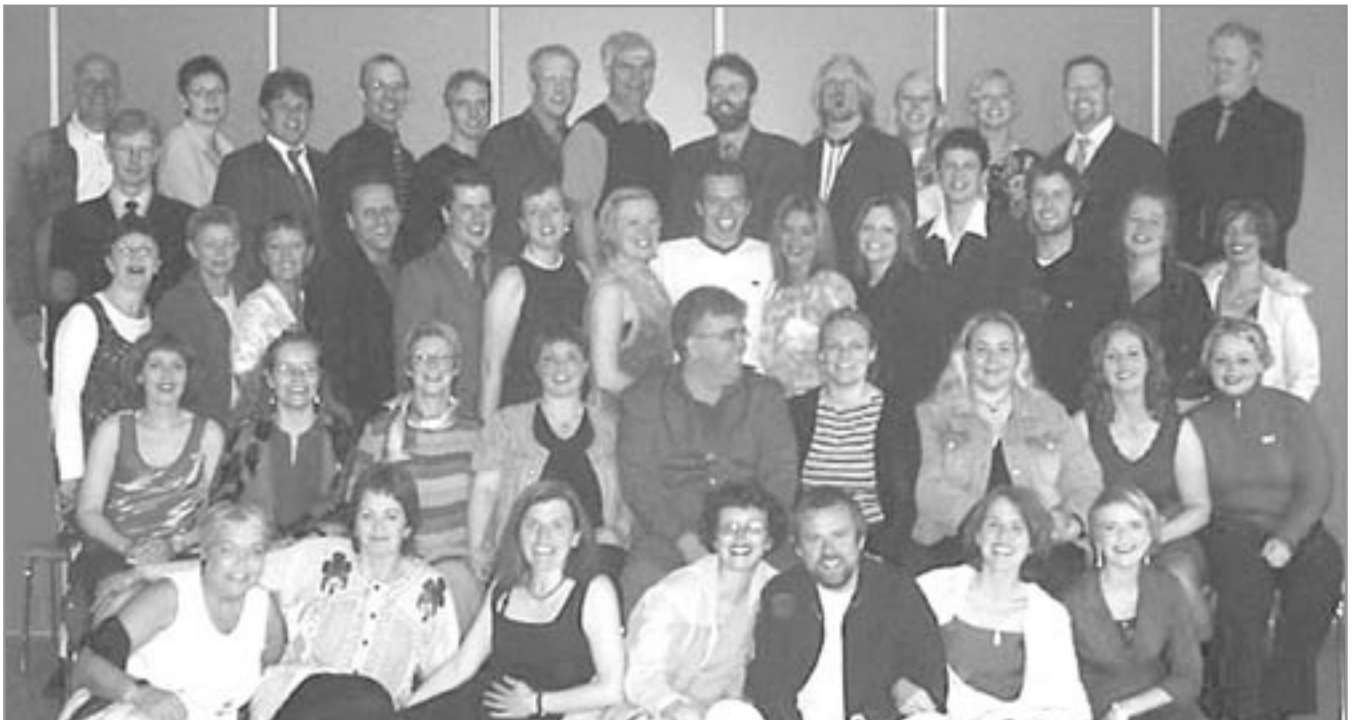
Allur hópurinn á Húsabakka