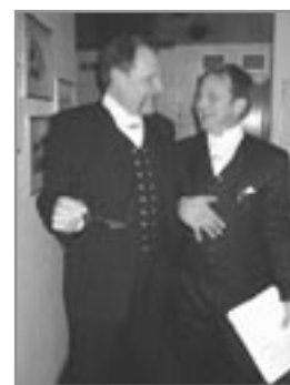
Glæsilegir fulltrúar Litla leikklúbbsins taka á móti gestum