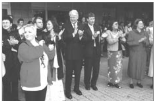
Frá setningu fyrstu alþjóðlegu leiklistarhátíðarinnar sem Bandalagið stóð fyrir á Akureyri árið 2000.