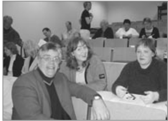
Fundarmenn létu ekki karp um lagabreytingar spilla góða skapinu