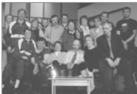
Ef væri ég gullfiskur