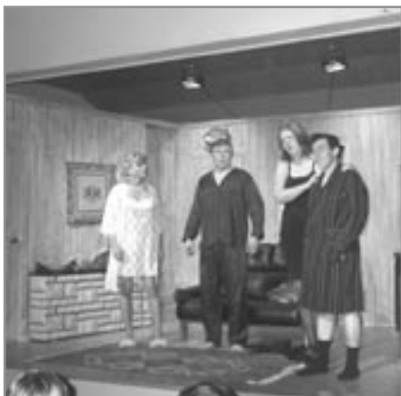
Sex í sveit

Pátttakendur: 15 Sýningar: 1 Áhorfendur: 100