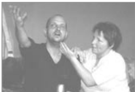
Taktu lagið Lóa