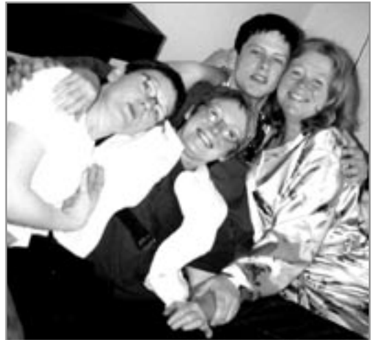
Greinarhöfundur í góðra vina hópi lengst t.h.

Sköpunarkraftur. Gleði. Vinna. Vinna og aftur vinna við það sem er skemmtilegast að gera. Loka leiklist með fjörutíu til fimmtíu öðrum manneskjum sem eru sama sinnis. Vinna með fólki sem nýtur þess að vera saman í tíu daga í litlum dal, umvafin óviðjafnanlegri náttúru. Uppgötva ár eftir ár að reynslan er alltaf ný; að nýtt undur verður til hvert sinn.