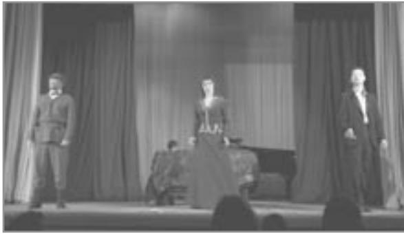
Bíbí í Gatchina. Þrísöngur um ástir og þrár.