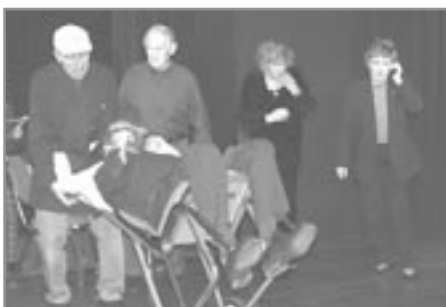
Forsetinn kemur í heimsókn