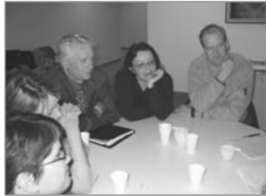
Hluti fundarmanna ræðir starfsáætlun komandi leikárs

Viðhald fari fram eins og stjórn þykir hæfa. Aðgengi — er mögulegt að „neyða“ félagi okkar í húsfélaginu til að taka