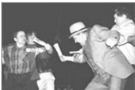
Prek og tár