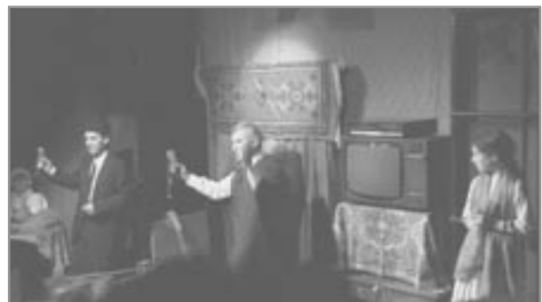
Úr sýningu Dagestanmanna: Kákasísk skálaræða flutt.

Strax annað kvöldið komu gestir til okkar á heimavistina. Tveir hressir kallar, einn aðal (sem vissi af því), hinn þögull með gítar og nef. Upphófst mikil gleði og skemmtu þessir kumpánar okkur lengi kvölds með gítarspili og söng. Þarna voru komnir tveir brottfluttir Kákasusmenn, nánar tiltekið frá Dagestan og varð þetta upphafið á fagurri vináttu þessara leikhópa. Hinir skemmtilegustu kallar sem þurftu mikið að skála, faðma og dansa og ekki spillti að gítarleikarinn hljóðláti og nefstóri var afburðagóður. Sýningin þeirra, sem þeir kölluðu „My Dagestan“ var eftirminnileg. Hún minnti einna helst á hina rómuðu túristasýningu Light Nights, og samanstóð af skálaræðum, söngvum, kynningu á ýmsum munum úr átthögunum og vídeóupptöku af stórfjölskyldu aðalleikarans og honum sjálfum á yngri árum. Minna fór fyrir eiginlegri leiklist, hvað svo sem það nú er. Á meðan á sýningunni stóð gekk dóttir leikarans (á að giska 8–9 ára) um beina, skenkti mönnum Kákasusvín í silfurslegin horn og bauð upp á þurrkaðar apríkósúr. Svo voru menn teknir upp í einhverskonar mínímalískum kósakkadansi og fengu svo að horfa á sig á myndbandinu í lok sýningar. Þetta var hin ljúfasta stund með vinum okkar, en gagnrýndum hátíðarinnar var ekki skemmt og hundskömmuðu félagana fyrir að bjóða upp