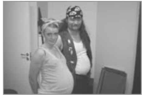
Herbergi með útsýni

eftir Ármann Guðmundsson, Gunnar Björn Guðmundsson og leikhópin, leikstjóri Ármann Guðmundsson. Þátttakendur: 13 Sýningar: 14 Áhorfendur: 290