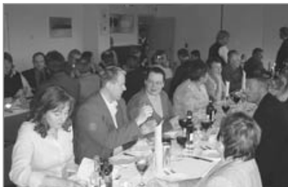
Fundargestir í sínu fínasta þússi