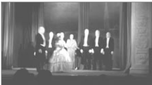
Yfirfrakki Gogols – listrænn hápunktur hátíðarinnar.

Frá Kemerovo í sunnanverðri Mið-Síberíu kom lítill leikhópur með stóra sýningu. Allavega verður hún stór í minningunni þó hún væri leikin á litlu sviði, með leikmynd sem samanstóð af þremur stólum og vatnsfylltu vaskafati, og þremur leikurum í betri fötunum. Og svo var ekkert leikrit, heldur sögðu þremmingarnir okkur tvær sögur – ævintýri. Og ólíkt því sem oft er gert í svona frásagnarleikhúsi þá gerðu þau enga tilraun til að „leika“ það sem gerðist – brugðu sér ekki í hlutverk og sýndu ekkert látbragð nema með svipsterkum andlitunum. Nei, þau sögðu bara sögurnar – á rússnesku að sjálf sögðu – í einn og hálfan tíma. En einbeitingin, fókusinn, nærveran og „intensitetið“ var þvítíkt að við málleysingjarnir stöðrum hugfangin á – allan tímann. Eiginlega vorum við orðin eins og hvítvoðungar sem stara á þann sem hjalar við þau án þess að skilja bofs. Vissulega skildum við ekki hvað verið var að segja, en sýningin skildi eftir sig nýja vidd í skilningnum á hvað leikhús er og getur. Dýrmæt reynsla, og dæmigerð fyrir þau verðmæti sem maður fer með heim af svona hátíðum þegar vel tekst til. Seinna kynntumst við þessu fólki og ekki dró það úr gleðinni – algerir öðlingar af túndrunni.