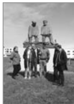
Fyrst var farið í skoðunarferð um bæinn