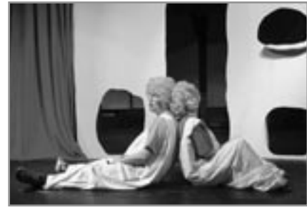
Karíus og Baktus