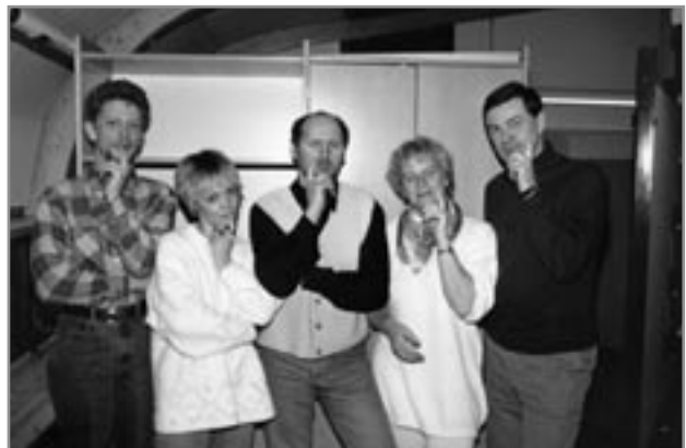
Stjórnin, sem var svo stórhuga að láta Bandalagið festa kaup á eigin húsnæði árið 1995.