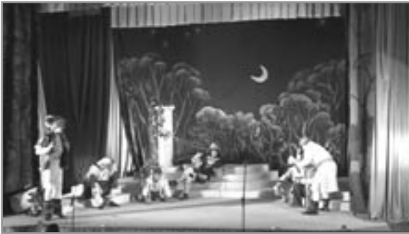
Rússneskir handverksmenn æfa Píramus og Pispu. Bokki (lengst til vinstri) fylgist með.

hreyfa varirnar þegar mótleikarar hans töluðu, og Óberon sem var leikinn af náunga sem fannst hann greinilega flottastur en leið nokkuð fyrir það að vera alveg heiftarlega smámæltur. Í landi hinna þúsund ess-hljóða er það engin smá fötlun, og varð álfakóngurinn sem því nam minna konunglegur og meira hlægilegur. Það fannst í það minnsta hinum illkvittnu Íslendingum. Hreindýrshornin á höfði hans drógu hreint ekki úr þórðargleðinni.