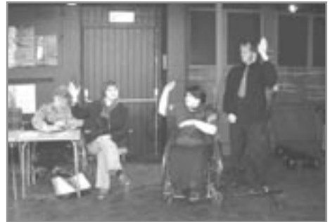
Á fjöllum félagsins – 10 ára afmælisýning

Dagskrá samin af Kristínu R. Magnúsdóttur, leikstjóri Edda Vilborg Guðmundsdóttir. Þátttakendur: 23 Sýningar: 2 Áhorfendur: 120