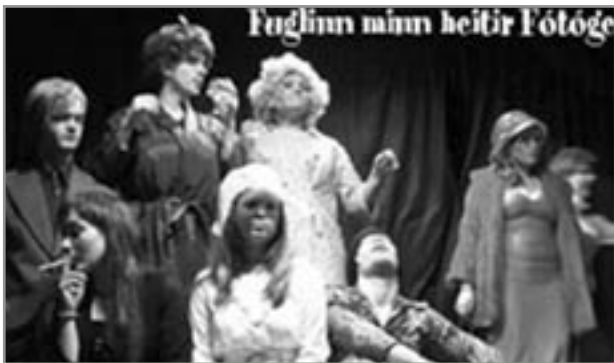
Myndin t.v. er úr sýningu Leikfélags Fjölbrautaskóla Suðurlands, Fuglinn minn heitir fótógen, sem að mati greinarhöfundar var besta sýning leikársins.