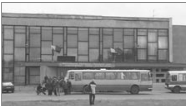
Fyrir utan eitt menningarhús hátíðarinnar í Gatchina. Hópurinn býður þess að hleypt sé inn