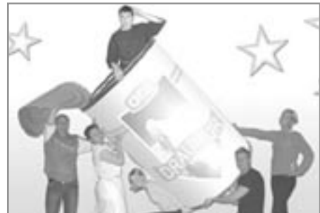
Draumur í dós

Þátttakendur: 6 Sýningar: 2 Áhorfendur: 90