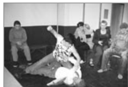
Gengið á hælina