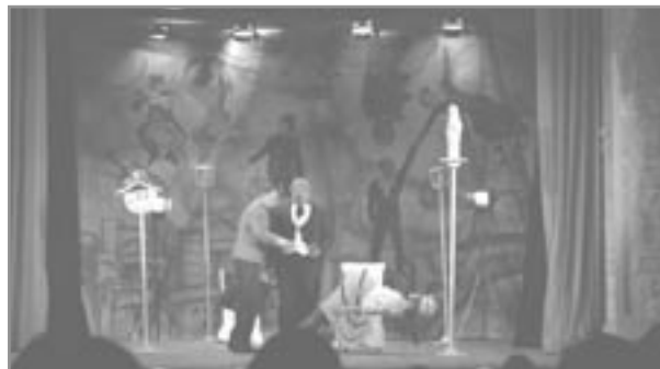
Molière-sýningin frá Samara var mikil skemmtun.