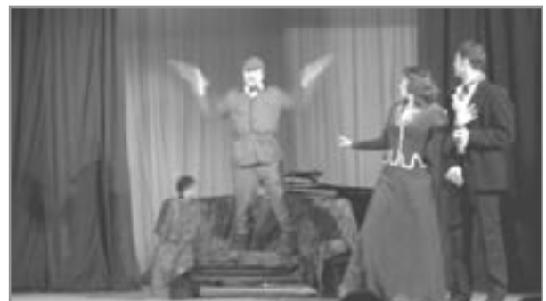
Bibí í Gatchina. „Ég er neikvæður!“. Húbert vampýrubani gerir gleðilega uppgötvun og tekst allur á loft.