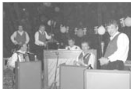
Prek og tár