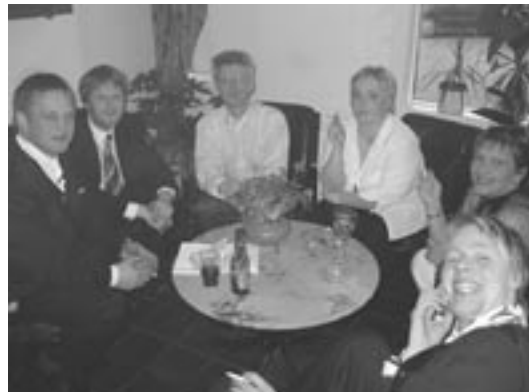
Söguritari fyrir miðju í hópi prúðbúinna aðalfundargesta