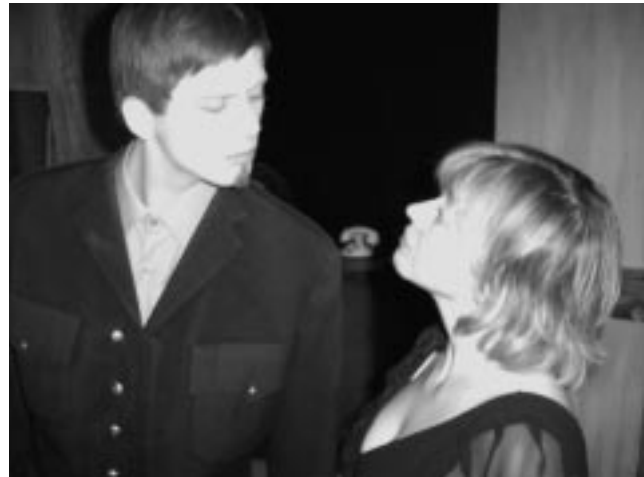
Úr sýningu Leikfélags Kópavogs á Hinn eini sanni.

Haustfundi var fram haldið á sunnudagsmorgun. Þótti fundurinn almennt hafa tekist vel og verið félaginu til sóma.