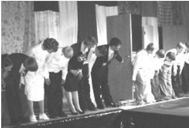
Leikfélag Grunnskólans á Hallormsstað

Verkið er formtílaun þar sem gengið er út frá leikaranum fremur en framvindunni. Það skiptist í 10 smámyndir þar sem umfjöllunarefni eru græðgi, grimmd, girnd og gæfuleysi.