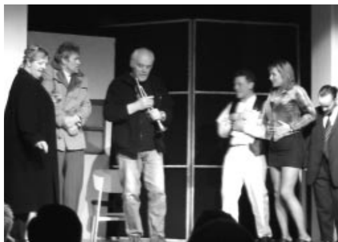
Freyvangsleikhúsið, úr söngleiknum Hold og hár.