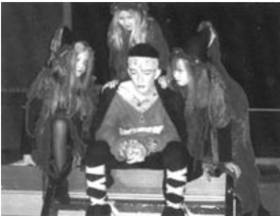
Úr sýningu Umf. Reykdæla Æsir og þursar.

Yngri deildin fór seint í gang. Erfiðlega gekk að finna umsjónarmenn með yngri deild en þegar allt hrökk í gang voru krakkarnir fljótir að koma í kring öskudagsskemmtun. Aðalfundur yngri deildar var í byrjun febrúar þar sem ný stjórn hennar var kosin.