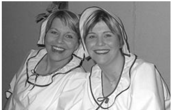
Úr sýningu Leikfélags Húsavíkur á Jörundi.

Í maí 2001 var haldinn fyrsti fundur vegna „Mærudaga“ 2001 en það er úti- og bryggjuhátið sem er orðin nokkuð árviss á Húsavík eina langa helgi í júlí. Leikfélagið sá algerlega um framkvæmdina þetta árið.