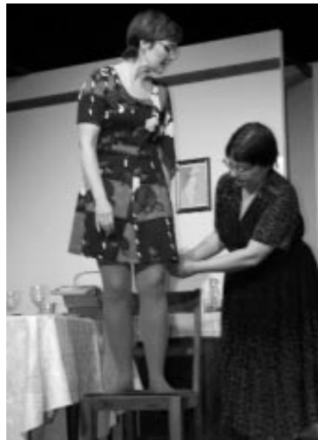
Úr sýningu Leikfélags Sigluffjarðar á Vígsluvottorðinu.

Þegar haustaði mætti Friðrik Þór Friðriksson kvikmyndagerðarmaður til bæjarins ásamt föruneysi til að taka upp nokkur atriði í kvikmyndina „Fálkar“. Leikfélagið tók að sér að útvega 40 stadista. Tók fólk þeirri beiðni félagsins vel og hafði gaman af. Tekjur þær sem félagið taldi sig fá við útvegum stadistanna (hafa reyndar ekki borist enn) voru notaðar til að endurnýja gólfíð í húsnæðinu okkar að Suðurgötu 10.