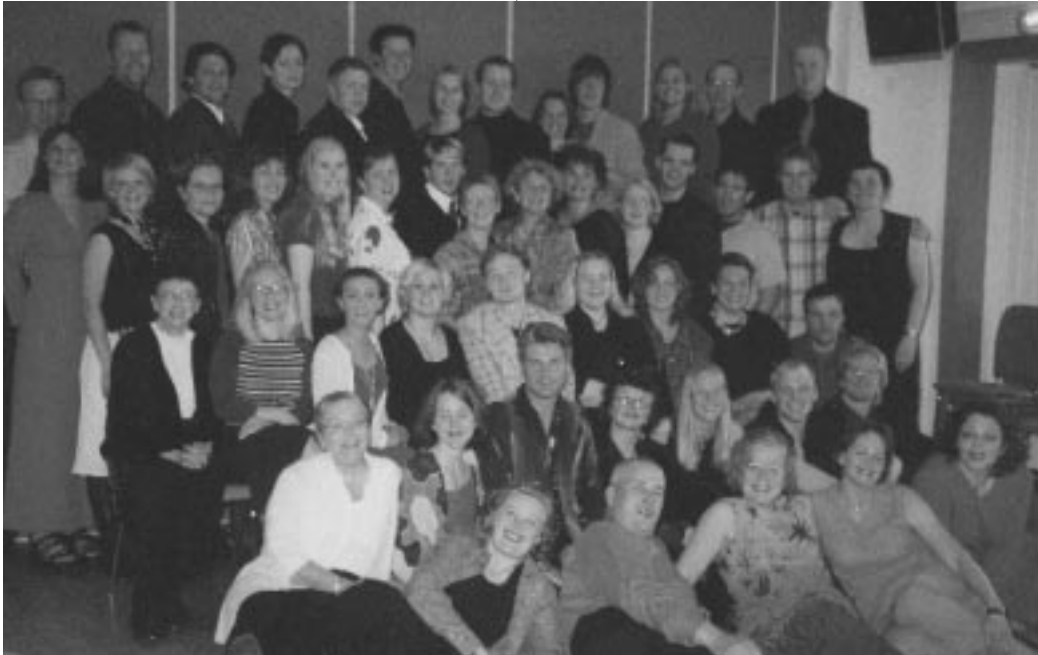
Nemendur, kennarar og hluti skólanefndar að Húsabakka í júní 2001

Skólinn starfaði frá 2. til 10. júní að Húsabakka í Svarfaðardal. Þar var boðið var upp á 3 námskeið. Að auki hélt skólinn eitt námskeið í febrúar 2002.