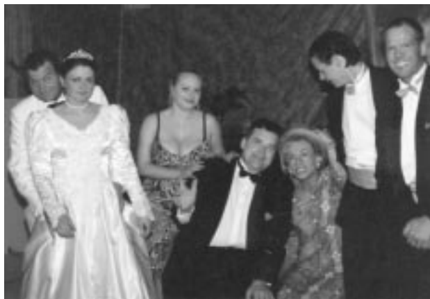
Úr sýningu Leikfélags Mosfellssveitar á Brúðkaupinu

25 ára afmæli leikfélagsins var haldið 9. nóvember á Álafoss fót bezt. Tókst sú samkoma í alla staði mjög vel og var rós í hanppagatið fyrir þá sem að henni stóðu.