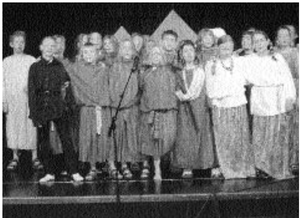
Úr sýningu Leikfélags Reyðarfjarðar á Jósep.