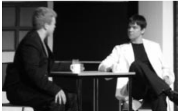
Úr sýningu Leikfélags Fljótsdalshéraðs á einþáttungnum Ást í viðjum efnifræðinnar, sem sýndur var á Hallormsstað.

það mikil vonbrigði. Allt fór þó vel fram og fullyrði ég að allir hafi átt notalega og skemmtilega stund í skóginum. Ég vil þakka öllum sem lögðu hönd á plóg við að gera þessa hátíð að því sem hún var, kærlega fyrir því við megum vera stolt af okkur fyrir hversu vel til tókst.