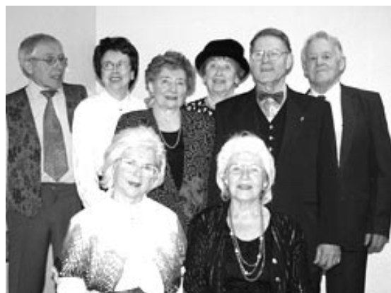
Leikarar í leikritinu Fugl í búri hjá Snúð og snælda.