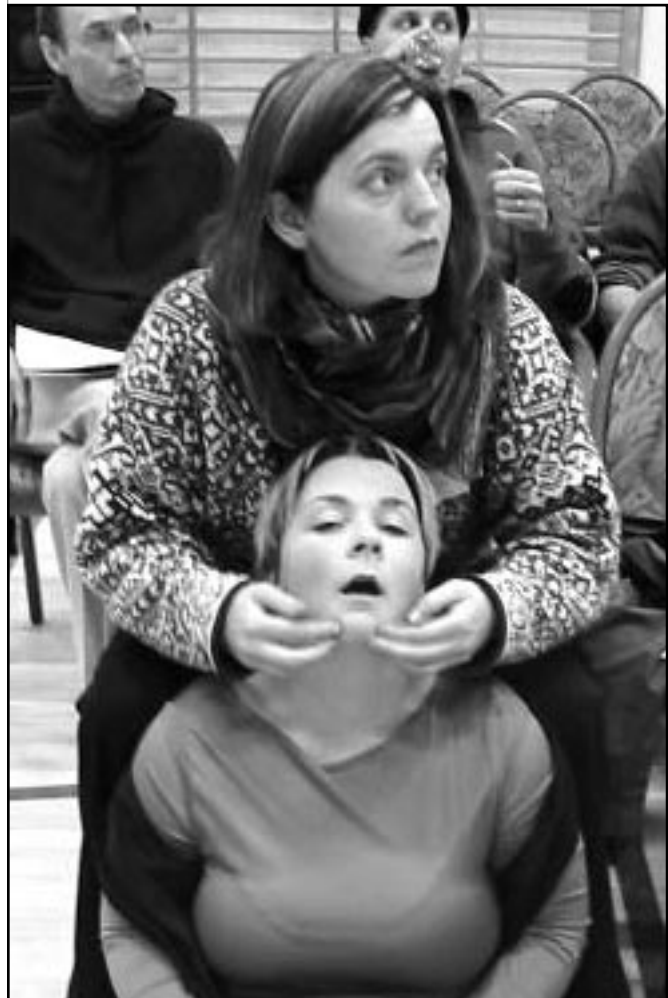
Einbeitingin leynir sér ekki í andlitum þátttakenda á aðalfundi Bandalagsins 2002.