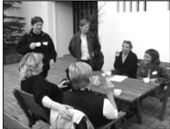
Það hressir Braga kaffið...