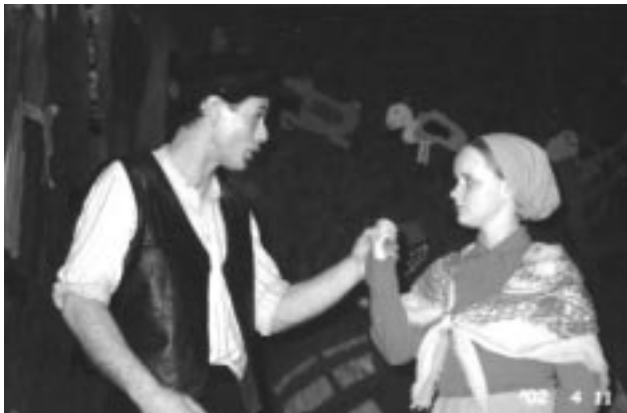
Úr sýningu Umf. Eflingar á Fiðlaranum.