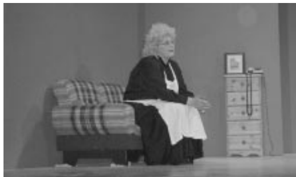
Úr sýningu Leikhópsins Veru á Einn koss enn.