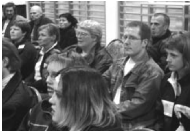
Séð yfir hluta áhorfenda sem voru vel með á nótunum.