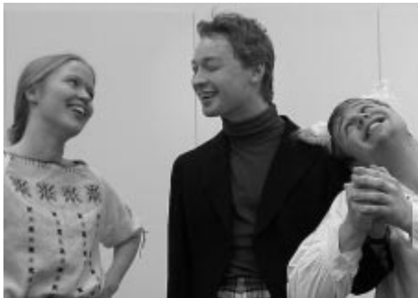
Myndin var tekin á æfingu hjá Hugleik á Kolrössu.