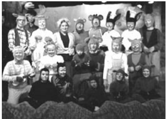
Úr sýningu Leikfélags Hveragerðis á Dýrunum í Hálsaskógi.

Snemma á sýningartímabilinu var farið að ræða um utanför Dýranna og byrjað að safna í ferðasjóð. Allur ágóði af sjoppusölu rann í sjóðinn auk þess sem leikarar tóku þátt í ýmis konar uppákomum út um hvíppinn og hvappinn.