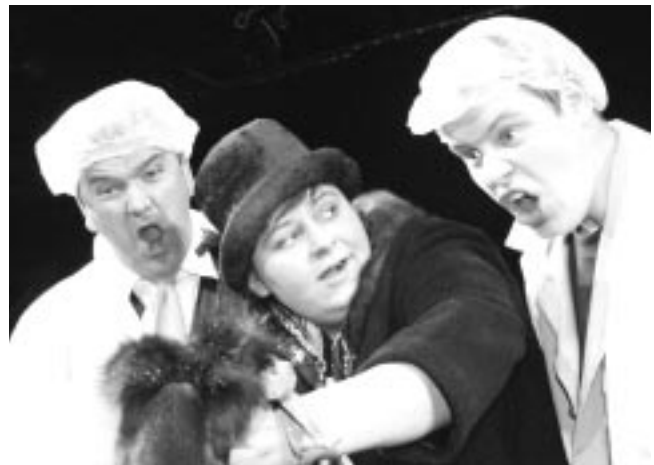
Úr sýningu Leikfélags Selfoss á Suðurlandsvaktinni.

Við létum útbúa fyrir okkur vefsíðu þar sem hægt er að nálgast helstu upplýsingar um okkur og skoða sögu félagsins. Verið er að vinna í henni en hún er samt sem áður tilbúin. Veffangið er: http://www.portal.is/leikfelag . Fyrirtækið Portal útbjó síðuna og mjög auðvelt er að nota hana og setja inná hana upplýsingar þess vegna samdægurs.