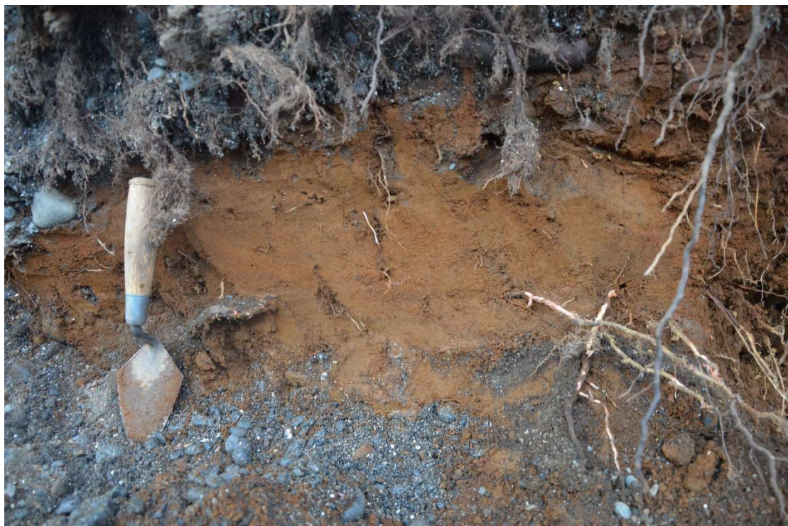
Mynd 4. Sníð við suðurausturborn Arnarbóls.