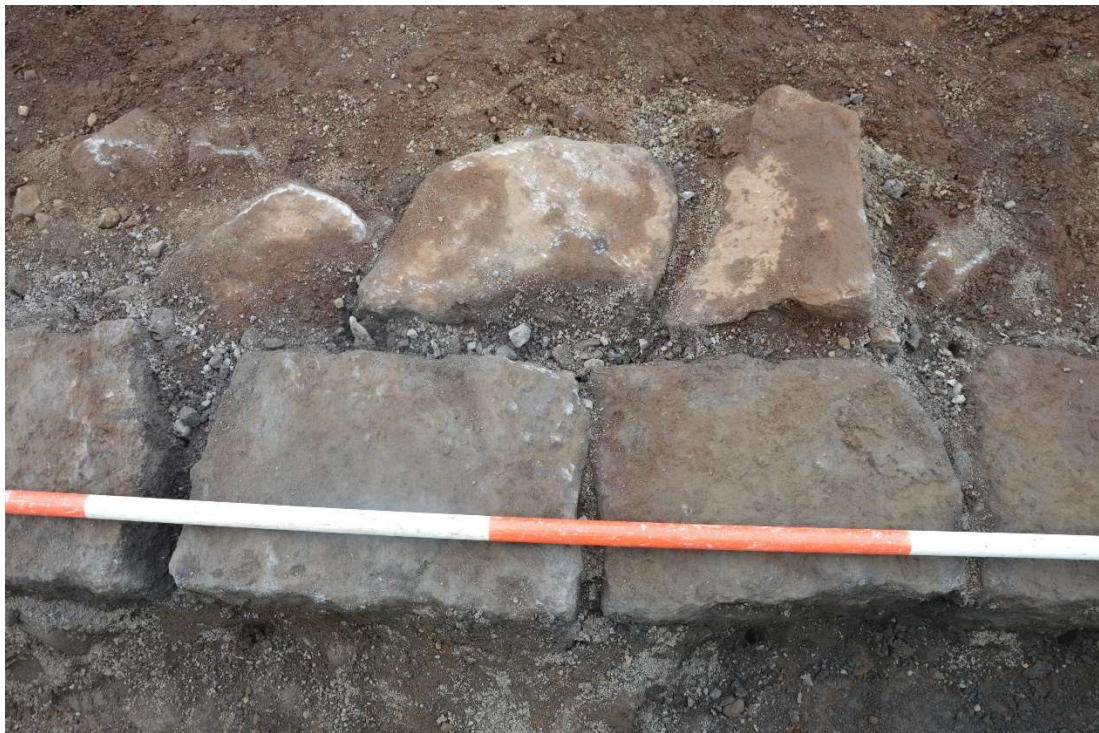
Mynd 3. Nærmynd. Grjóthleðsla og innra byrði af ótillöggnu grjóti, sem liggur í malarblandaðri móösku.