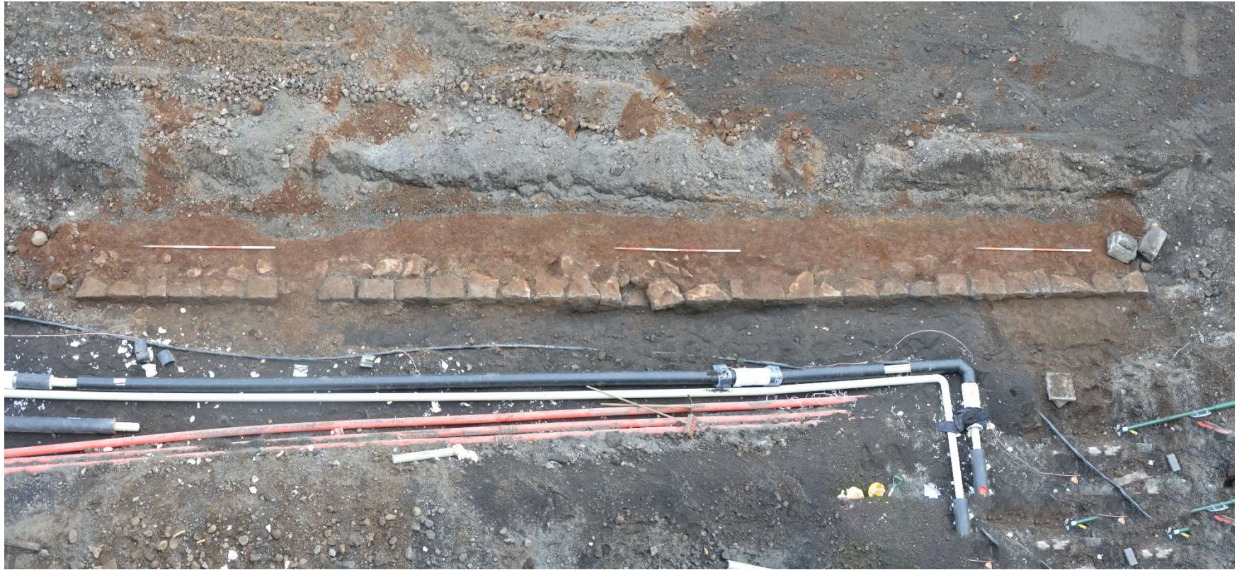
Mynd 2. Samgönguminjar framan við Hverfisgötu 20, horft í norðaustur. (Ljósmynd Hildur Gestsdóttir, samsett mynd).