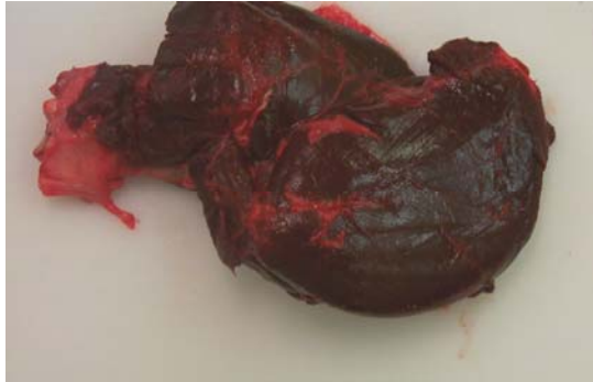
Mynd 3. Handarstykkisvöðvi (framhreifur)

Var skilið eftir þunnt lag af fitu á þeim vöðvum sem valdir voru. Reiknað var út hlutfall skinns, fitu og valdra kjötvöðva. Þeir vöðvar sem valdir voru í geymsluþolsprófun og skymat voru vöðvar úr handarstykki (framhreifur) og hryggvöðvi aftur að mjaðmabeini (Mynd 3 og 4).