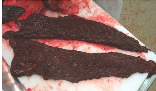
Mynd 4. Hryggvöðvi

Talið er að þessir vöðvar séu mýksta kjötið, og auðvelt er að skera þá af skrokknum. Kjötinu var pakkað í lofttæmdar umbúðir, látið í svartan plastpoka og í frost við -21 til -22^{\circ}\text{C} .