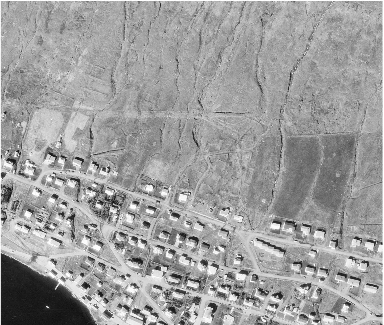
Mynd 3. Loftmynd frá 1974. Landmælingar Íslands.

Í tölvupósti frá MÍ dags. 08.02.19 segir að Fjarðabyggð skuli, ef ekki reynist mögulegt að tryggja öryggi minja, sækja um leyfi til að raska þeim. Í tilfalli grjótgarðs (nr. 64) virðist sem hann hafi ekki verið til staðar á loftmynd (mynd 3) sem tekin var árið 1974, sem bendir til þess að hann sé ekki fornleif í skilningi laga nr. 80/2012.