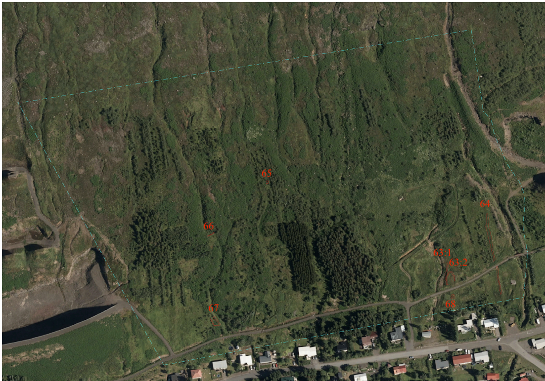
Mynd 2. Loftmynd frá Fjarðabyggð af framkvæmdasvæðinu fyrir neðan Urðarbotna þar sem fornleifarnar hafa verið merktar inn. Svæðið afmarkað með blárrí línu.

enginn, hvorki landeigandi, framkvæmdaaðili né nokkur annar spilla, granda né úr stað færa, nema með leyfi Minjastofnunar Íslands (21. gr.). Því eru allar þær fornleifar á könnunarsvæðinu sem og annars staðar og eldri eru en 100 ára, friðaðar skv. lögnum. Friðlýstum fornleifum fylgir 100 m friðhelgt svæði út frá ystu sýnilegu mörkum þeirra (22. gr). Um friðaðar fornleifar er 15 m friðhelgað svæði umleikis samkvæmt sömu grein. Sú hefð hefur þó komist á að fara ekki of nærri fornleifum og taka tillit til eðlis þeirra og þarfa. Engar friðlýstar fornleifar eru í nágrenni Urðarbotna en nokkrar fornleifar fundust á svæðinu. Minjastofnun Íslands mun ákvarða um hvort varðveita eigi skráðar fornminjar á svæðinu eða rannsaka þær með fornleifauppgreftri.