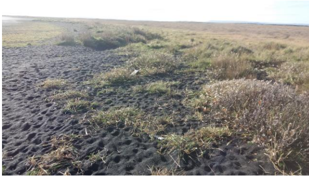
Mynd 1: Lagarfljót strand, til suðurs.