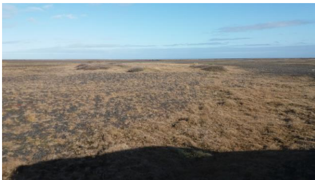
Mynd 7: Eyja á eyrum undan Kríubakka sem hefur sum undanfarin ár fengið áburð.