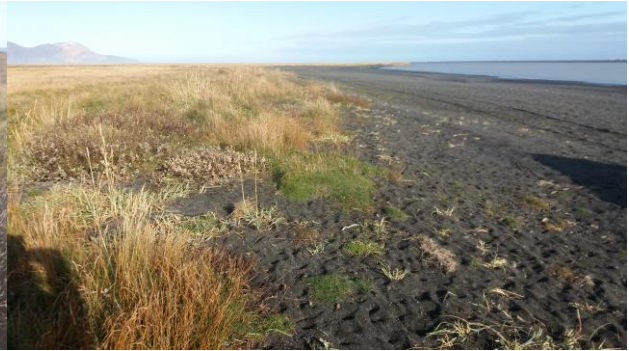
Mynd 2: Lagarfljót strand, til norðs.