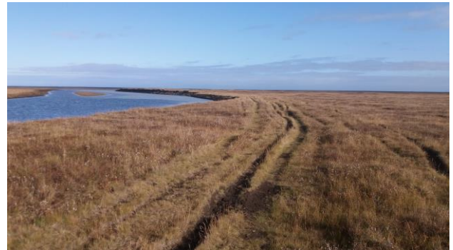
Mynd 6: Með Jökulsá.