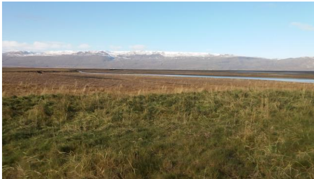
Mynd 5: Norðan við Hvalbeinsrandarsand er gróður sterkari.