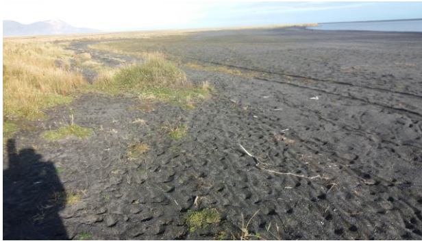
Mynd 3: Sandkriki sunnan við Hvalbeinsrandarsand.