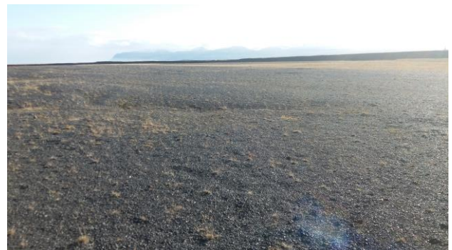
Mynd 8: Eyri undan Kríubakka. Áborið í fyrra hægra megin.