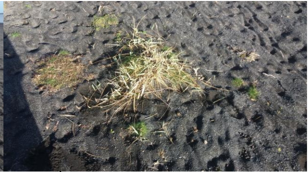
Mynd 4: Á sandkrika.