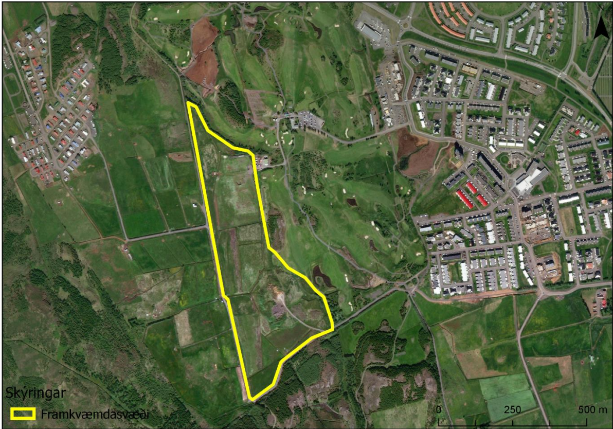
MYND 3. Framkvæmdasvæði (gulur rammi) sem staðsett er vestan við núverandi golfvöll að Jaðri.