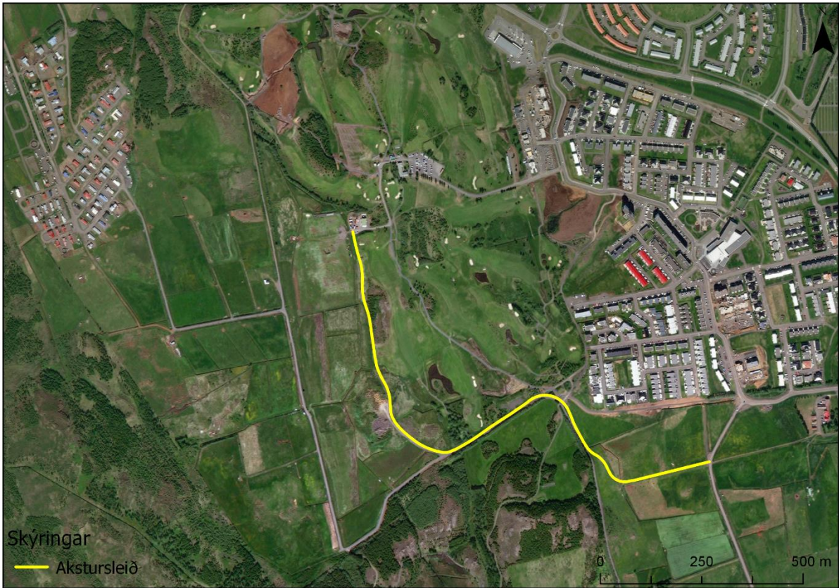
MYND 5. Akstursleið að framkvæmdarsvæðinu (gul lína).

vinnuvéla en notkun þeirra verður staðbundin innan framkvæmdasvæðisins. Annar akstur felst í akstri starfsmanna framkvæmdarinnar og olíubíla vegna áfyllingar á tæki.