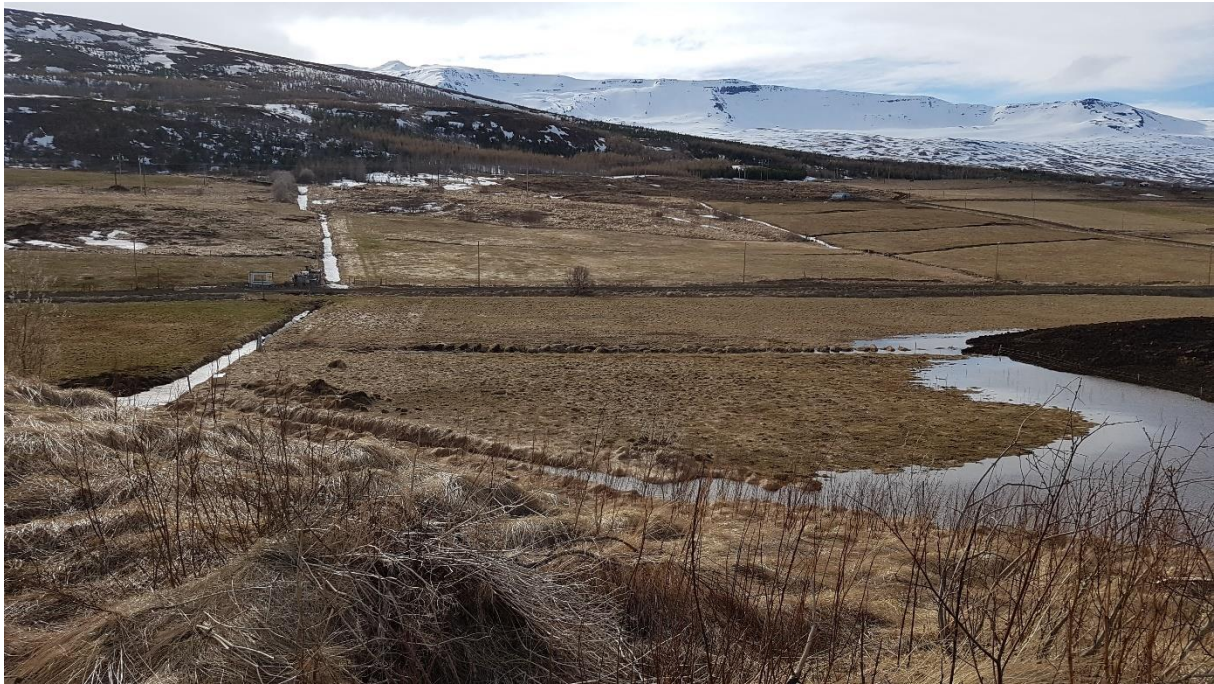
MYND 2. Horft til vesturs yfir hluta framkvæmdarsvæðisins.

[7]. Tún sem golfklúbburinn hefur ekki nýtt hafa verið leigð út til hestamanna. Nyrst liggur svæði sem var notað sem æfingaraðstaða fyrir golfiðkun, allt þar til að æfingahús var byggt.