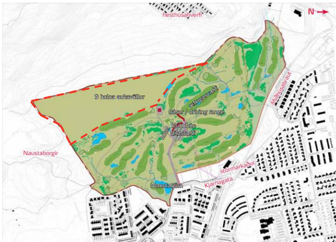
MYND 4. Yfirlitsmynd af skipulagssvæði Jaðarsvallar úr deiliskipulagi [7]. Framkvæmdasvæðið er tilgreint með rauðum brotalínunum.

Stækkun Jaðarsvallar er í samræmi við gildandi deiliskipulag fyrir Jaðarsvöll sem tók gildi með auglýsingu nr. 144/2011 í B deild Stjórnartíðinda þann 17. febrúar 2011 [7]. Deiliskipulagið nær yfir stækkun Jaðarsvallar en einnig um breytingar á núverandi velli og aðstöðu auk almennra endurbóta á svæðinu. Í deiliskipulaginu er fyrirhugað stækkunarsvæði golfvallarins skilgreint sem golfvallarsvæði (sjá mynd 4). Deiliskipulagið gerir ekki grein fyrir haugsetningu eða landmótun. Unnið verður að breytingu deiliskipulagsins samhliða mati á umhverfisáhrifum. Sjá má skipulagsupprátt gildandi deiliskipulags Jaðarsvallar í viðauka A.