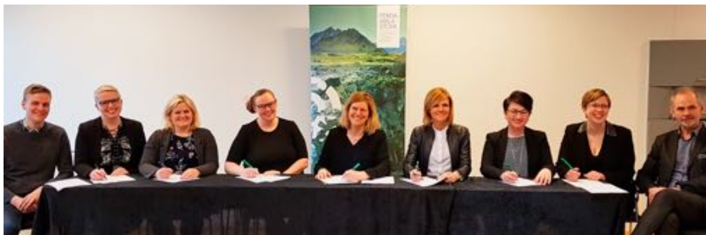
Frá undirskrift samninga Ferðamálastofu við markaðsstofur vegna Áfangastaðaáætlana DMP

Fjöldi fólks hefur komið að starfi Stjórnstöðvar ferðamála. Hér eru nokkrar myndir frá fundum, ráðstefnum og vinnustofum.