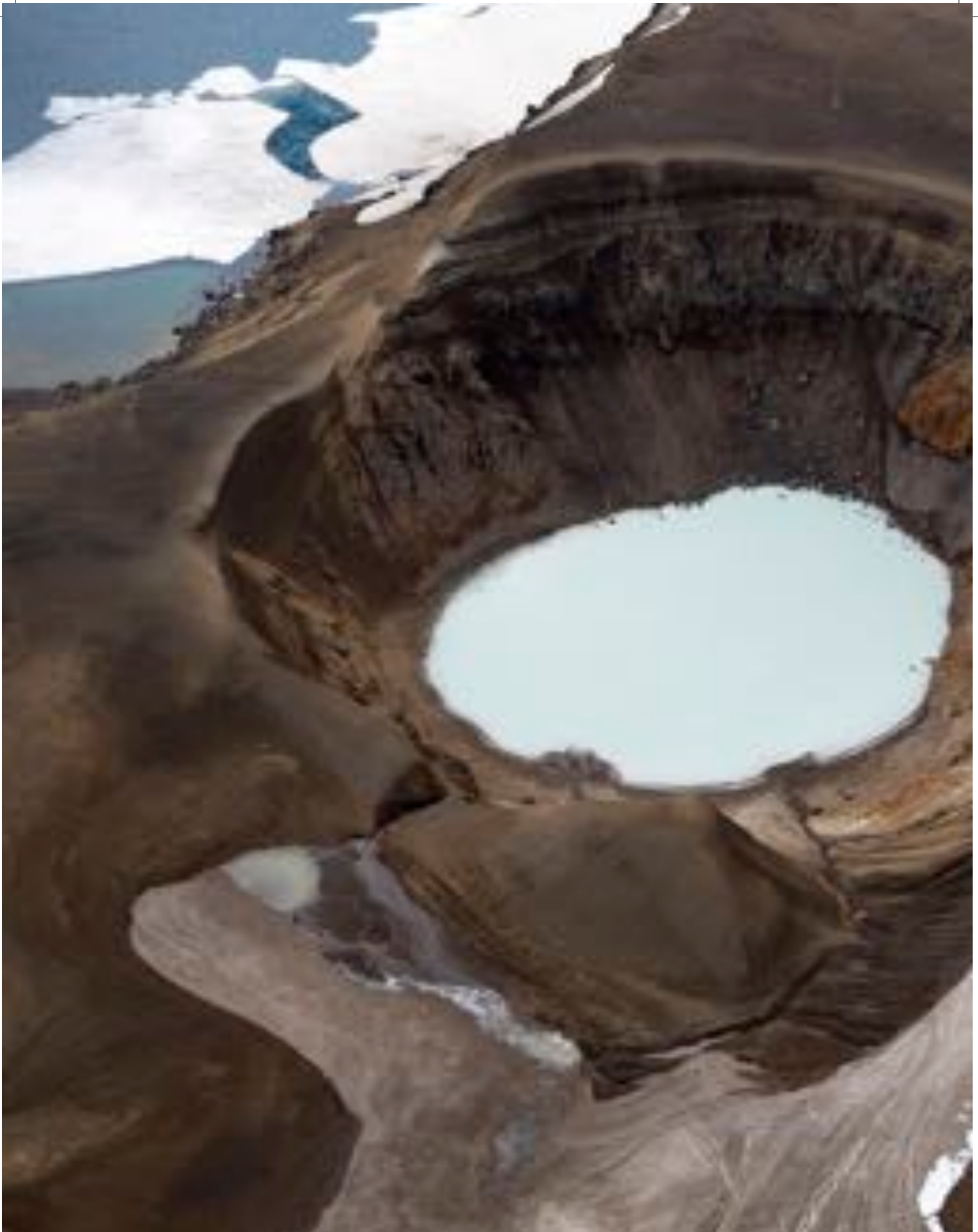
Víti í Öskju í Dyngjufjöllum.