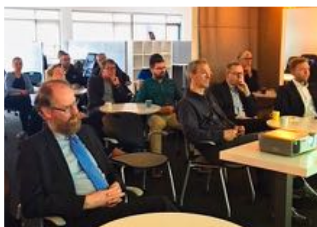
Þátttakendur á vinnustofum.