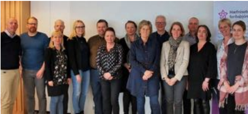
Stýri- og faghópur Hæfniseturs ferðapjónustunnar ásamt starfsfólki.