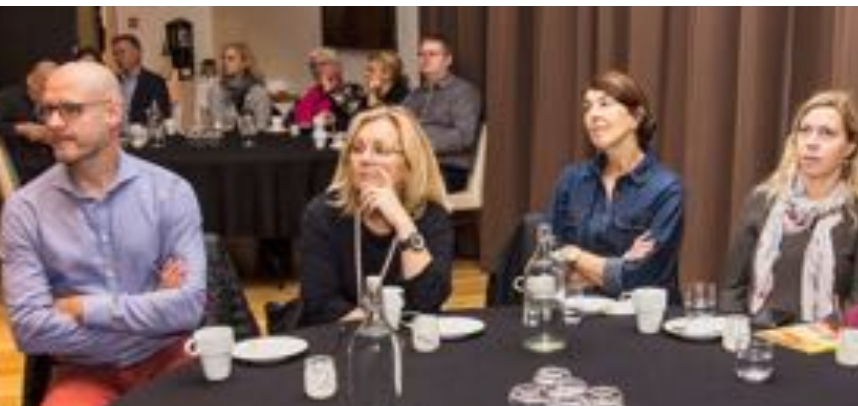
Fundargestir við opnun Mælaborðs ferðapjónustunnar.