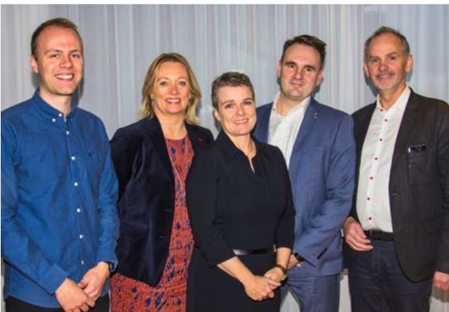
Starfsfólk Stjórnstöðvar ferðamála ásamt ráðgjafa Deloitte.