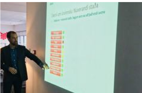
Frá fundi með sérfræðingum Eflu.