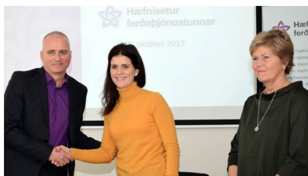
Frá undirskrift samnings um fjármögnun verkefna Hæfniseturs ferðapjónustunnar til ársins 2020.