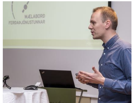
Kynning á Mælaborði ferðapjónustunnar.