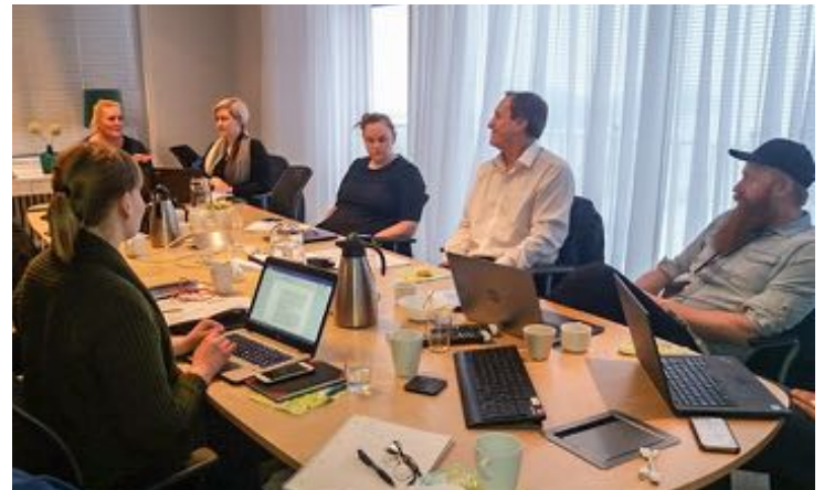
Vinnustofa verkefnastjóra Áfangastaðaáætlana DMP.