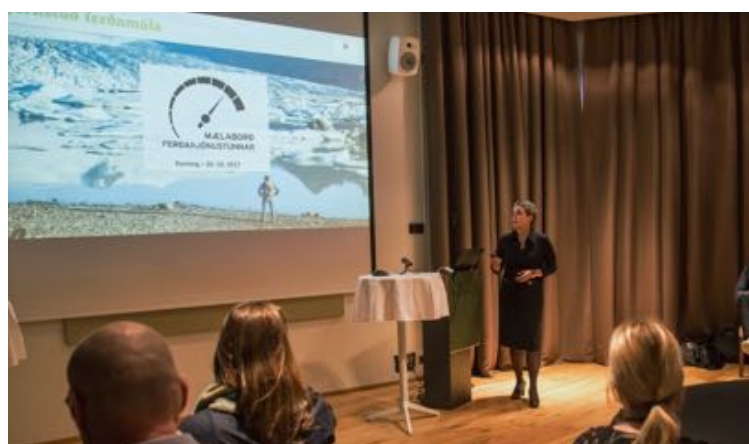
Opnun Mælaborðs ferðapjónustunnar.