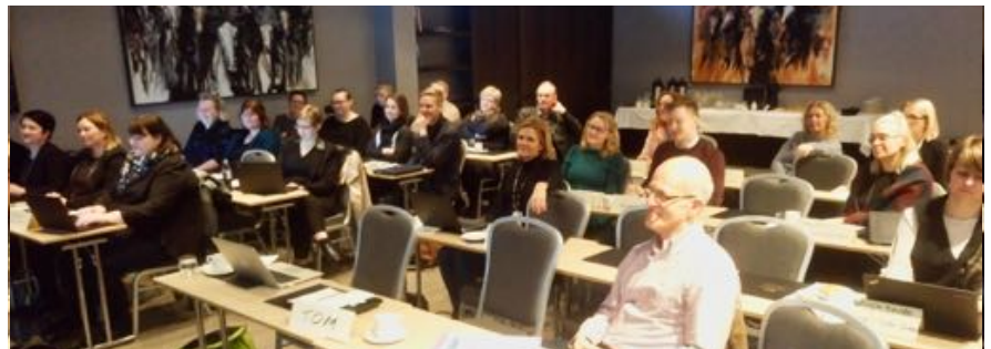
Frá vinnustofu Áfangastaðaáætlana DMP.