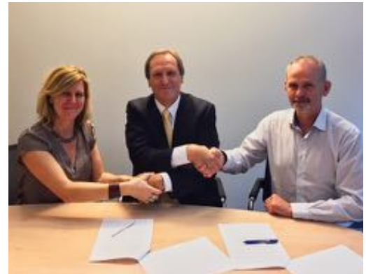
Frá undirritun samnings um ráðgjöf vegna Áfangastaðaáætlana DMP.