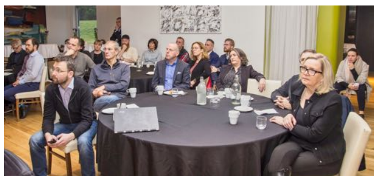
Nokkrir samstarfsaðilar Stjórnstöðvar ferðamála.