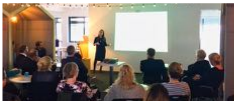
Frá kynningafundi um þörmörk og sjálfbærniáætlana.