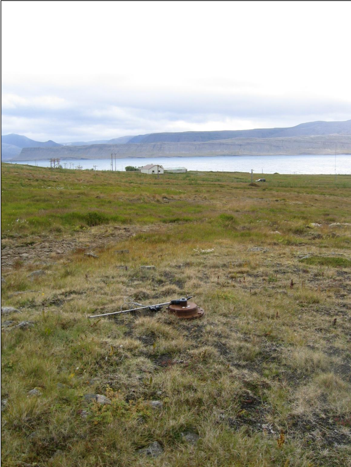
6. mynd. Borhola OD-02 . Otradalsbærinn í baksýn.

Borhola OD-02 er um 400 metra suðvestur af bænum og er þar á lágu melholti. Holan er lokuð og í þökkalegu ástandi (6. mynd).