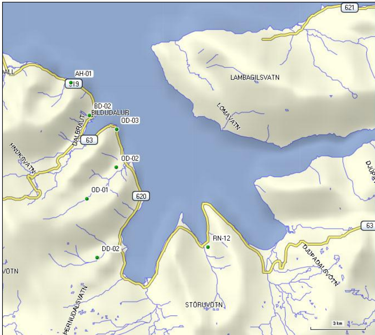
1. mynd. Staðsetning borholna í Suðurfjarðarhreppi og á Bıldudal.