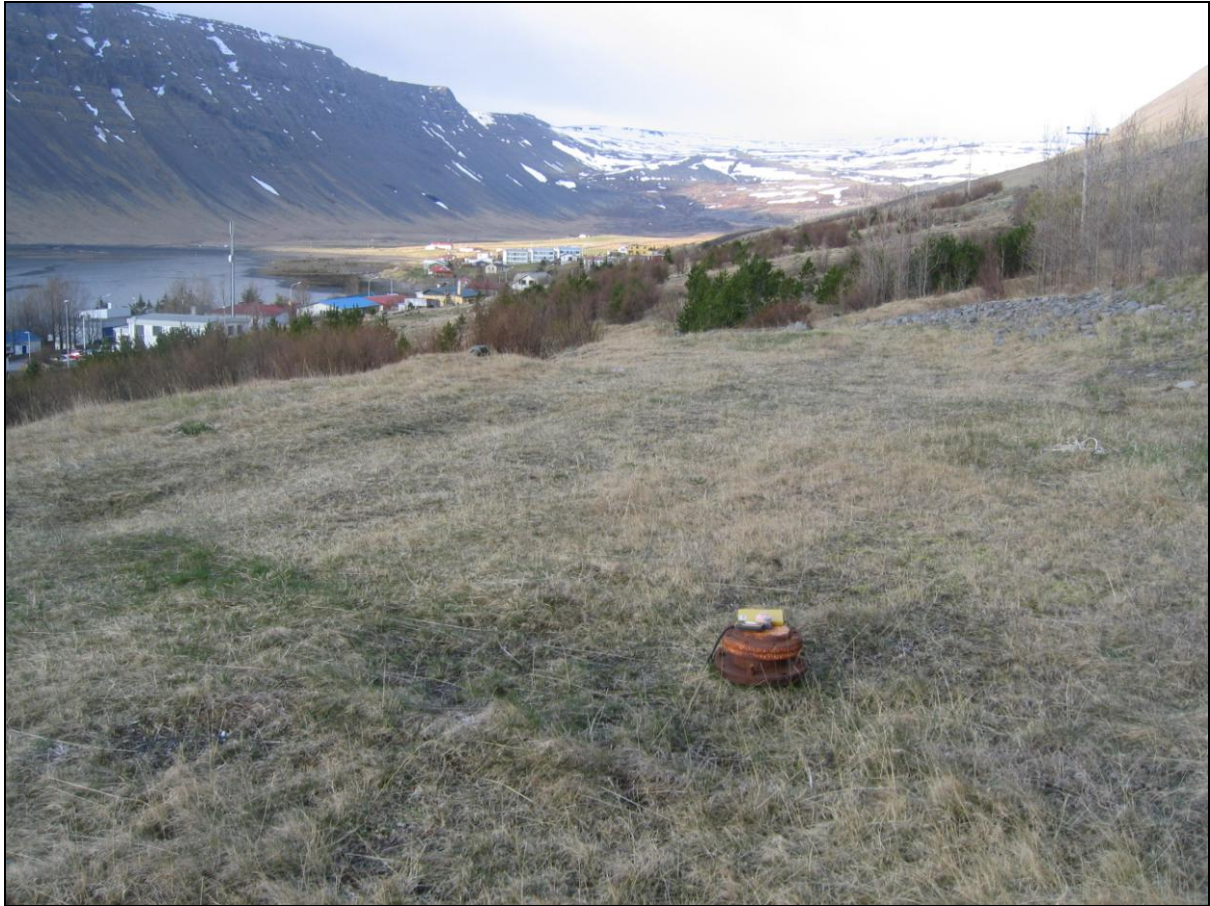
4. mynd. Borhola BD-02.

Borhola BD-02 er ofarlega í skrudgarði sem er innan við Búðargil í utanverðu þorpinu á Bíldudal. Holan er lokuð og í þokkalegu ástandi (4. mynd).