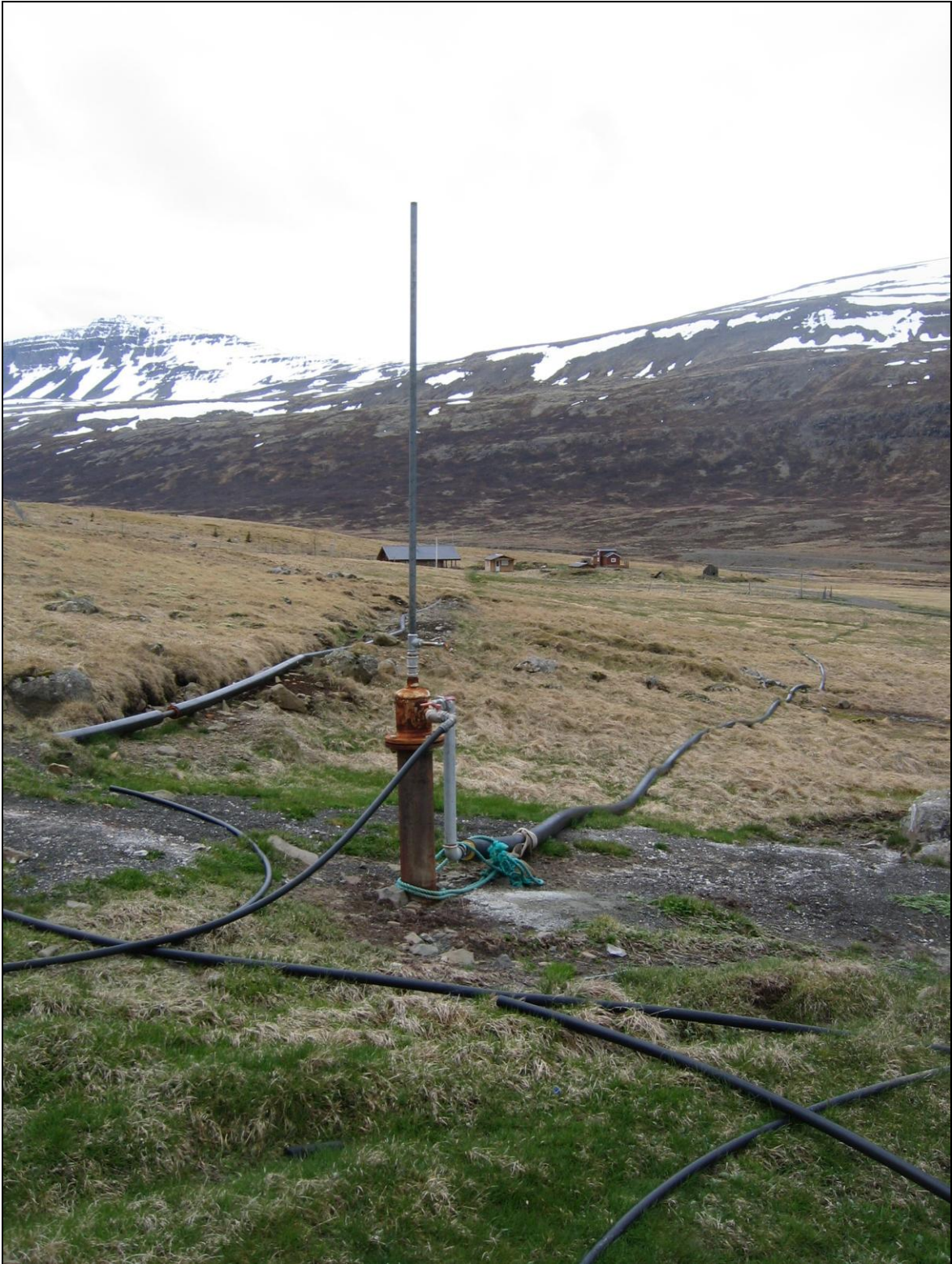
11. mynd. Borhola RN-12.