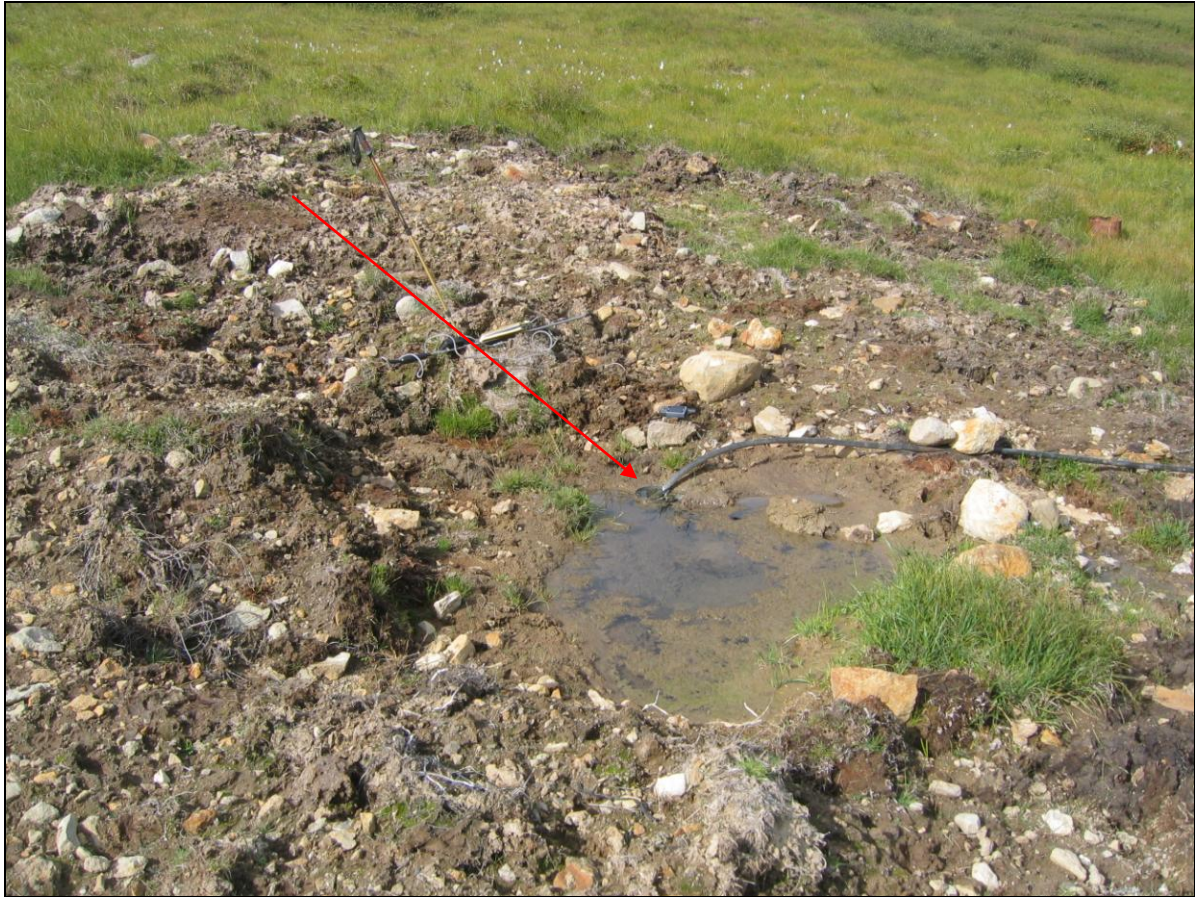
8. mynd. Borhola DD-02.

Borhola DD-02 er um 50 metrum vestar og ofar í Leitismýri. Hún sést mjög illa. Holan er opin og í slæmu ásigkomulagi (8. mynd).