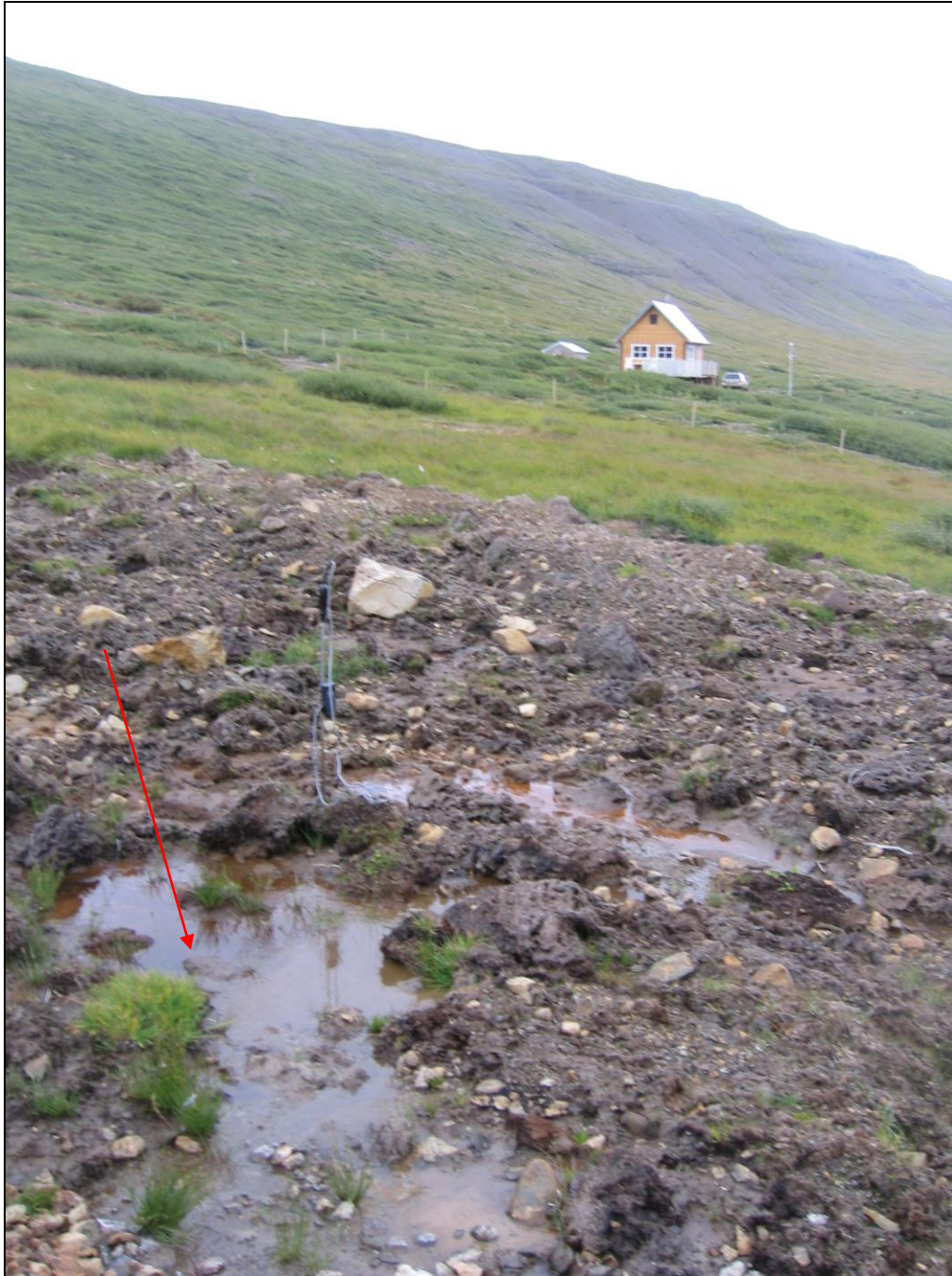
7. mynd. Borhola DD-01 var þar sem örin vísar.

Borhola DD-01 er í svonefndri Leitismýri sem er milli sumarbústaða sem eru nokkru fyrir innan sjálf bæjarhúsin. Akvegur er að mýrinni og fram dalinn. Holan sést ekki lengur (7. mynd).