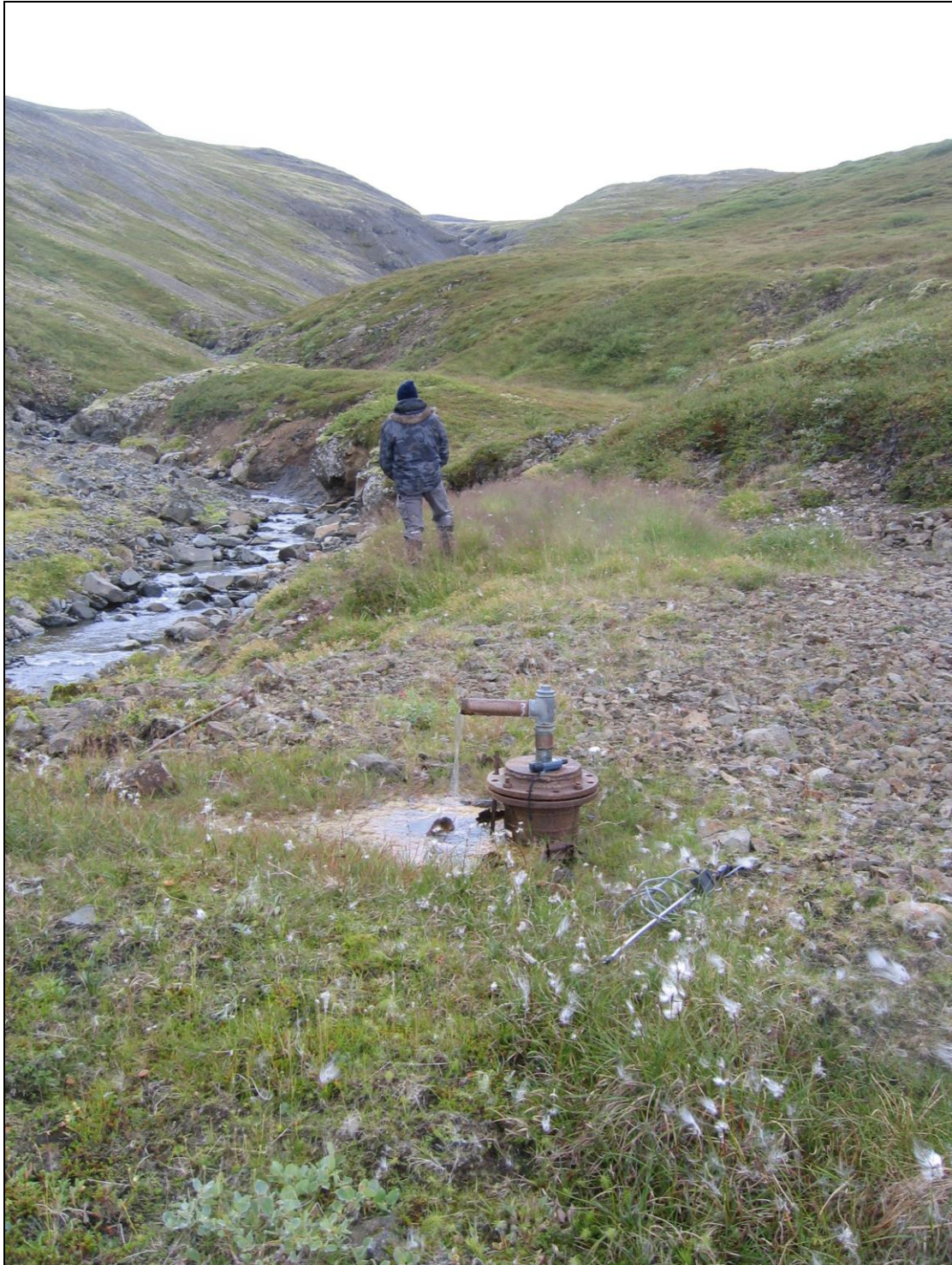
5. mynd. Borhola OD-01.

Borhola OD-01 er 2,8 km inn með Otradalsá. Hún er á norðurbakka árinna. Holan er lokuð en þó streymir úr henni gegnum mjótt rör. Holan er í góðu ástandi (5. mynd).