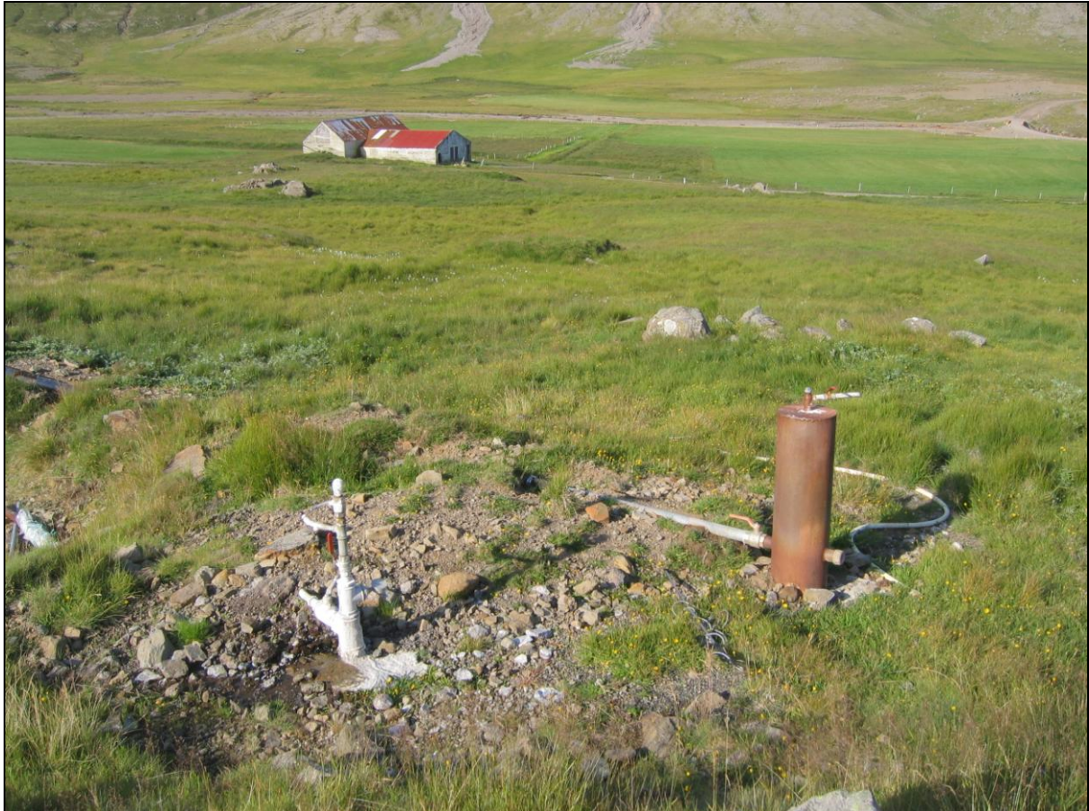
9. mynd. Borhola RN-01 er til hægri en ekki vitað hver er til vinstri.

Borhola RN-01 er um 90 metra innar en sundlaugin. Hún er upp í hallinum milli gamla íbúðarhússins og sumarhúsa sem eru innar. Holan er í þokkalegu ástandi og vatn frá henni er leitt í sumarhúsið. Rétt hjá henni er önnur sem ekki er vitað um númerið á (9. mynd).