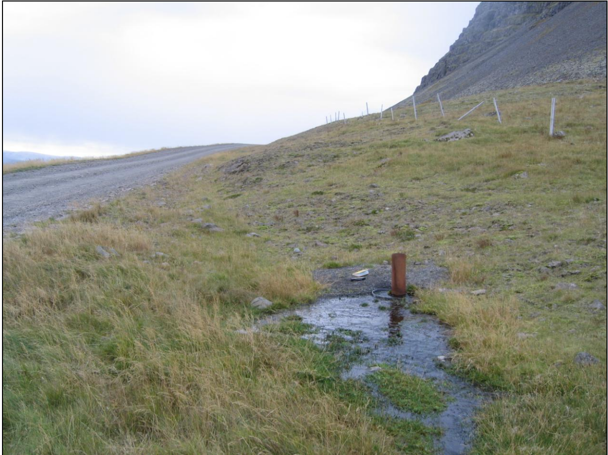
3. mynd. Borhola AH-01 í Auða-Hrísdal.

Borhola AD-01 í Auða-Hrísdal er um 300 metra innan við ána sem rennur eftir dalnum. Hún er við vegslóða upp að gamla bæjarstæðinu. Þar er plan og í því er holan. Hún er opin og streymir úr henni kalt vatn. Holan er að öðru leyti í sæmilegu ástandi (3. mynd).