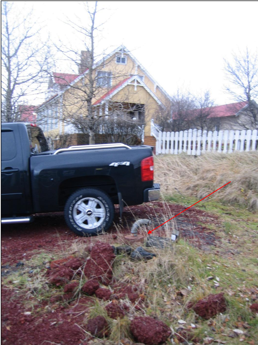
2. mynd. Borhola SH-01 á Stórólshvoli.

Borhola SH-01 er skammt austan við gamla skólann á Hvolsvelli og mitt á milli hans og lítills móttökuhúss sem þar er. Þetta svæði er upphaflega úr landi Stórólshvols en er nú í landi Hvolsvallar. Holan er nyrst á litlu bílastæði og er rauðamölsflykkjum hlaðið að henni. Hún virðist í þokkalegu ástandi. Var notuð um skeið til mælinga fyrir Veðurstofu Íslands. (2. mynd)