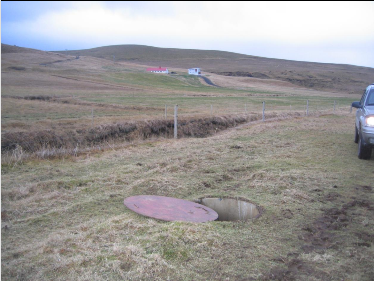
4. mynd. Borhola PH-01 á Þórunúpi. Íbúðarhúsið í baksýn.