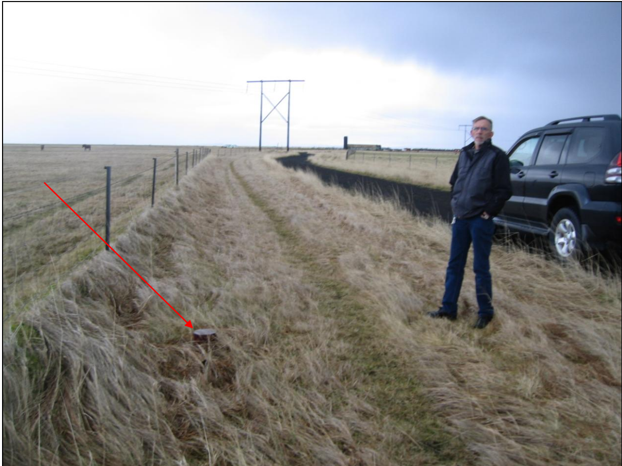
5. mynd. Borhola MK-01 í Miðkrika.

Borhola MK-01 er um 300 metra vestur af Miðkrikabænum og er þar sunnan vegslóða og við túngirðingu. Holan er í góðu standi og er notuð til að fylgjast með grunnvatnsmengun. (5. mynd)