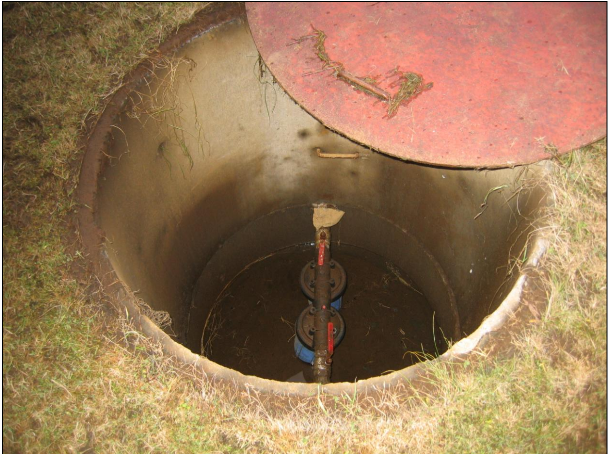
3. mynd. Borhola PHK-01 í Þórunúpi.

Borhola PH-01 er um 370 metra norðvestur af bæjahúsunum og beint norður af útihúsum sem þar eru. Holan er undir lágri hlíð og er í gömlu túni. Utan um hana er brunnur og járnhlemmur yfir. Holan notuð fyrir neysluvatn. (3. og 4. mynd)