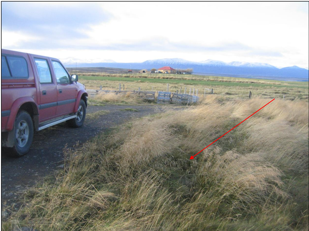
1. mynd. Volgran í Kýrholti var þar sem örin bendir á. Kýrholtsbærinn í baksýn.

Lítill volgra var norðvestan í melholti og vottaði þar fyrir hvítum útfellingum. Hiti mældist þá 8,8°C. Volgran hvarf þegar borað var í Kýrholti. (1. mynd)