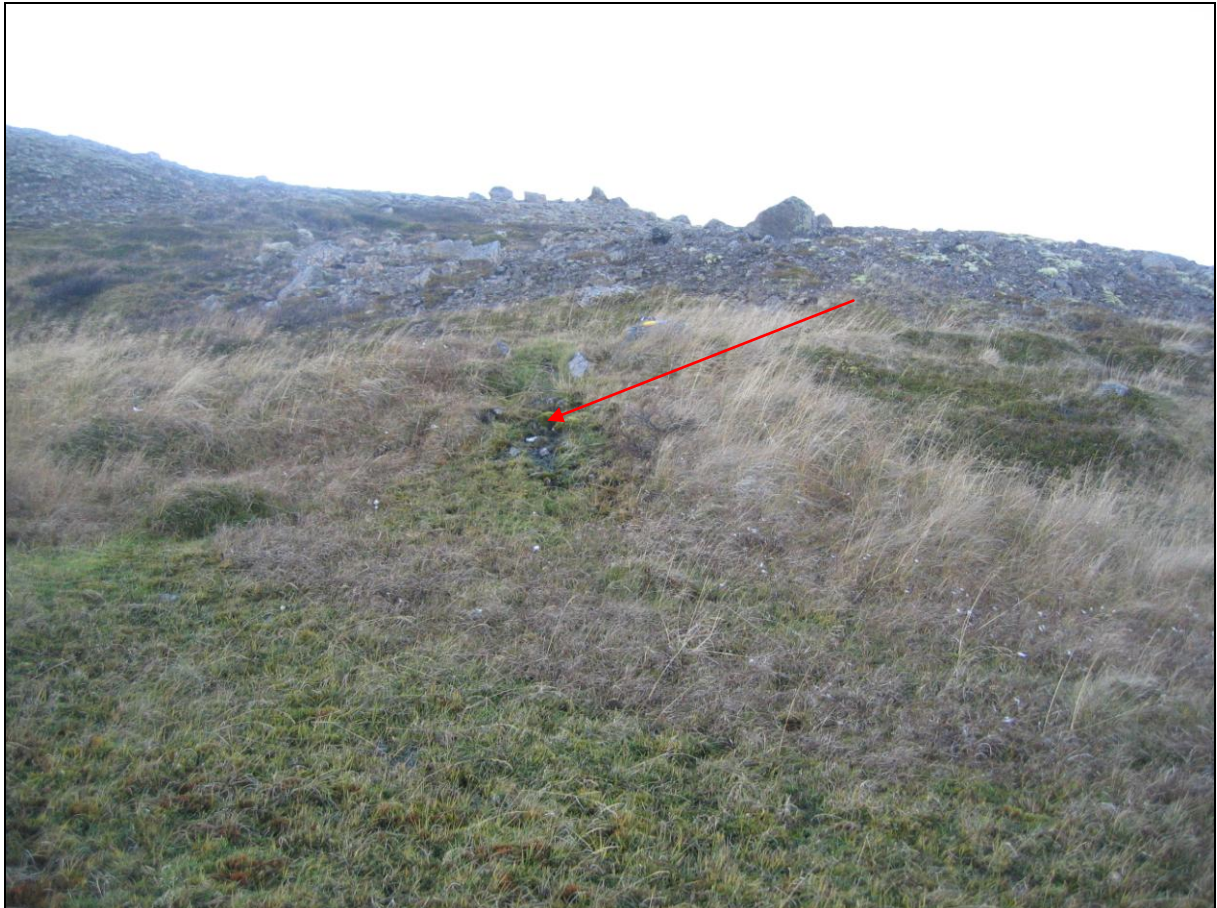
2. mynd. Jarðhitastaður VI-01 í Viðvík.

Jarðhitinn í Viðvíkurlandi er tæplega 2 km suðvestur af bænum. Þar er velgja í lægðum milli urðarbingja. Staður VI-01 er innanvert í urðarhól og seytlar þar upp á svæði sem er um 40 cm í þvermál. Hæstur hiti mældist 10,2°C og hvítar útfellingar eru á steinum. Rennsli metið 0,1 l/s. (2. mynd)