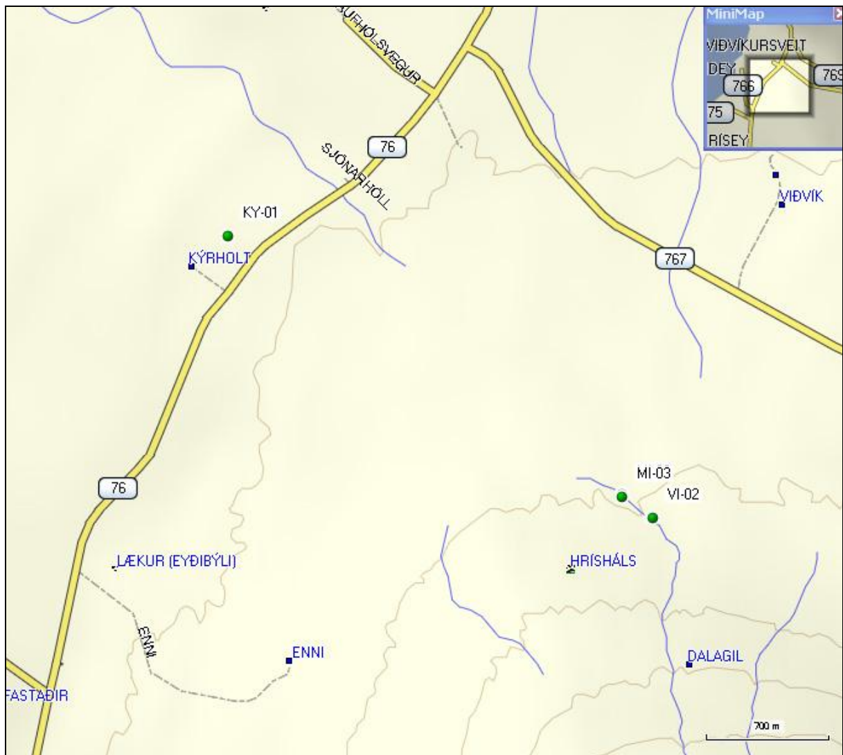
7. mynd. Jarðhiti í Viðvíkursveit í Skagafirði.