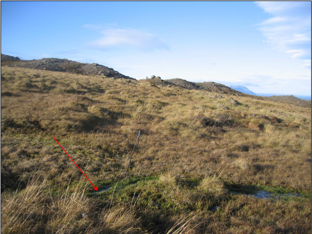
4. mynd. Jarðhitastaður MI-01 á Miklahóli.

Liðlega 200 metrum norðvestar en jarðhitinn í Viðvíkurlandi eru nokkrar volgrur í landi Miklahóls. Volgrurnar eru allar í sama draginu sem er velgróin hallamýri. Staður MI-01 er nyrstur þessara staða. Þar er dý í mýrinni við læk. Hiti mældist 9,6°C en rennsli sést ekki. (4. mynd)