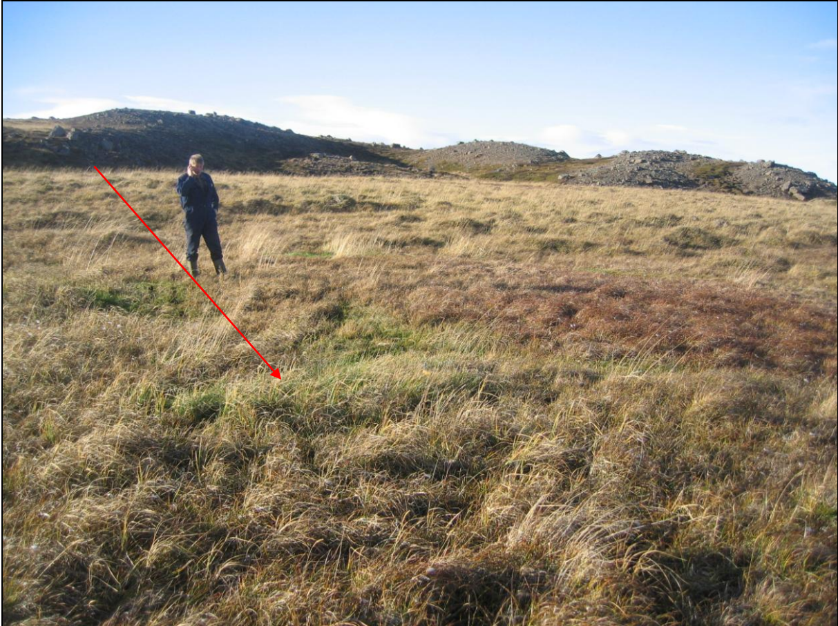
5. mynd. Jarðhitastaður MI-02 á Miklahóli.

Um 6-8 metrum sunnar og ofar en staður MI-01 er dý sem er um tveir metrar í þvermál. Dýið dúar allt. Hiti mældist 10,5°C. Rennsli sést lítið á yfirborði. (5. mynd)