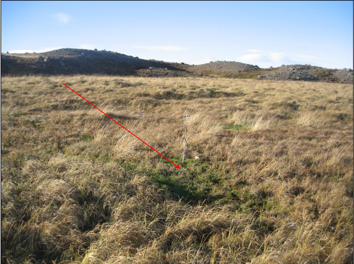
6. mynd. Jarðhitastaður MI-03 á Miklahóli.

Um 15 metrum sunnar og ofar en staður MI-02 er dý sem er um tveir metrar í þvermál. Hiti mældist 10,0°C en rennsli sést ekki á yfirborði. (6. mynd)