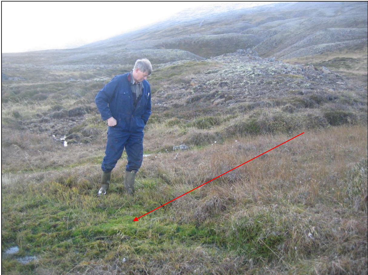
3. mynd. Jarðhitastaður VI-02 í Viðvík.

Um 5-8 metrum austar en staður VI-02 er stórt dý og í því er borhola SK-07. Dýið er um 2-3 metrar í þvermál og hæstur hiti mældist 10,4°C. Mikill vatnsagi er í kringum dýið. (3. mynd)