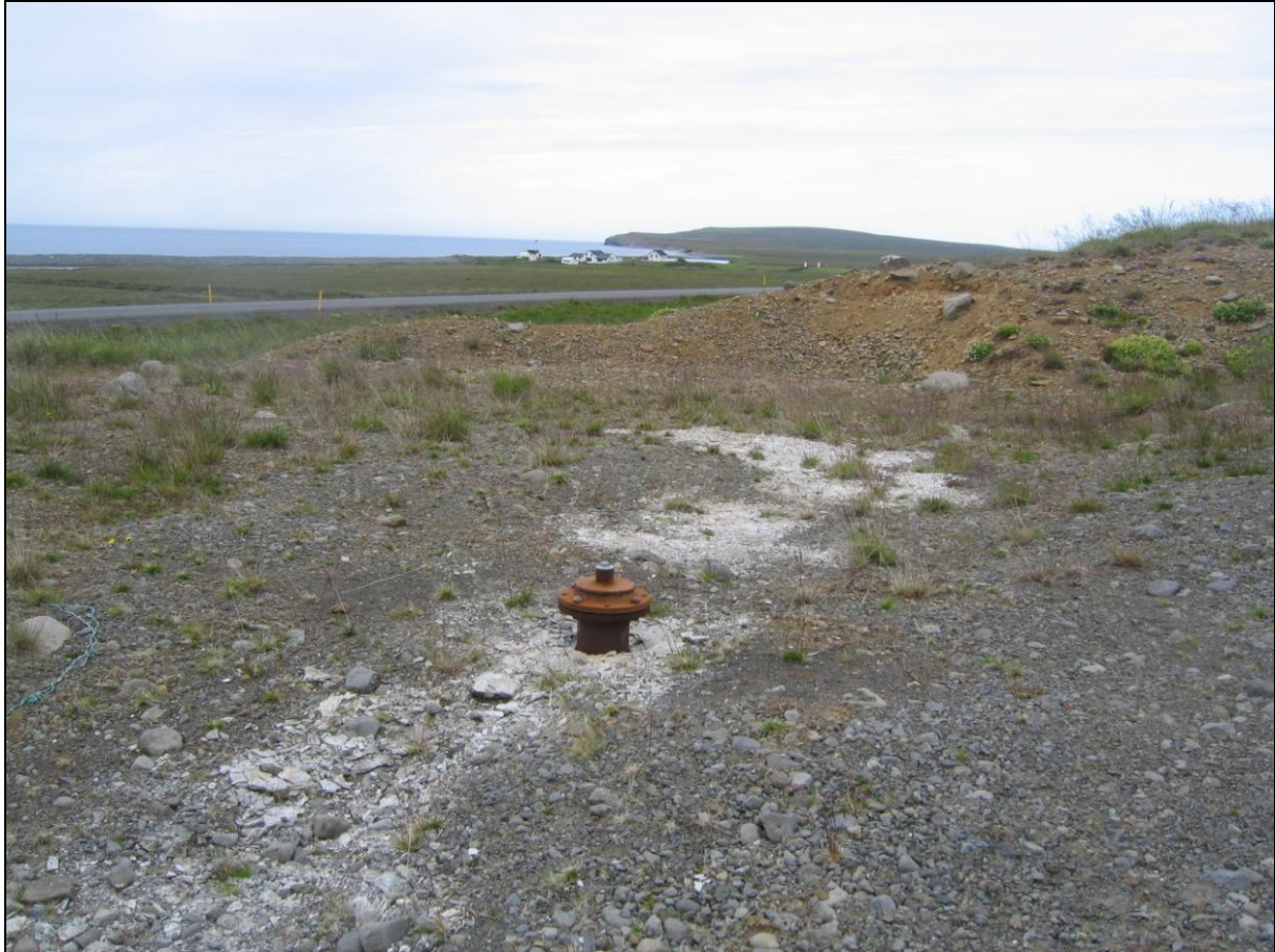
2. mynd. Borhola LK-02 í Lónkoti í Sléttuhlíð.

Borhola LK-02 er um 600 metra sunnan við bæinn. Þar er malarnáma ofan við þjóðveginn og er holan nyrst í námunni. Holan er í góðu ásigkomulagi. (2. mynd)