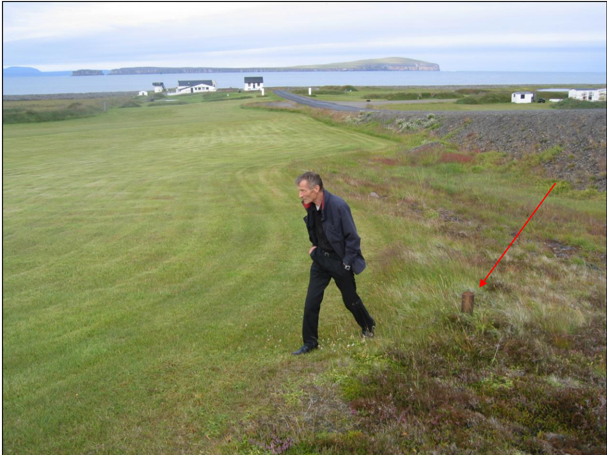
1. mynd. Borhola LK-01 í Lónkoti í Sléttuhlíð. Lónkotsbærinn í baksýn.

Borhola LK-01 í Lónkoti er sunnan við heimreiðina að staðnum. Hún er um 60 metra frá sjálfum þjóðveginum en aðeins 15 metra frá heimreiðinni. Hún er í túnjaðri. Holan er opin og frágangur slæmur. Samkvæmt eiganda var holan líklega boruð árið 1988. Hún er 24 metra djúp og fóðruð með 4" röri í botn. (1. mynd)