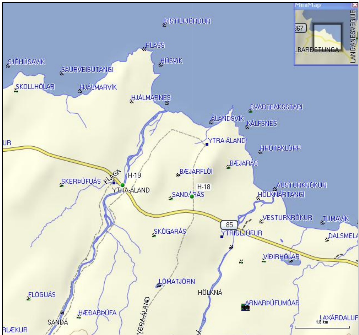
10. mynd. Staðsetning borholna H-18 og H-19 á Ytra-Álandi og Flögu í Svalbarðshreppi.