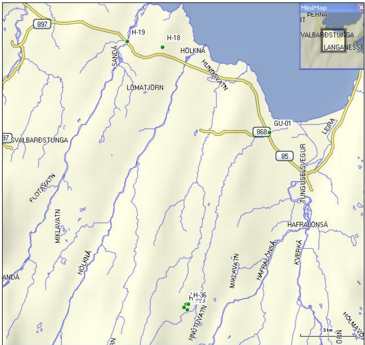
11. mynd. Yfirlitsmynd af borholum í Svalbarðshreppi.