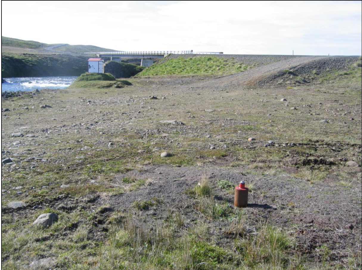
7. mynd. Borhola H-19 í Flögu. Sandá í baksýn.

Borhola H-19 er á eyri vestan við Sandá og skammt neðan Þjóðveggar. Holan er í góðu ásigkomulagi. (7. mynd)