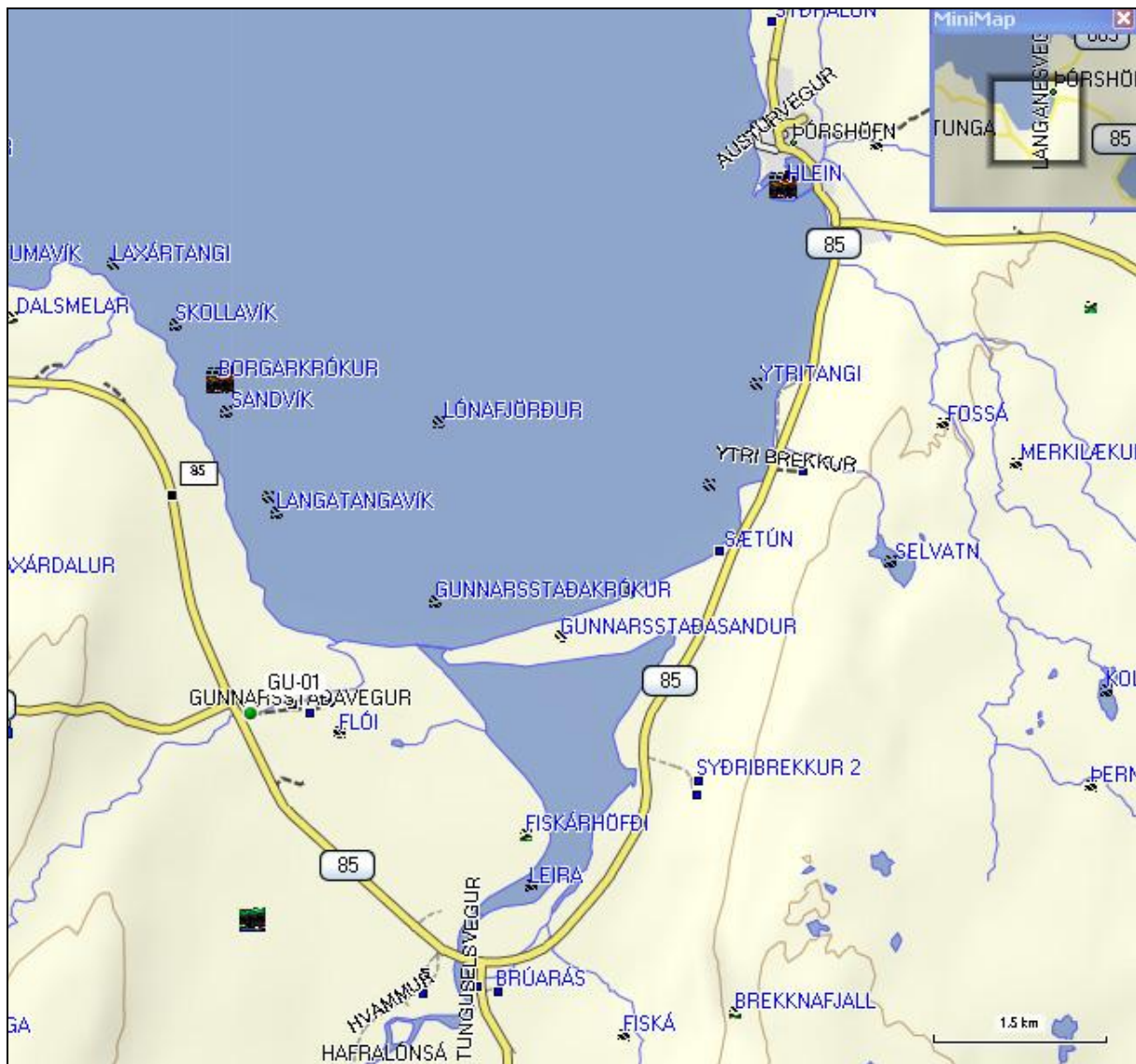
8. mynd. Staðsetning borholu GU-01 á Gunnarsstöðum í Svalbarðshreppi.