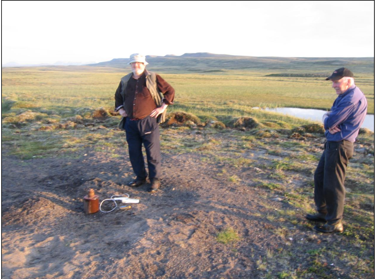
5. mynd. Borhola H-36 á Gunnarsstöðum. Horft í suður.

Borhola H-36 er um 100 metra austur af holu H-34 og stendur á lágu holti norðaustan við flóann með jarðhitnum í. Holan er í góðu ásigkomulagi. (5. mynd)