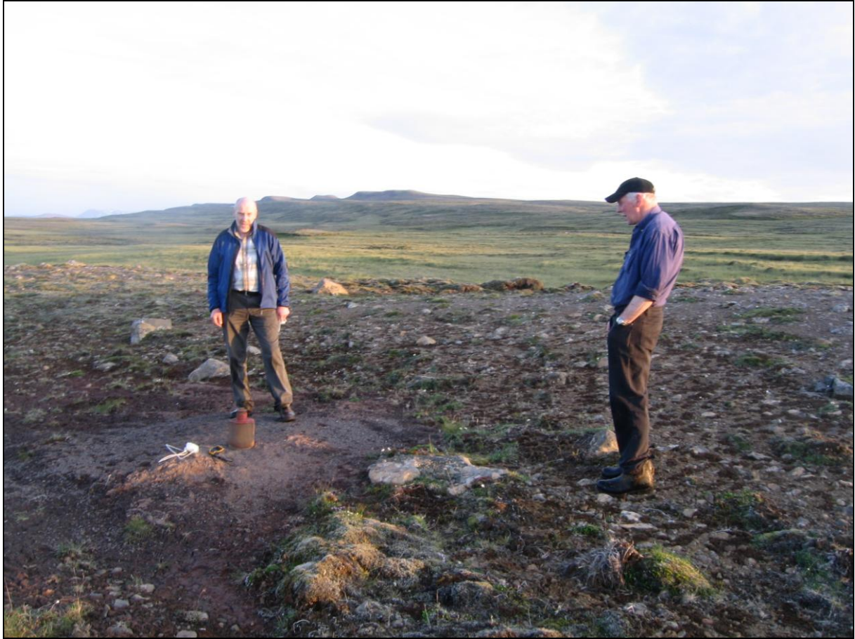
4. mynd. Borhola H-35 á Gunnarsstöðum. Horft í suður.

Borhola H-35 er á lágu holti suðvestan við flóann. Hún er um 200 metra suðvestur frá holu H-34 og um 200 metra norðvestan við H-33. Holan er í góðu ásigkomulagi. (4. mynd)