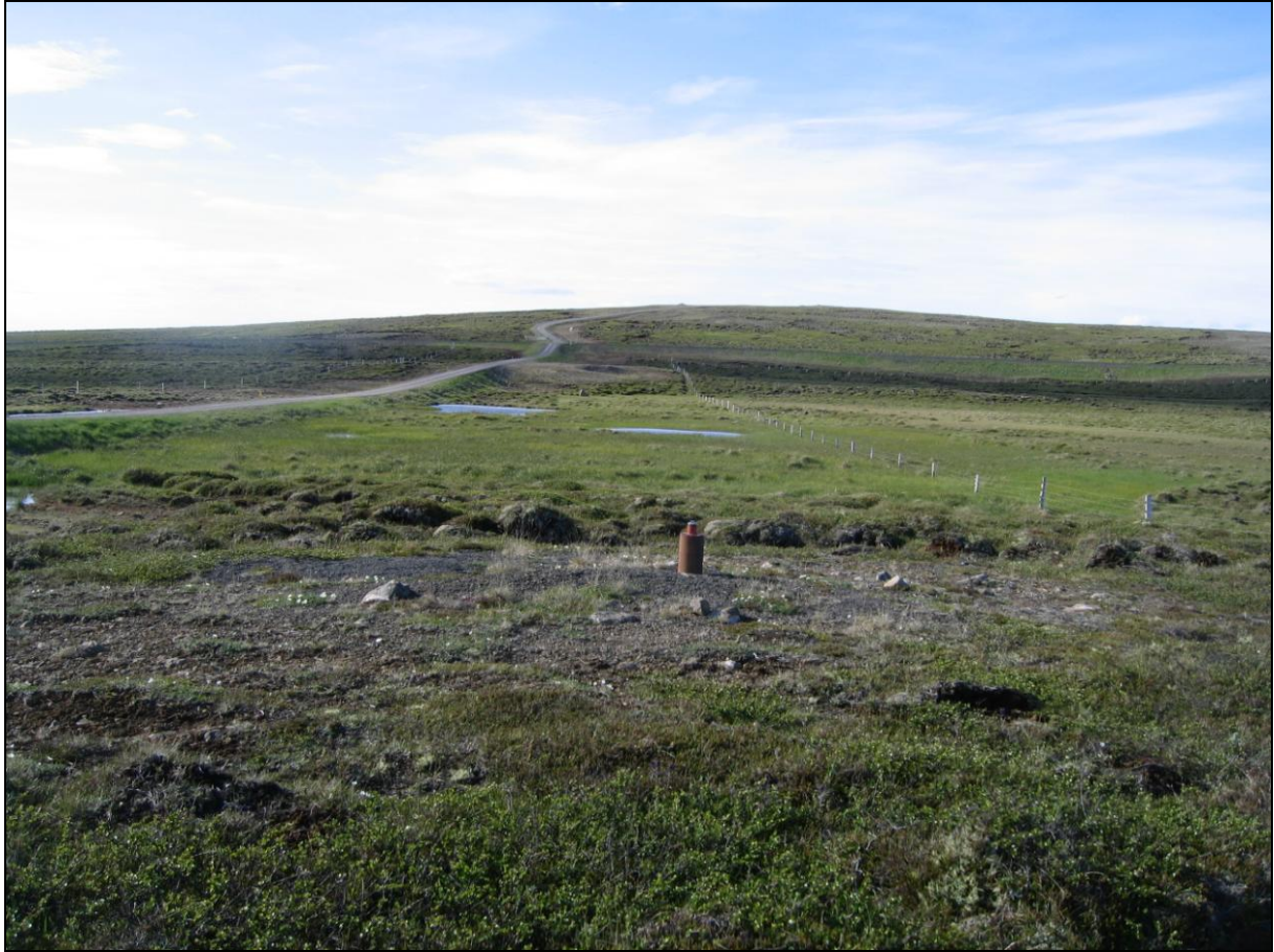
6. mynd. Borhola H-18 á Ytra-Álandi. Horft í vestur.

Borhola H-18 er vestan við heimreiðina að Ytra-Álandi. Hún er á lágu urðarholti um 400 metra norðan við þjóðveginn. Holan er í góðu ásigkomulagi. (6. mynd)