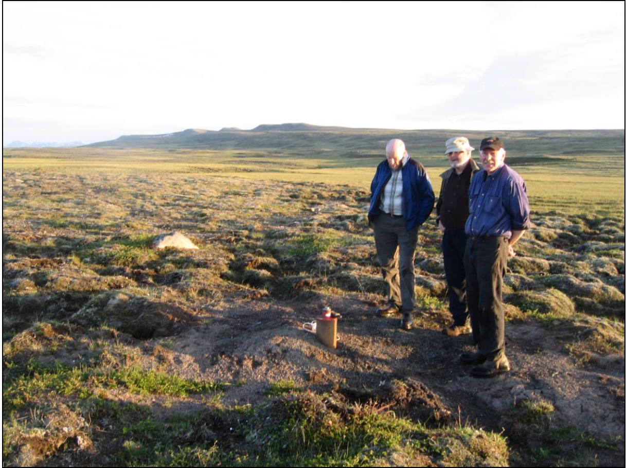
2. mynd. Borhola H-33 á Gunnarsstöðum. Horft í suður.

Borholan er suður í Garðsártungu skammt frá Heitulind. Holan er á holti austan við flóann sem jarðhitinn er í. Holan er í góðu ásigkomulagi. (2. mynd)