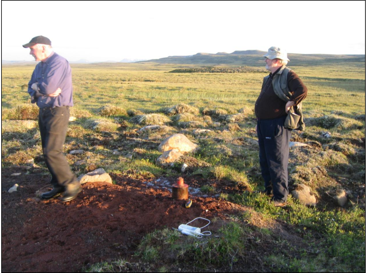
3. mynd. Borhola H-34 á Gunnarsstöðum. Horft í suður.

Borhola H-34 er um 300 metrum norðan við holu 33 og er á lágu holti norðvestan við flóann sem jarðhitinn er í. Holan er í góðu ásigkomulagi. (3. mynd)