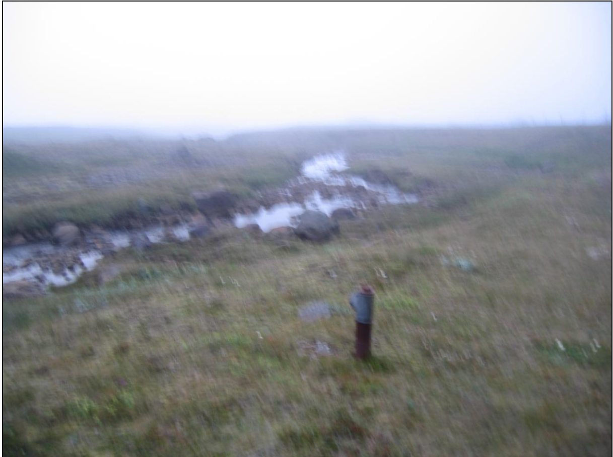
1. mynd. Borhola GU-01 á Gunnarsstöðum. Horft í norður.

Borhola GU-01 er við ána (Garðsá) sem rennur niður að Gunnarsstöðum. Hún er í eyri austan við ána um 100 metra fyrir neðan þjóðveginn. Holan er í góðu ásigkomulagi. (1. mynd)