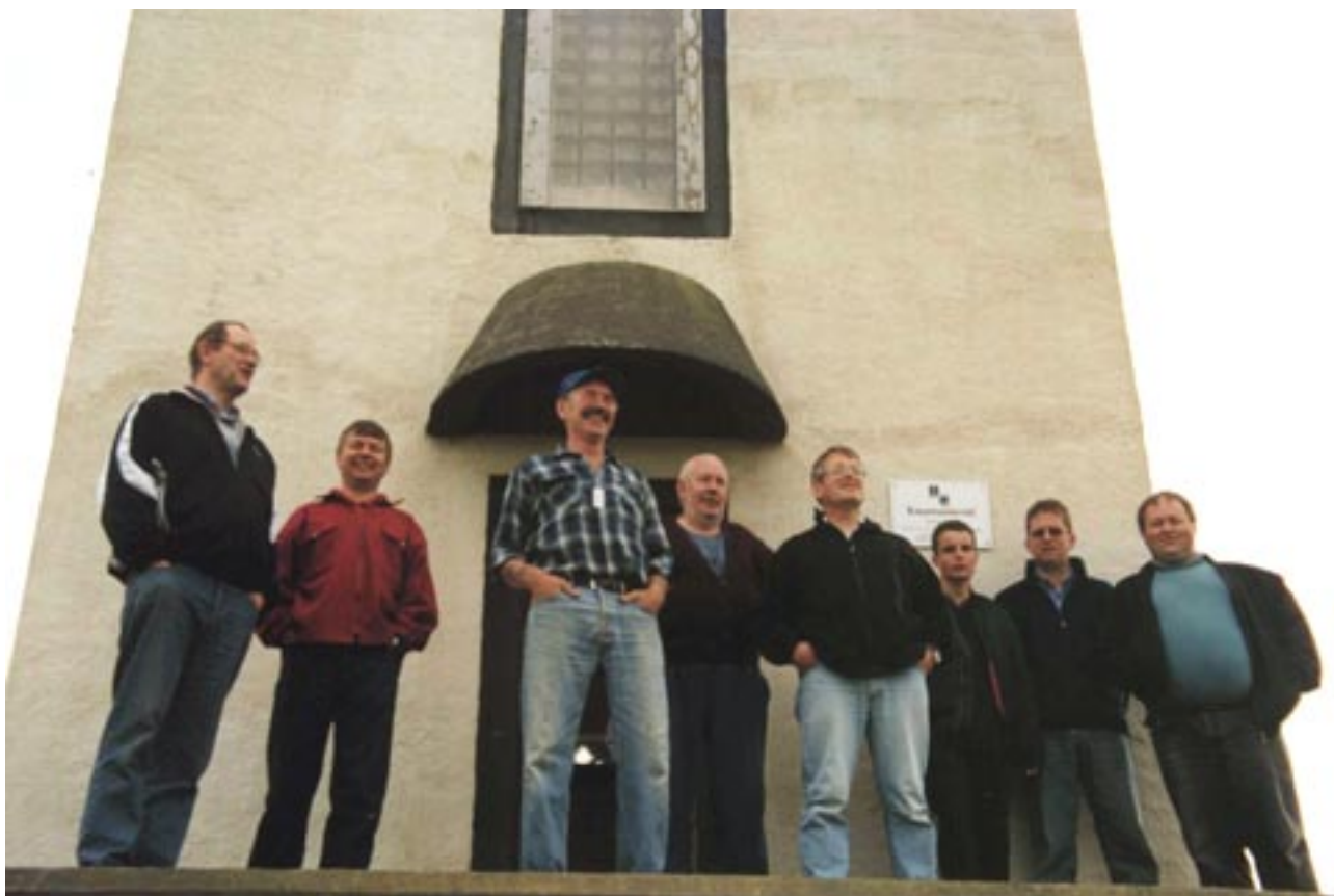
Fyrir framan vitann. F.V. TF3HP, TF3VST, TF3GC, TF3FK, TF3GB, Jökull, TF3AO og TF3VET

Næsta CQ TF kemur út í byrjun desember og þarf efni í það blað að hafa borist ritstjóra fyrir 15. nóvember.