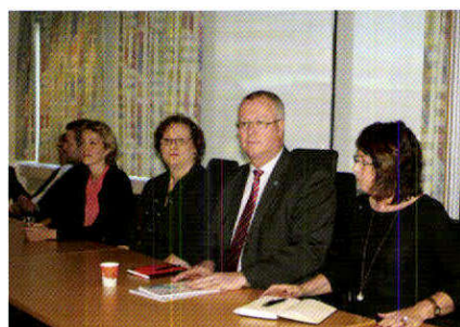
Formaður BSRB ásamt aðilum vinnumarkaðarins á fundi hjá ríkissáttasemjara.