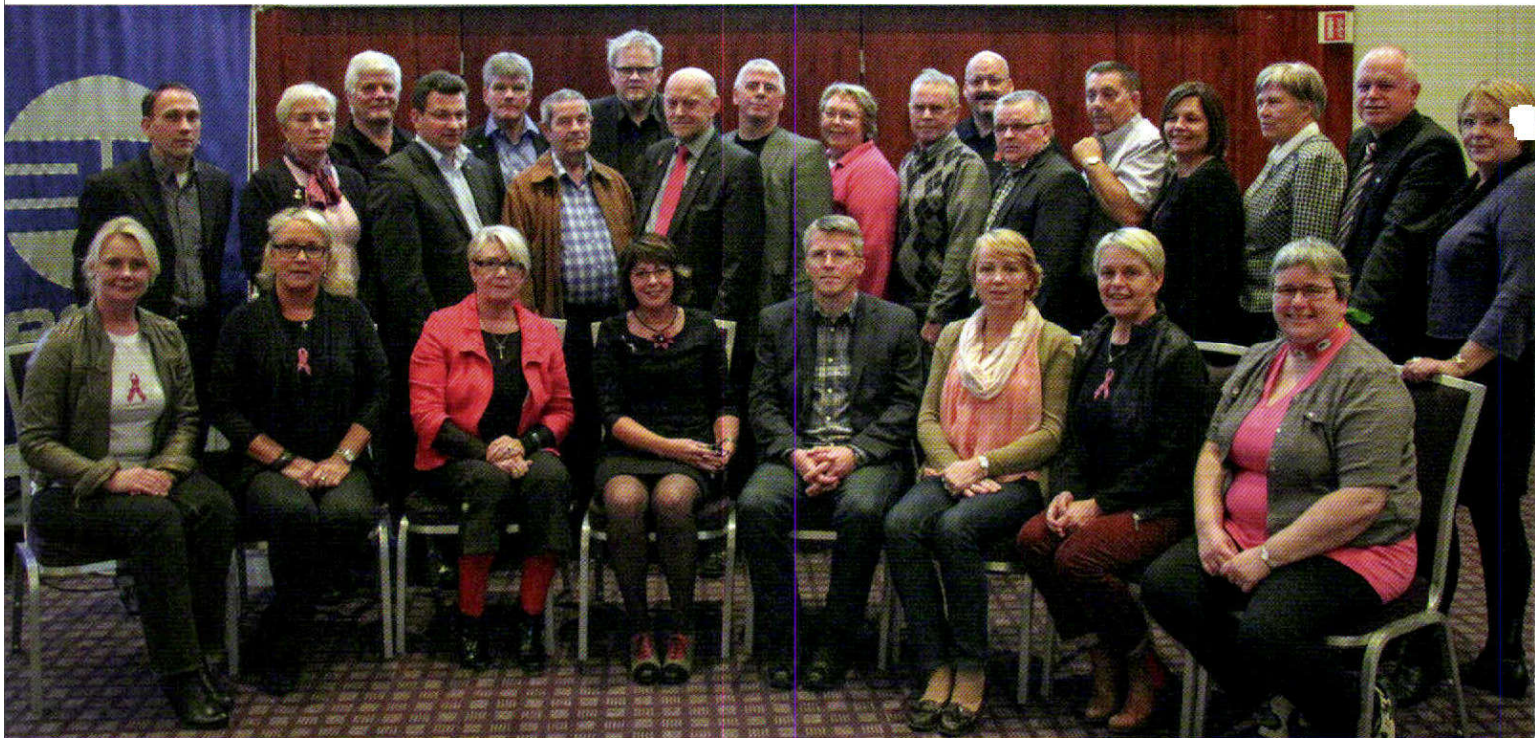
Stjórn BSRB að loknu 43. þingi BSRB.