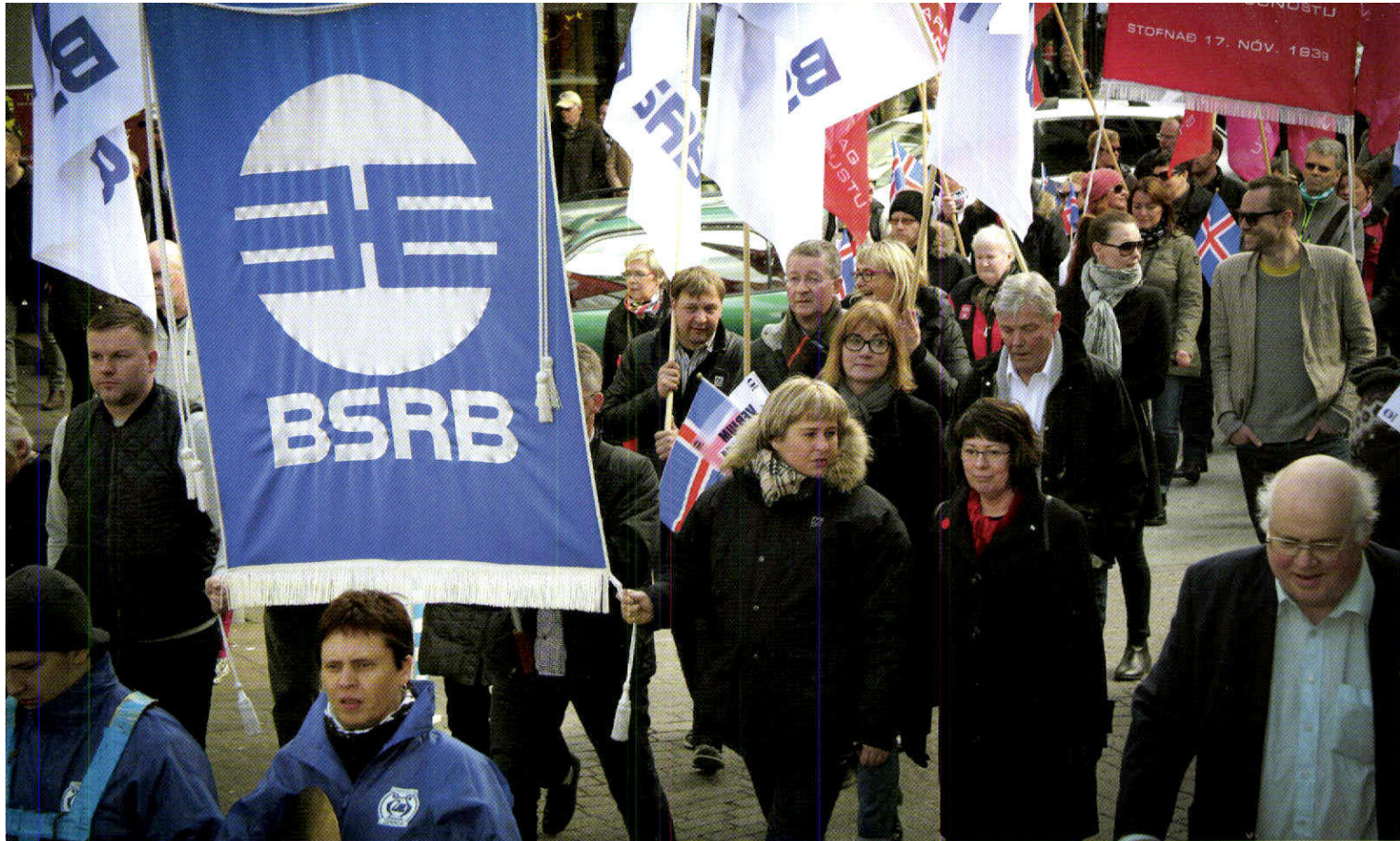
Frá kröfugöngu á baráttudegi verkalýðsins 1. maí 2013.