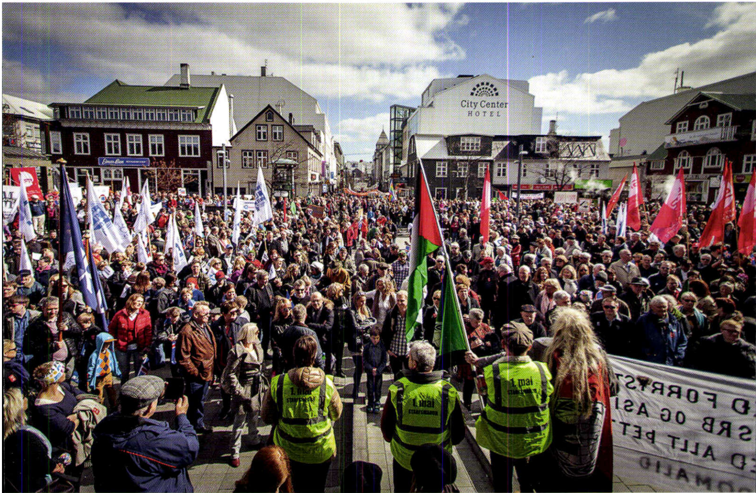
Sjaldan hafa eins margir tekið þátt í háttíðarhöldunum í Reykjavík í tilefni af baráttudegi verkalýðsins eins og árið 2014.