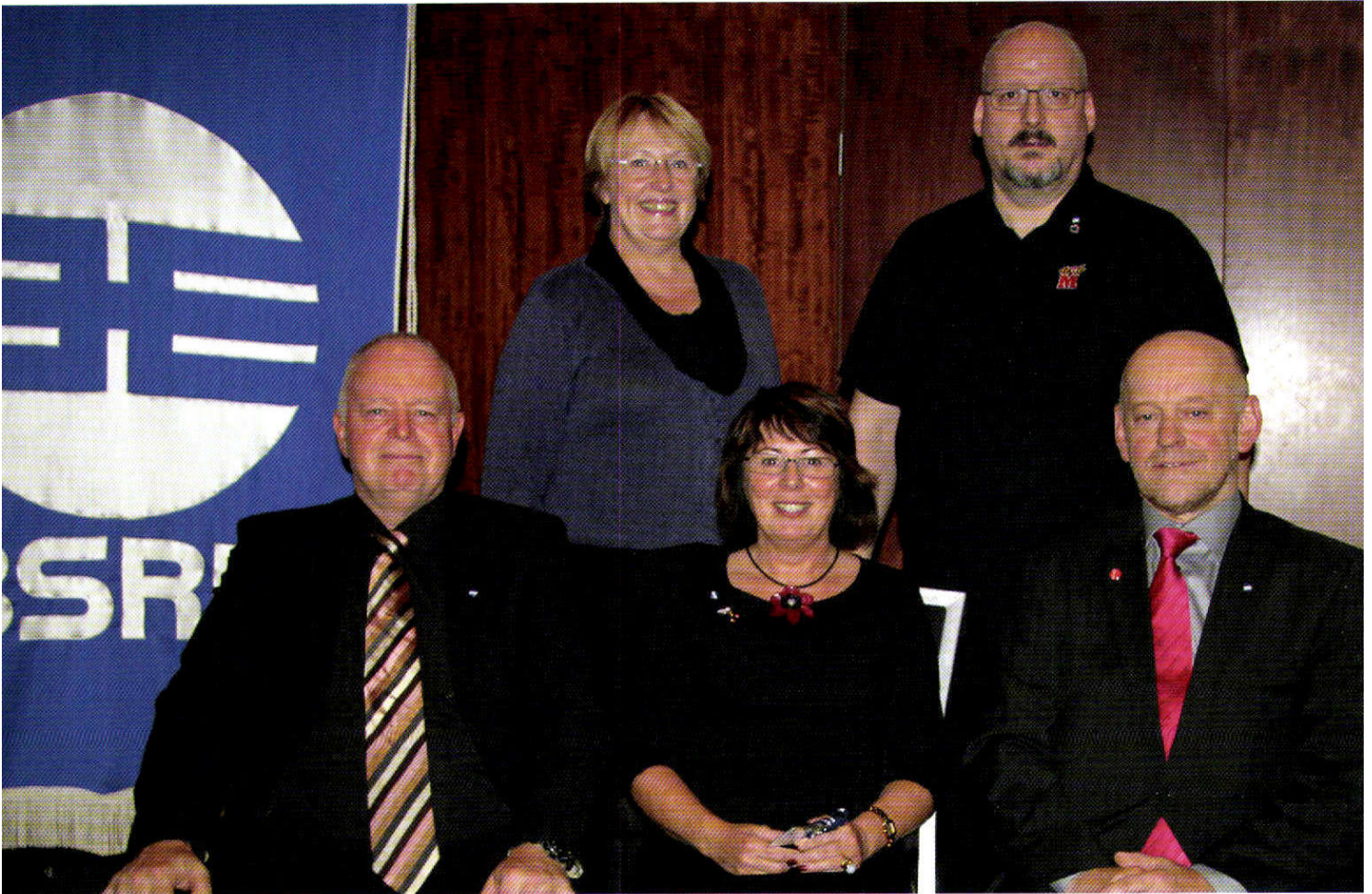
Framkvæmdastjórn BSRB að loknu 43. þingi BSRB.