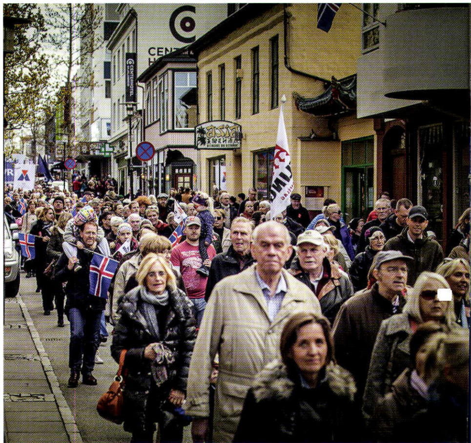
Gengið niður Laugaveginn 1. maí 2014.

Fjórða hópnun er ætlað að annast útfærslu á nýju kerfi og þar með meta hvaða