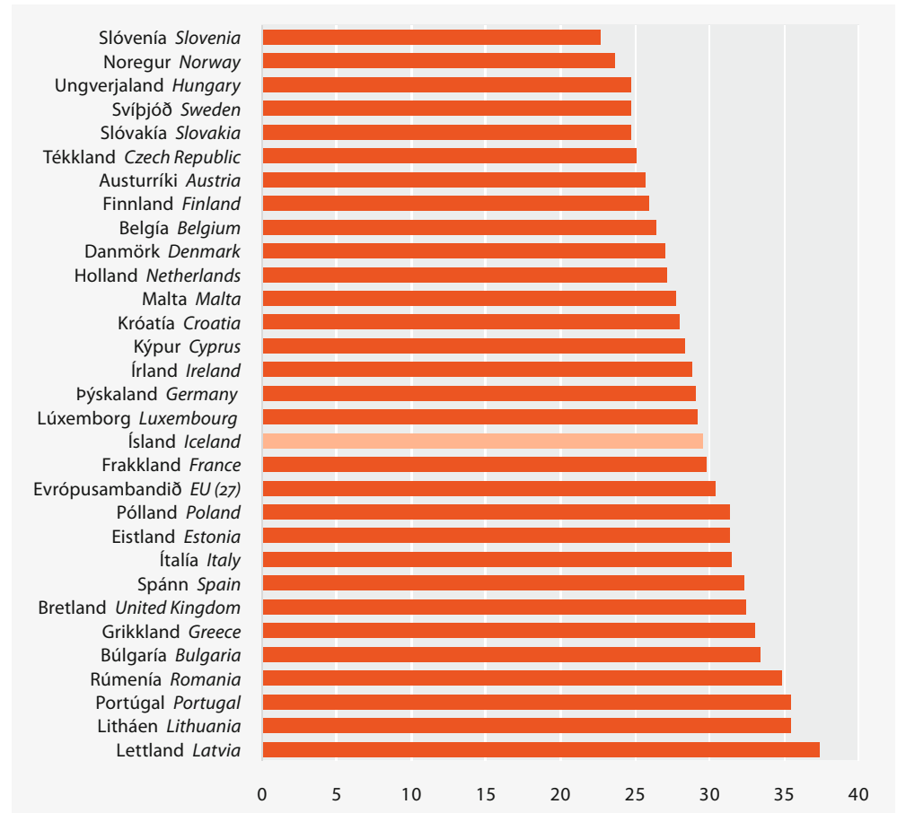
Figure 2. The Gini index, European comparison 2009

Skýringar Notes: Sjá töflu 2. Upplýsingar fyrir Króatíu eru frá árinu 2008. Cf. table 2. Information for Croatia is from 2008.