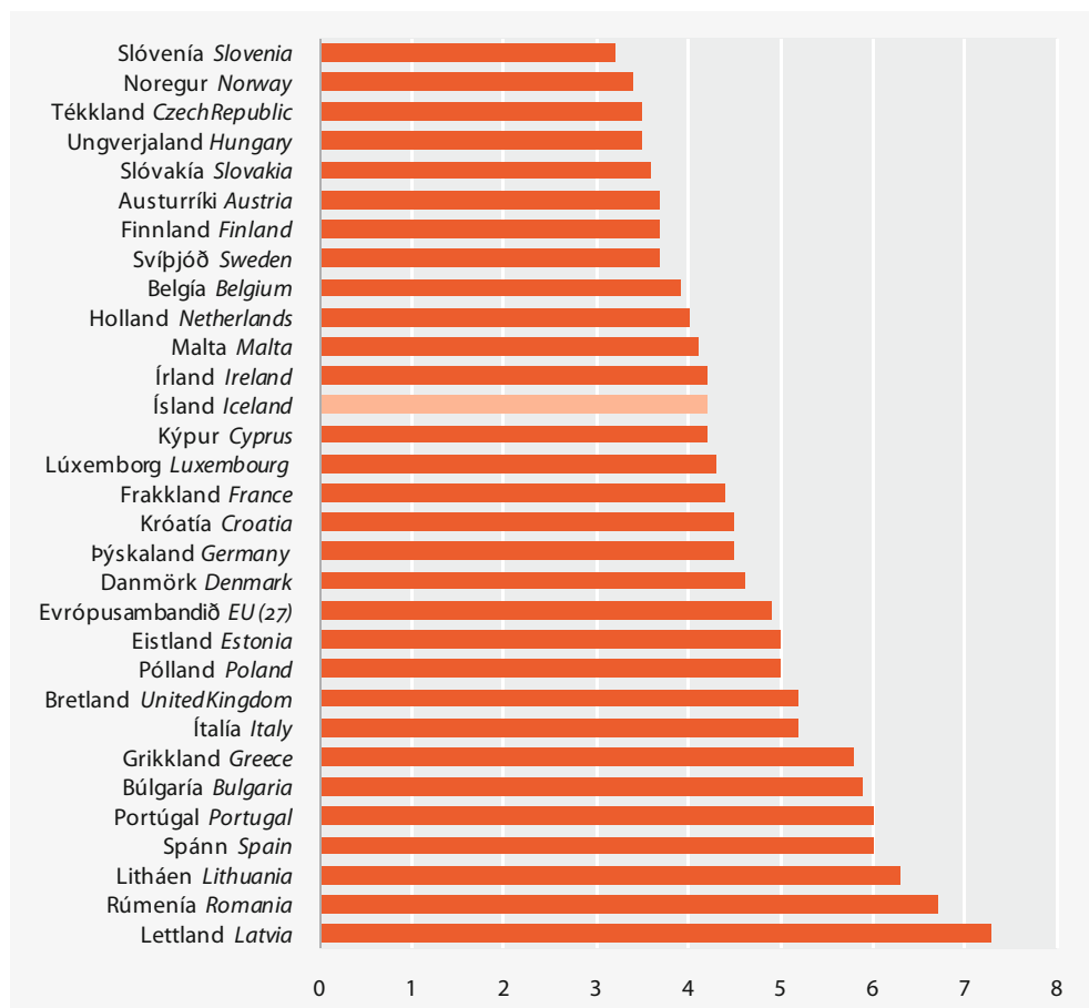
Figure 3. Income quintile share ratio, European comparison 2009

Skýringar Notes: Sjá töflu 2. Upplýsingar fyrir Króatíu eru frá árinu 2008. Cf. table 2. Information for Croatia is from 2008.