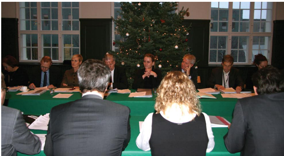
Frá samráðsfundi ríkis og sveitarfélaga í þjóðmenningarhúsinu í desember.

Framkvæmdastjóri sambandsins var skipaður í svokallað stýrinet stjórnarráðsins vegna mótunar og vinnu við gerð sóknaráætlana fyrir landshluta á grundvelli stefnumörkunaráætlunarinnar Ísland 20/20. Í stýrinetinu eiga sæti, auk framkvæmdastjóra sambandsins, fulltrúar allra ráðuneyta og verkefnisstjóra stýrinetsins. Verkefnið er nokkuð umfangsmikið og hefur framkvæmdastjóri varið miklum tíma í það. Um er að ræða ákveðið þróunarferli með það að markmiði að færa vald sem áður var miðlægt á vegum ráðuneyta og þingmanna til heimamanna í héraði. Landhlutasamtök sveitarfélaga eru sá vettvangur sem við ábyrgðinni taka og mynda þau samráðsvettvang, hvert á sínu svæði, með þátttöku margra hagsmunaaðila. Í þessu samstarfi eru áherslur hvers landshluta mótaðar og verkefnum er forgangsraðað innan þess ramma sem fjárveitingar marka. Þetta nýja fyrirkomulag hefur skilað þeim árangri að á árinu 2012