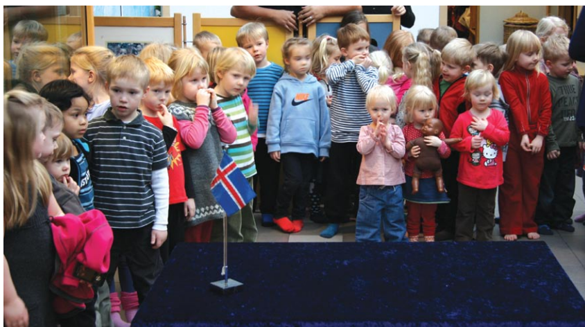
Leikskólabörn á Leikskólanum Hofi stilla sér upp í tilefni af heimsókn formanns sambandsins á degi leikskólans 2012.

Í desember 2012 voru starfsmenn á skrifstofu sambandsins alls 24 og einn að auki á skrifstofu sambandsins í Brussel, samtals í 24,5 stöðugildum.