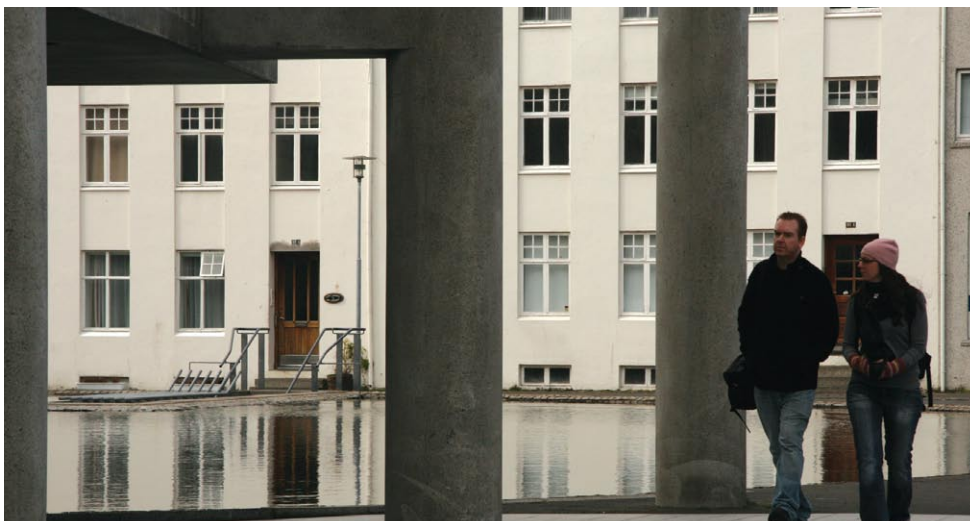
Ferðamenn á rölti í Reykjavík.

Allsherjarþing Evrópusamtaka sveitarfélaga (Council of European Municipalities and Regions – CEMR) kom saman í Cádiz á Spáni í september 2012. Samband