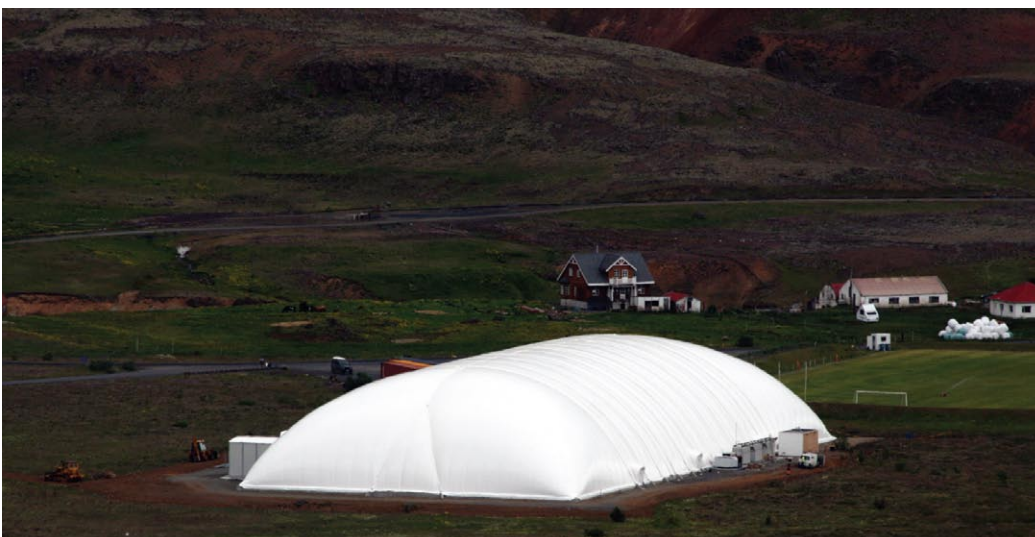
Hvergerðingar tóku í notkun loftborið íþróttahús á árinu 2012.

Viðræður hófust fyrri hluta árs um breytta verkaskiptingu ríkis og sveitarfélaga á sviði barnaverndarmála, gjaldtöku fyrir vistunarúrræði og samræmda gjaldskrá fyrir fósturúrræði, í samræmi við breytingar sem gerðar voru á barnaverndarlögum árið 2011. Fljótlega var ákveðið