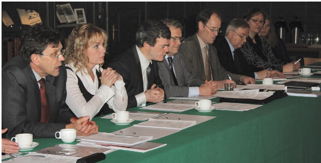
Frá samráðsfundi ríkis og sveitarfélaga sem fram fór í Þjóðmenningarhúsinu.

Fulltrúi sambandsins tók þátt í vinnu starfshóps um eflingu leikskólastigsins en skilaði séráliti, þar sem tekið er undir tillögur hópsins um að fjölga námsleiðum í leikskólakennaranámi en áfram eru gerðar alvarlegar athugasemdir af hálfu sambandsins við það að halda til