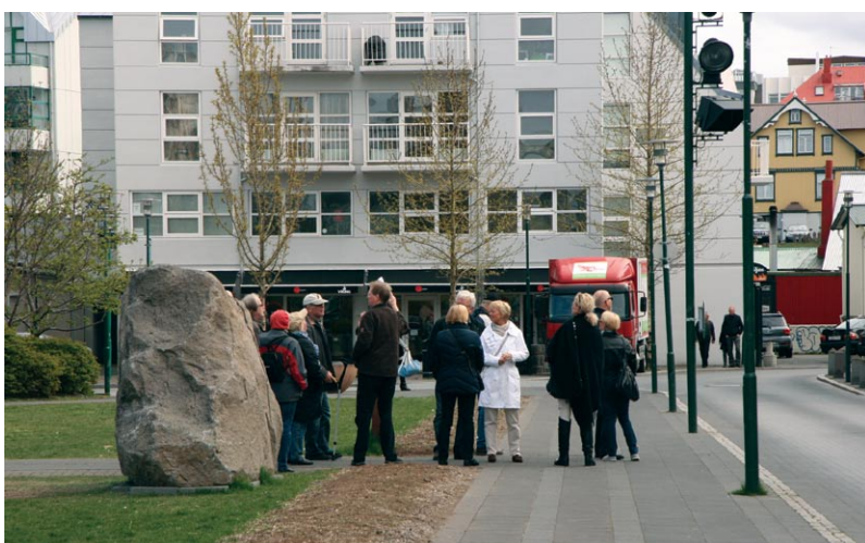
Ferðamenn fá leiðsögn um Reykjavík.

Fulltrúi sambandsins hefur tekið þátt á fundum staðardagskrárfulltrúa þar sem m.a. er rætt um framtíð staðardagskrár og verkefni sem heyra undir sjálfbæra þróun. Haldinn var einn vinnufundur þar sem farið var yfir stöðu sjálfbærni í áætlunum ríkisins og skipulagsvinnu.