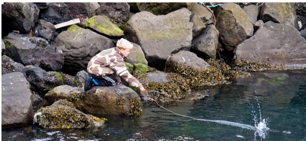
Ungur veiðimaður í Grindavík

Stjórn sambandsins hélt 10 fundi á árinu 2011 auk eins fundar með formönnum og framkvæmdastjórum landshlutasamtaka sveitarfélaga. Sérstakur vinnufundur stjórnar var haldinn í Borgarbyggð í febrúar um stefnumörkun sambandsins 2011–2014. Að jafnaði eru stjórnarfundir haldnir í húsnæði sambandsins að Borgartúni 30 í Reykjavík, en reynt er að halda þeirri hefð að a.m.k. einn fundur á ári sé haldinn á landsbyggðinni. Að þessu sinni var haldinn stjórnarfundur í Vestmannaeyjum í september. Stjórn og starfsmenn sambandsins, sem tóku þátt í fundinum, hittu sveitarstjórnarmenn í Vestmannaeyjabæ og kynntu