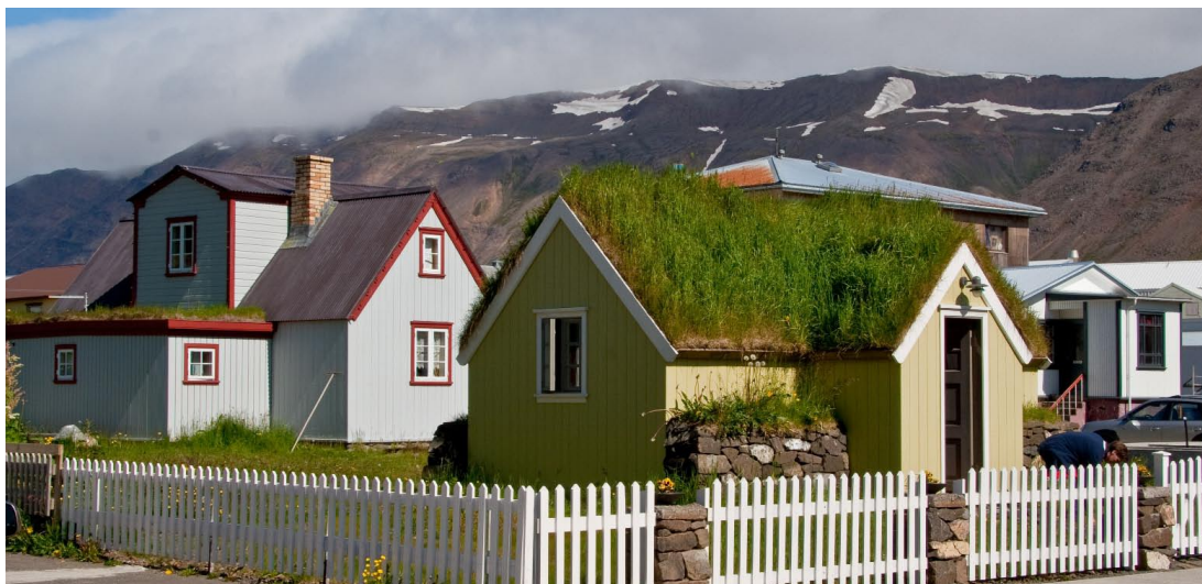
Götumynd frá Siglufirði

Á árinu var upplýsingalykill fyrir Upplýsingaveituna frágenginn. Fræðslufundur um verkefnið var haldinn fyrir sveitarfélögin sl. vor og var honum einnig varpað út á netinu. Fyrirtækin Maritech og Tölvumiðlun önnuðust uppsetningu upplýsingalykilsins hjá þeim sveitarfélögum sem eru í viðskiptum hjá þeim. Reykjavíkurborg er að vinna í uppsetningu hjá sér svo og Akureyri. Hagstofa Íslands hefur unnið að uppbyggingu gagnagrunns sem kemur til með að taka á móti fjárhagslegum upplýsingum frá sveitarfélögum. Hann er að mestu frágenginn og yfirfærsla gagna frá nokkrum sveitarfélögum er hafin.