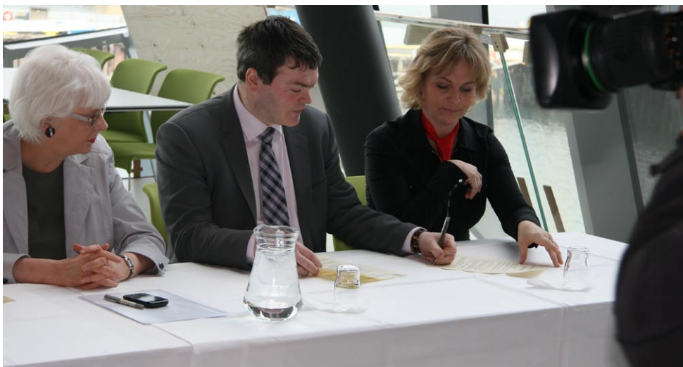
Samkomulag vegna málefna tónlistarskólans var undirritað í maí

Sambandið gaf í byrjun nóvember út skýrslu sem nefnist Félagsþjónusta sveitarfélaga árið 2011. Ekki hafa áður verið gefnar út svo yfirgripsmiklar upplýsingar um félagsþjónustu sveitarfélaga. Í skýrslunni er fjallað um þá þætti sem miðlæg gagnaöflun nær yfir svo sem félagslega heimaþjónustu, fjárhagsaðstoð, barnavernd og húsnæðismál. Þessu til viðbótar er að finna í skýrslunni ýmsan fróðleik sem lögfræði- og velferðarsvið sambandsins hefur tekið saman.