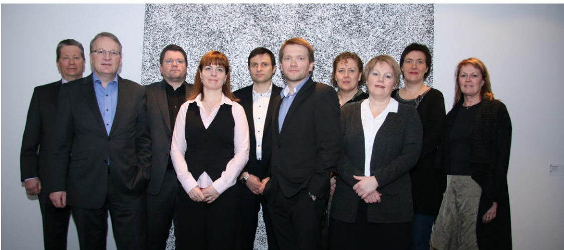
Samráðsnefnd um málefni fatlaðs fólks kom saman til fyrsta fundar í febrúar 2011

Félagspjónustunefnd sambandsins fundaði fjórum sinnum á árinu og tók virkan þátt í framfylgd tilfærslu á málefnum fatlaðra til sveitarfélaganna, sem kom til framkvæmda í ársbyrjun, ásamt mörgum öðrum verkefnum. Á vettvangi nefndarinnar hefur m.a. verið fjallað um vandamál sem komið hafa upp í tengslum við verkefnatilfærsluna og leiðir til þess að samþætta þjónustu við fatlað fólk annarri þjónustu sveitarfélaga.