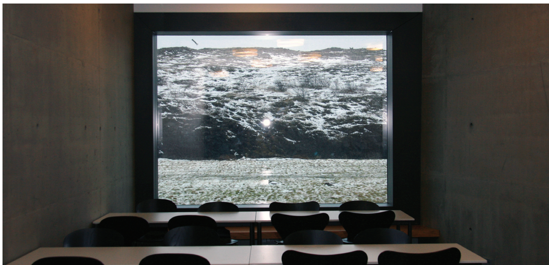
Skólastofa í Menntaskóla Borgarfjarðar skartar óvenjulegri landslagsmynd

Niðurstaða úr rekstri sveitarfélaganna fyrir árið 2010 liggur ekki fyrir enn. Sveitarfélögin hafa allt frá hruni haustið 2008 unnið að umfangsmiklum hagræðingar- og sparnaðaraðgerðum. Álögur ríkisvaldsins hafa meðal annars með mikilli hækkun tryggingargjaldsins dregið úr þeim ávinning sem sveitarfélögin höfðu náð í hagræðingu og sparnaði. Ríkisstjórnin tók ákvörðun um að endurgreiða seinni hluta tryggingargjaldshækkunarinnar á árinu 2010 en fjárhæðin var áætluð nær 1.4 ma.kr. Með fjárlögum fyrir árið 2011 var tekin ákvörðun um að þessi endurgreiðsla skyldi falla niður á árinu 2011.