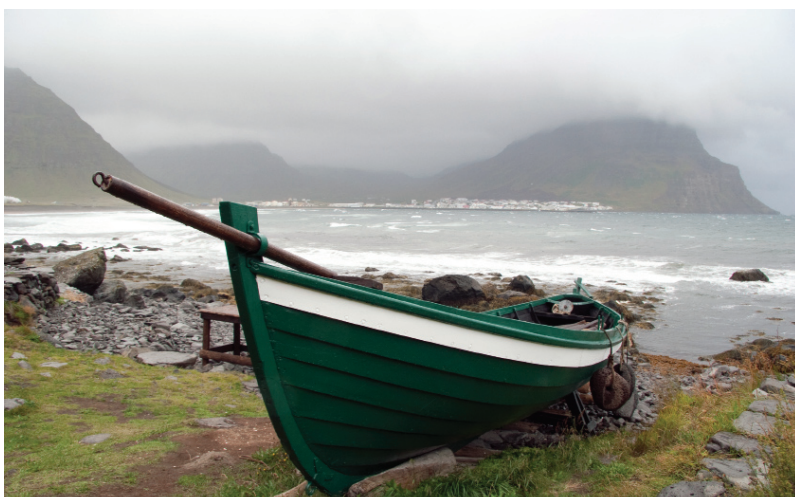
Frá Ósvör við Bolungarvík

Sambandið stóð fyrir námskeiðum í nóvember á Vesturlandi, Vestfjörðum, Norðurlandi vestra og Suðurnesjum um lagalega stöðu sveitarfélaga, fjármál og vinnuveitendahlutverk þeirra. Námskeiðum í öðrum