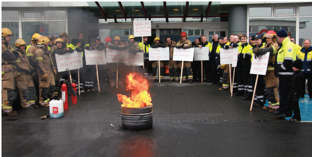
Slökkviliðsmenn mættu fyrir utan Borgartún 30 í maí til að knýja á um nýjan kjarasamning

Sambandið tilnefndi fulltrúa í samstarfshóp um aðgerðaáætlun í loftslagsmálum. Samstarfshópurinn er á vegum umhverfisráðuneytisins og skilaði áfangaskýrslu á árinu.