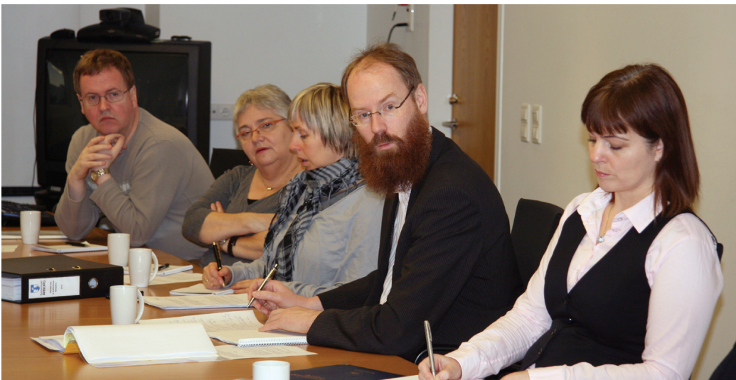
Fyrsti fundur bakhóps um yfirfærslu málefna fatlaðs fólks fór fram í desember

Gefin hafa verið út tvö rit sem ætluð eru sveitarfélögum til stuðnings við mótun skólastefnu. Annars vegar er það handbók um gerð skólastefnu til að auðvelda sveitarfélögum að setja sér slíka stefnu og nýta sem virkt stjórnþæki. Hins vegar er stytt útgáfa af handbókinni