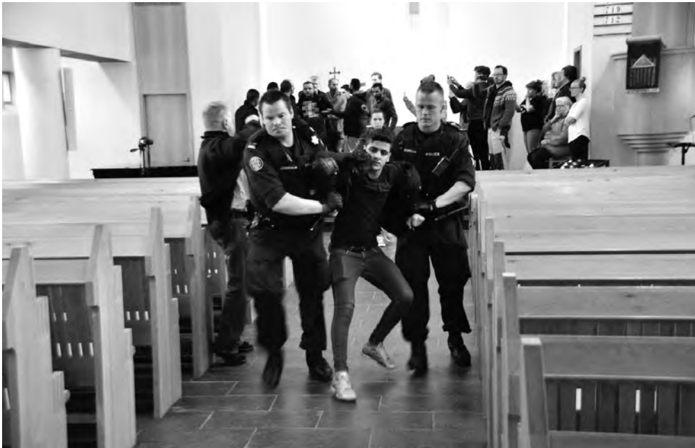
Hælisleitendur færðir úr Laugarneskirkju með lögregluvaldi

Nýlegur atburður hér á landi leiðir huga okkar að þessu málefni með óvæntum hætti og þá alveg sérstaklega að kirkjugriðum, sem fáir núlifandi menn hafa hugleitt eða jafnvel vissu um þar til atburðirnir vöktu athygli á þeim. Þar urðu aðgerðir þjóðkirkjunnar með sínum hætti – að vísu aðeins táknrænum – til þess að leitast var við að „blása lífi“ í forna hefð, sem fallin var í gleysku að því er heita mátti, og almenningur um leið vakinn til meðvitundar um mögulegar þarfir manna nú á dögum um frið og grið.