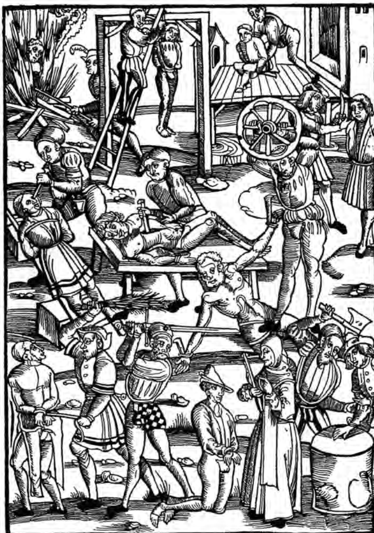
Á þessari mynd úr þýsku riti frá 1508 eru sýndar helstu tegundir líkamlegra hegninga sem tíðkaðar voru í Evrópu á þeim tímum

Þá skulu að lokum nefndar til sögu tvær greinar, sem fjalla um efnissvið, er tengjast lögum og réttarframkvæmd liðins tíma, þ.e. réttarfélagssagan og réttarhagsagan , en þar snúa rannsóknar- og úrvinnsluefnin að félagslegum og hagrænum afleiðingum tiltekinna réttarreglna.