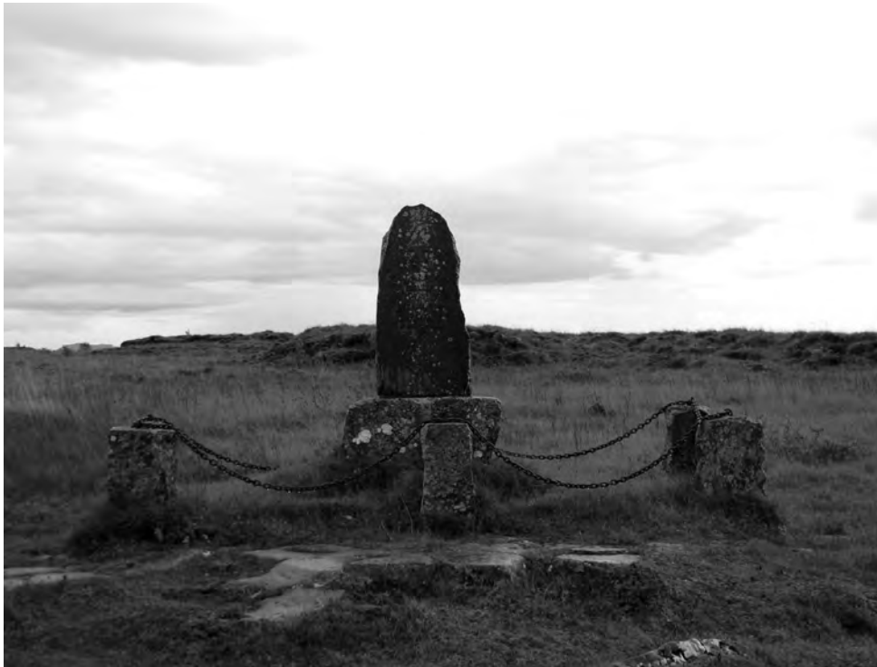
Minnismerki í Skálholti um aftöku Jóns biskups Arasonar og sona hans

Að lokum má leiða hugann að því, hvort framin hafi verið dómsmorð hér á landi fyrr á tíð, svo að vitað sé. Ördugt er að henda fullar reiður á því, miðað við varðveittar heimildir, en ljóst er að minnsta kosti, að stutt gat orðið milli lífs og dauða ýmissa manna, er við sögu koma á róstudímum svo sem á Sturlungaöld og siðbreytingartímunum. Þá var ekki allt af setningi slegið varðandi „andmælarétt“ og aðra stöðu sakaðra manna enda þótt þeir væru líflátnir í þeirri trú valdamanna, að þeir ættu ekki annað skilið!