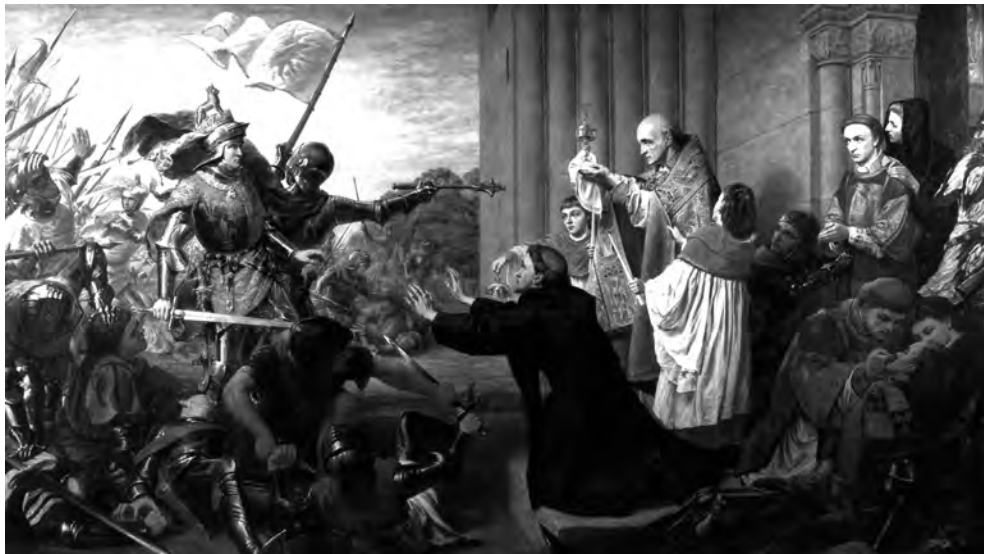
Kirkjugrið rofin með vopnavaldi

Griðlönd – friðlýst svæði – eru víða til í veröldinni eins og kunnugt er, til dæmis friðlönd viltra dýra, þar sem ekki má granda þeim, en einnig tiltekin aðseturssvæði manna, þá gjarna frumbyggja í löndum, sem að mestu eru setin hvítum mönnum (svo sem friðlönd indíána í Norður-Ameríku og sambærileg svæði, sem ætluð eru frumbyggjum Ástralíu á þeirra heimaslóðum). Þar er ætlast til að það fólk, er verndar nýtur, geti ráðið sínum „innri“ málum án íhlutunar „hvítungjanna“. Þau griðasvæði, sem mestrar athygli njóta nú um stundir, ef miða má við almennar fréttir af heimsmálum, eru þau hæli, sem sendiráð ýmissa þjóða veita sumum þeim, sem eftir leita og ídulega eru á flótta undan armi laganna í öðru ríki eða ríkjum. Sendiráðsgrið af því tagi verðskulda vissulega nánari umfjöllun en hún verður þó að bíða að sinni.