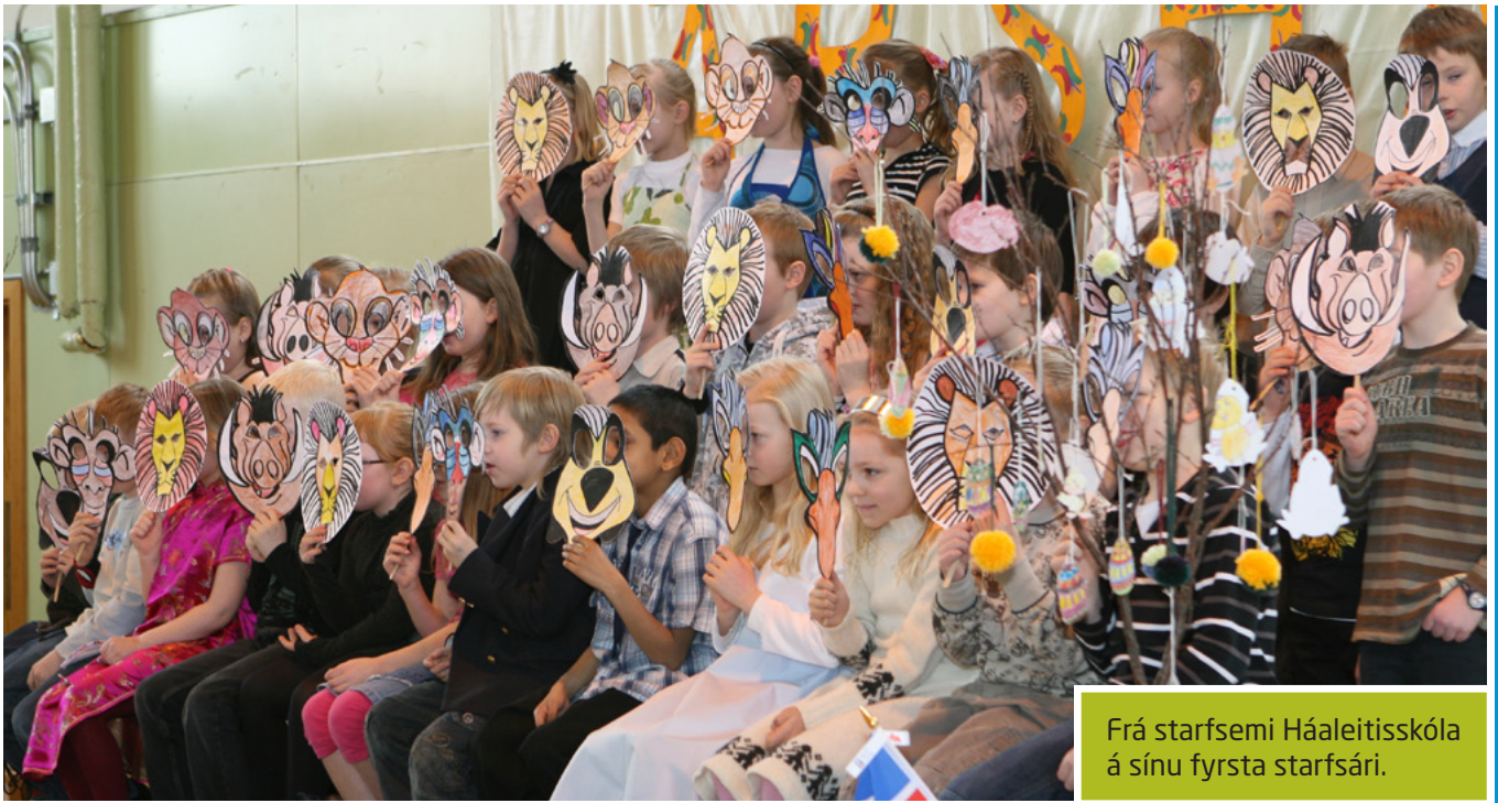
Frá starfsemi Háaleitisskóla á sínu fyrsta starfsári.