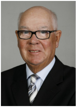
Páll Sigurjónsson stjórnarformaður