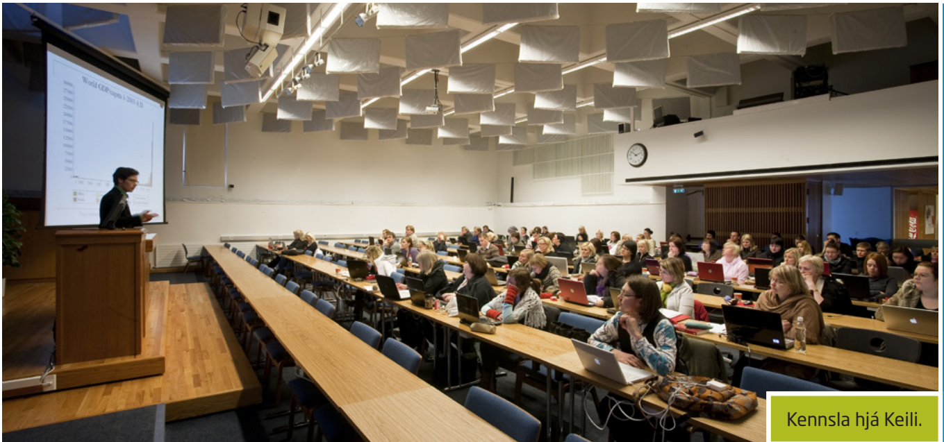
Kennsla hjá Keili.