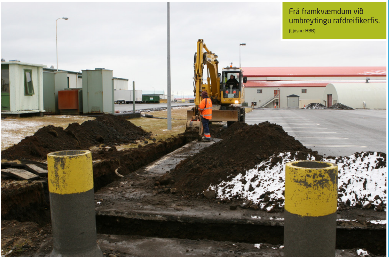
Frá framkvæmdum við umbreytingu rafdreifikerfis.

Samkvæmt samkomulaginu sér HS hf. um uppbyggingu á nýju 50-riða dreifikerfi raforku á svæðinu ásamt viðeigandi endurbótum á vatnsveitu svæðisins.