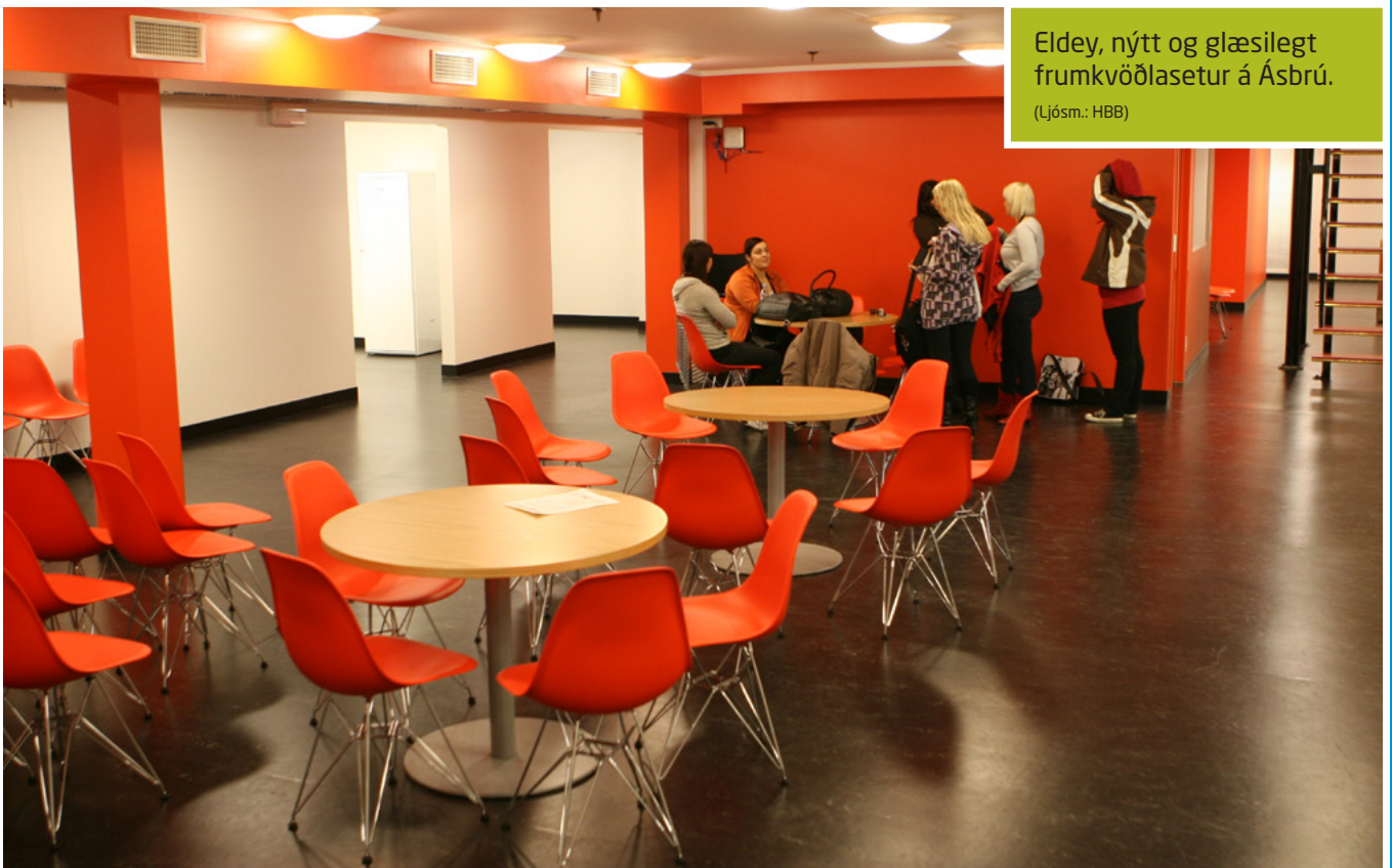
Eldey, nýtt og glæsilegt frumkvöðlasetur á Ásbrú.

Frumkvöðlasetrið Eldey hósti áður verkfræðideild bandaríska hersins, Public Works. Á sumarmánuðum fékk Eldey mikla yfirhalingu þar sem húsnæðinu var gjörbreytt. Var rafmagn lagað að Evrópustöðlum, auk þess sem settar voru upp skólastofur, skrifstofur og opið miðrými. Annar hluti hússins, smiðjuhluti þess, fékk hinsvegar að halda sér að mestu leyti. Í smiðjuhúsnæðinu hafa frumkvöðlafyrirtæki aðstöðu til rannsókna, þróunar og framleiðslu.