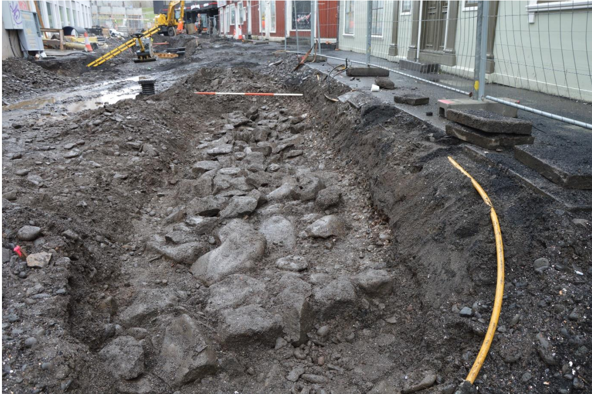
Mynd 3. Stétt [07]. Horft í austur.

Framkvæmdasvæðið náði þá um 2 m í austur eftir Hafnarstræti. Við hvoruga rannsóknina sáust nein ummerki um þessa stétt. 7 Þær mannvistarleifar sem fundust við rannsóknina undir Hafnarstræti 16 voru allar taldar vera frá fyrri hluta 19. aldar eða eldri, 8 og voru því eldri en stéttin.