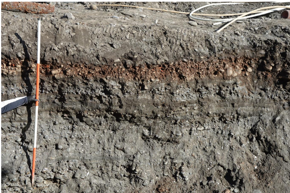
Mynd 2. Rauðbrún yfirborðslag [06] efst í norðursniði lagnaskurðar, framan við Hafnarstræti 17.

rauðbrúnni mold með mikið af lábörðum smásteinum, um 0,5m undir núverandi yfirborði. Þetta eru líklegast leifar af gömlu yfirborði sem hægt var að aldursgreina út frá gerðfræði leirgripa, til lok 19. aldar fram á snemma á 20. öld. Þetta lag lá ofan á sjávarkambinum sem myndaði náttúrulega strandlengju á þessu svæði (sjá mynd 2).