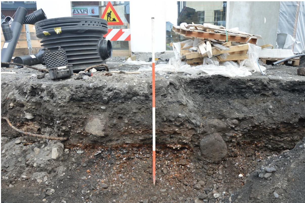
Mynd 4. Grjóthnullungar í norðursniði skurðar framan við Hafnarstræti 21.

Óraskaðar minjar komu einnig í ljós í sniði skurðar sem lá rétt suðaustan við austurenda lóðar Hafnarstrætis 21 (sjá mynd 1). Í sniðinu komu í ljós stórir grjóthnullungar (allt að 50 cm í þvermál) sem lagðir höfðu verið með um 1,5 m millibili í sand- og moldarlög ([03], [04]=[09]), þar sem fannst mikið af dýrabeinum (sjá myndir 4 & 5). 11 Inn á milli steinanna var nokkuð af viðarleifum. Um 0,2 m innan (norðan) við sniðið lá eldri lagnaskurður, samhliða þeim sem minjarnar komu í ljós í, og því var einungis hægt að skrá þessar mannvistarleifar í sniði.