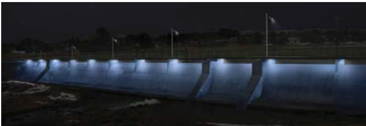
Lýsing Elliðaárstíflunnar skv. tillögum frá Iguzzini.

Nefndin telur að það yrði verkefninu til framdráttar ef mótuð væri einhverskonar heildarstefna í þessum málum sem tekur á tegund lýsingar, útliti ljósastólpa og hvernig skuli staðið að hönnun og vali lýsingar. Á meðan hópurinn starfaði lýsti Orkuveitan upp tré við Aðalstræti með ljósleiðurum. Þetta verk þykir hafa heppnast mjög vel. Bent var á það sem vel heppnaða aðgerð í lýsingarmálum.