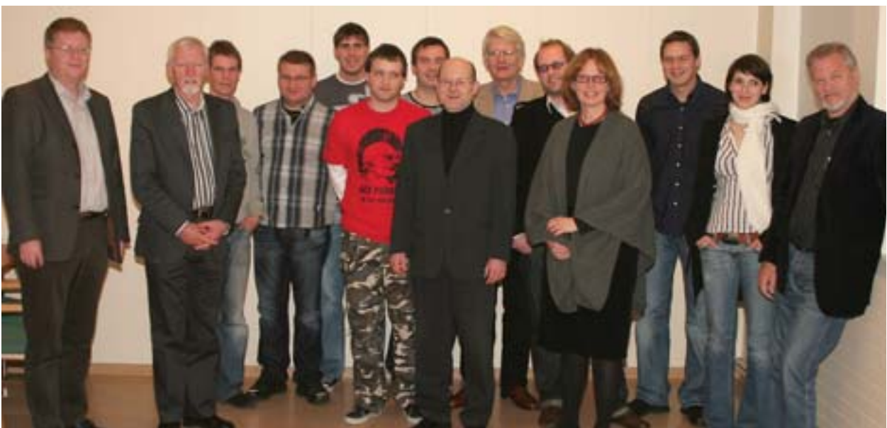
Hluti nemenda og kennarar ásamt varaformanni LFÍ og skólameistara IR við upphaf námsins.