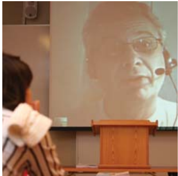
Kveðja frá Vitus Bering í Danmörku.