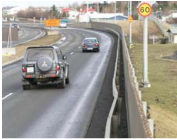
Við Reykjanesbraut í Hafnarfirði. Hér er öryggisstólpin vel varinn.