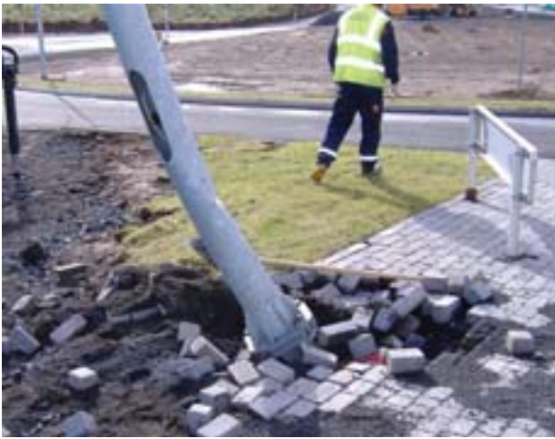
Ákeyrður „öryggisstólpi“ sem ekki virkaði eins og til var ætlast.