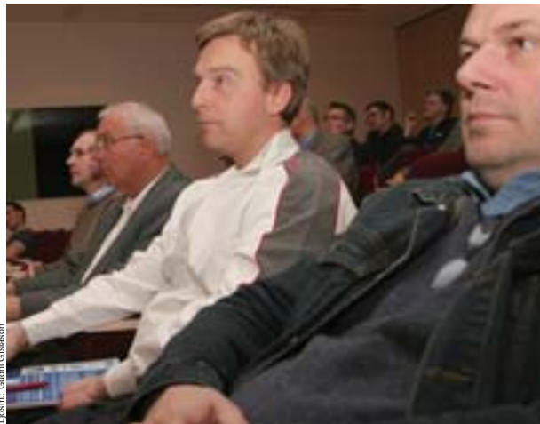
Nokkrir stjórnamanna á aðalfundinum.