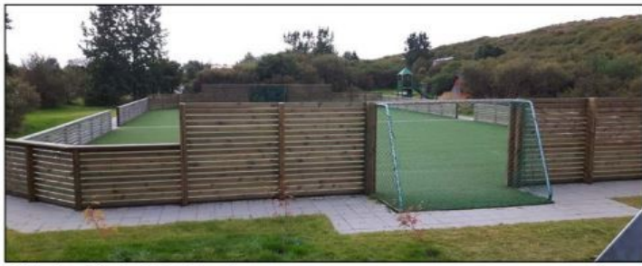
Nýi íþróttavöllurinn í Munaðarnesi.

Í Munaðarnesi hefur verið mikil uppbygging síðustu ár og hefur svæðið tekið stakkaskiptum á margan hátt.