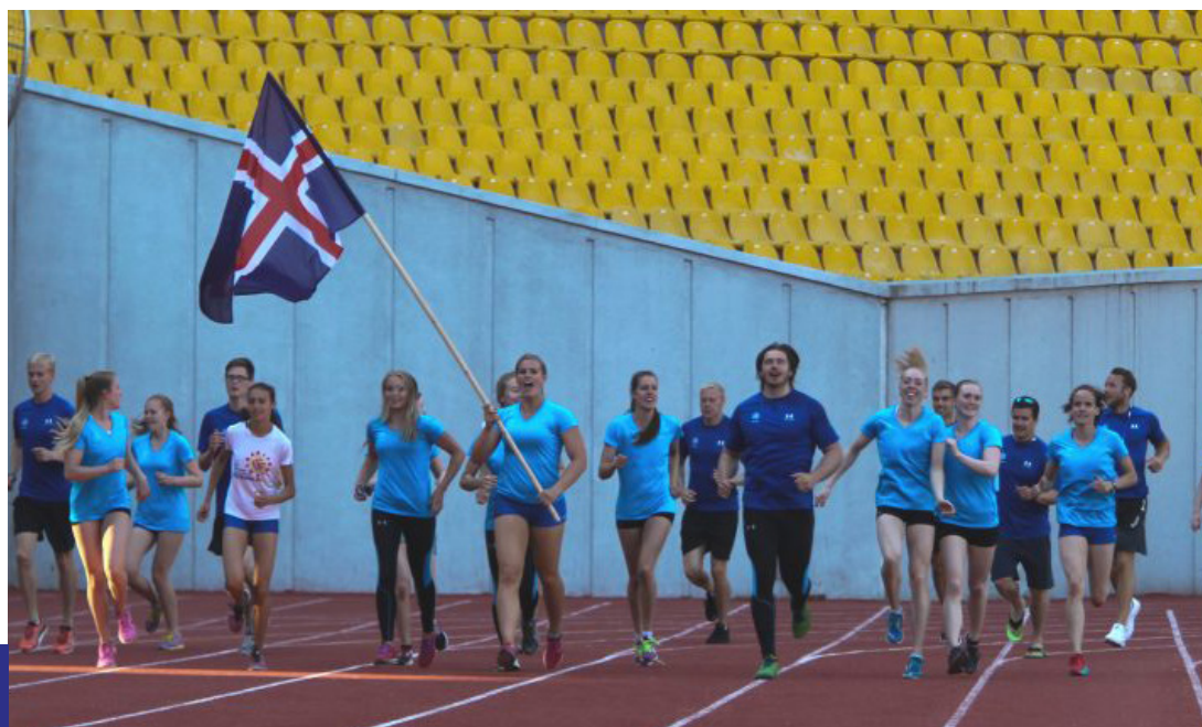
K tir  slenskir keppendur   San Mar no

Sm þj ðaleikarnir f ru fram   San Marino dagana 29. ma  – 3. j n  og keppni   frj lsum  þr ttum dagana 30. ma , 1. j n  og 3. j n .    slenska landsliðinu var 21 keppandi sem unnu samtals unnu 24 ver laun, n est flest   eftir liði K pur. Sj  n nar   t flu   neðan.