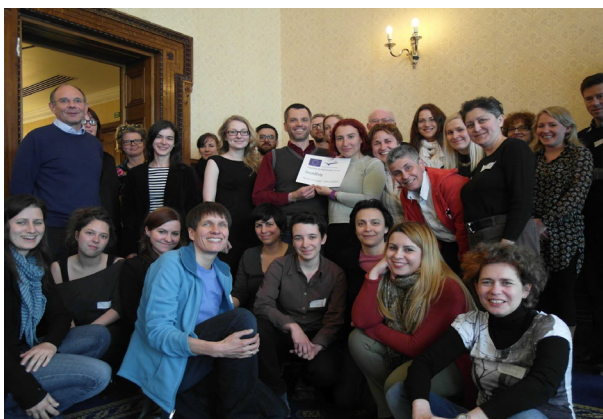
Þátttakendur á ráðstefnu Grundtvig í Aþenu sem fjallaði um samkynhneigða foreldra.

16.ágústsatframkvæmdastjóriMRSÍfundíinnanríkisráðuneyti um mansalsmál. Voru þar saman komnir ýmsir aðilar sem að mansalsmálum koma, það er Útlendingastofnun, Ríkislögreglustjóri, Lögreglustjórinn á Höfuðborgarsvæðinu, Stígamót og fleiri. Kynnt var vinna við umbætur í mansalsmálum og endurskoðun aðgerðaáætlunar gegn mansali. Var viðbragða fundarmanna og tillagna leitað auk þess sem þess var óskað að fundarmenn fylltu út spurningalista varðandi meðal annars hvernig haga mætti aðkomu hvernar stofnunar/ aðila að mansalsmálum út frá forvarnarstarfi, vernd fórnarlamba mansals, saksókn mansalsmála og samstarfi og samhæfingu.