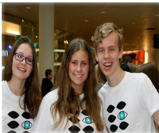
Aðalviðburður Evrópuvikkunnar var í Kringlunni en þar söfnuðust ungmenni saman, horfðu á skemmtiatriði og dreifðu bæklingum með upplýsingum um kynþáttamisrétti.