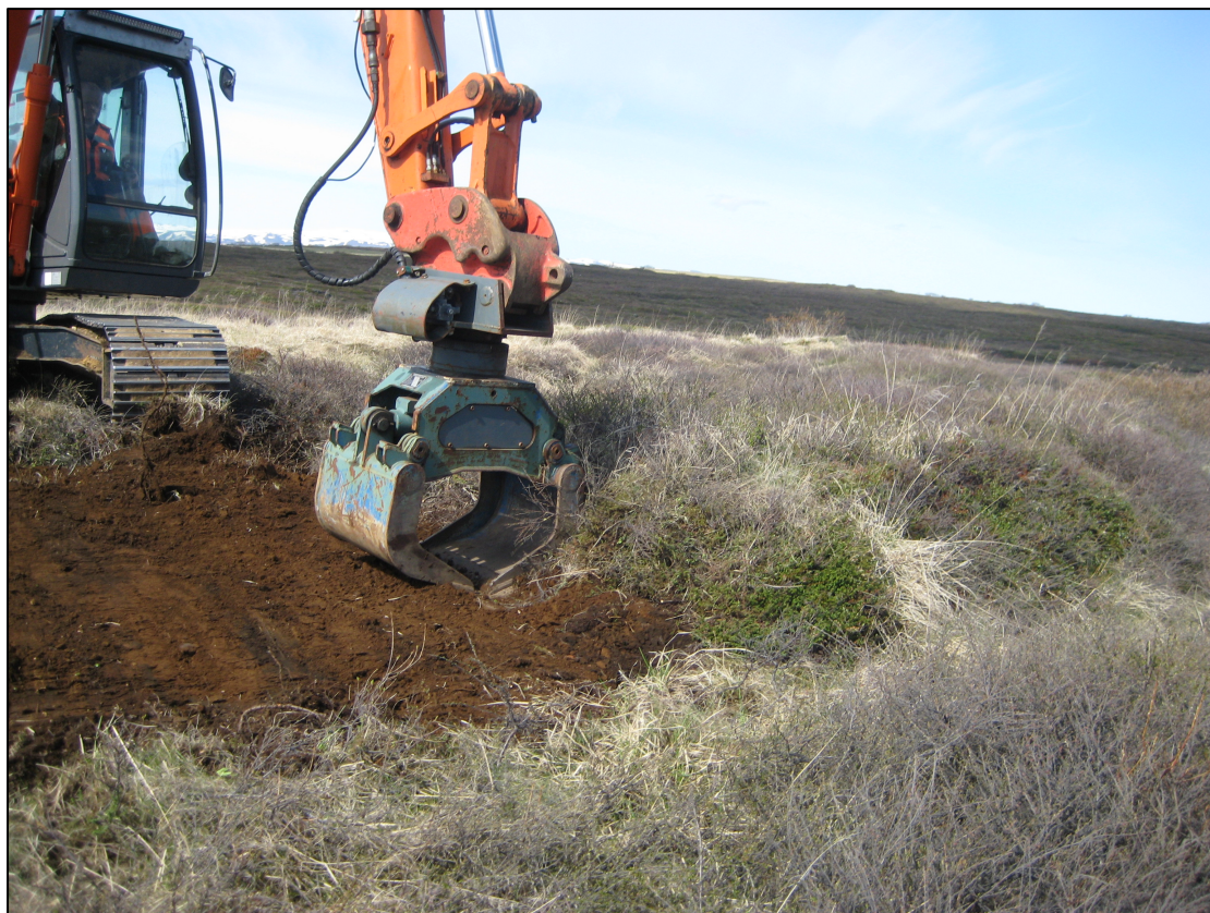
Mynd 1 Gróðurtorfur voru lagðar á ný eftir sléttun.

Í júní 2015 fór fram gröfuvakt vegna girðingarvinnu Vegagerðarinnar meðfram lagningu nýs Dettifossvegar, vestan Ásbyrgis. Fylgst var með gröfu slétta yfirborð þar sem girðingin var fyrirhuguð og girðingarstaurar barðir niður. Þar sem fjarlægja þurfti gróðurþekju, voru torfurnar lagðar aftur yfir raskið þar sem því var við komið.