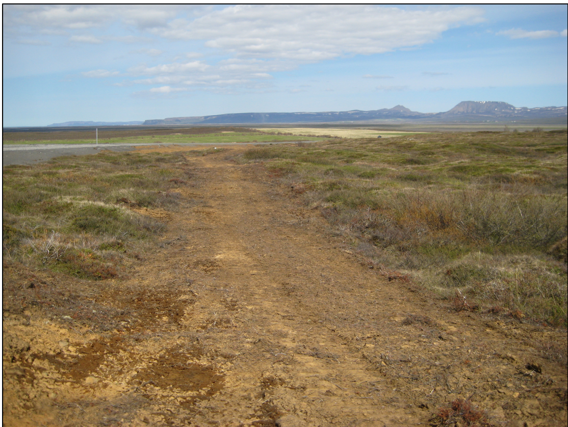
Mynd 5 Girðingarstæði við Tóvegg