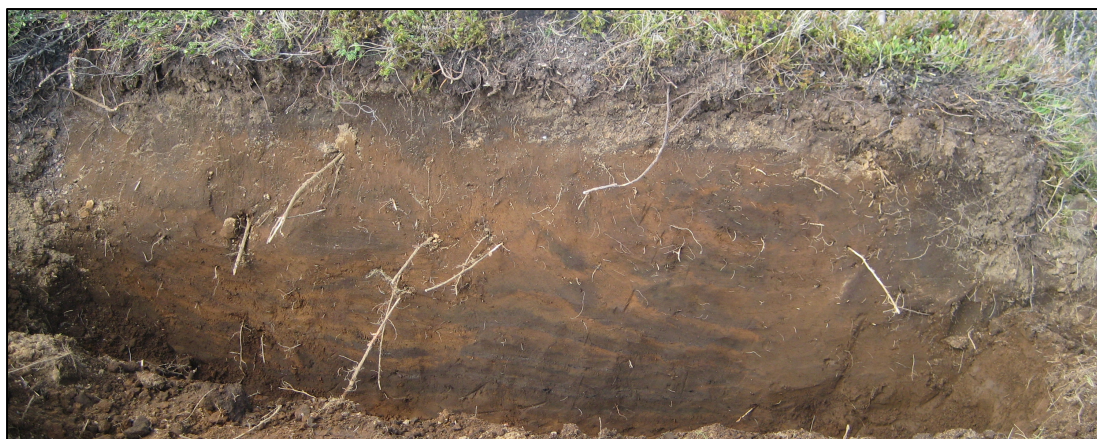
Mynd 3 Snið í ytri túngarði Hræreksstaða

Í þetta sinn var gröfuvakt á leggnum frá Hræreksstöðum að Tóveggjarstekk en þónokkuð er af þekktum minjum á því svæði. Ekkert nýtt kom í ljós við gröfuvaktina frá því sem kannað var árið 2008.