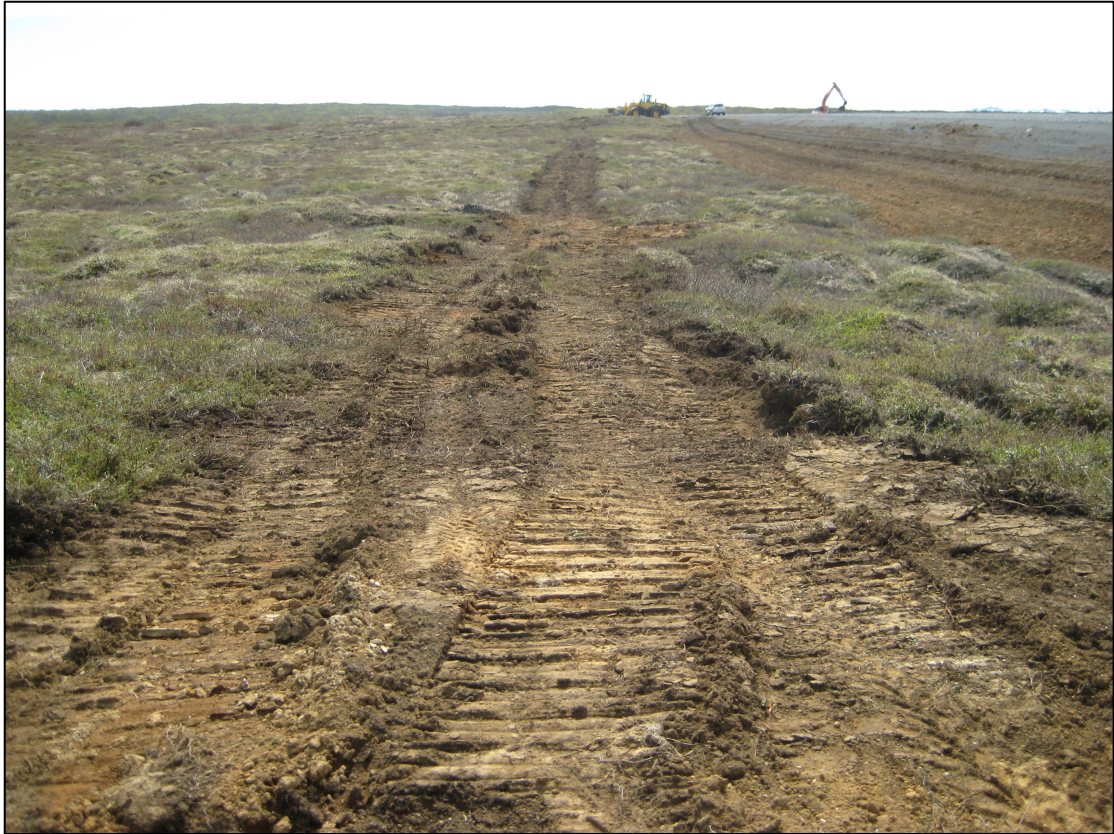
Mynd 4 Girðingarstæði við Hræksstaði.