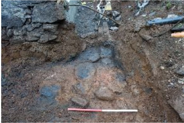
Mynd 3. Stétt og móaska. (Mynd tekin í V)