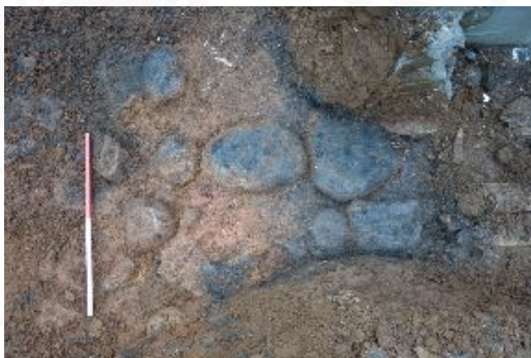
Mynd 2. Stétt og móðskulag sem var undir gólflagi (Mynd tekin í S)