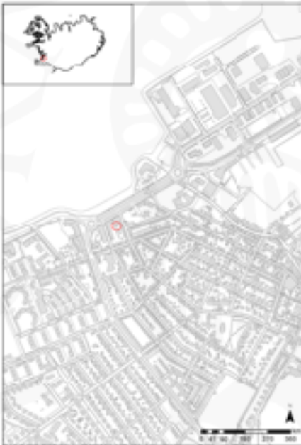
Kort 1. Kortið sýnir staðsetningu Stórasels.