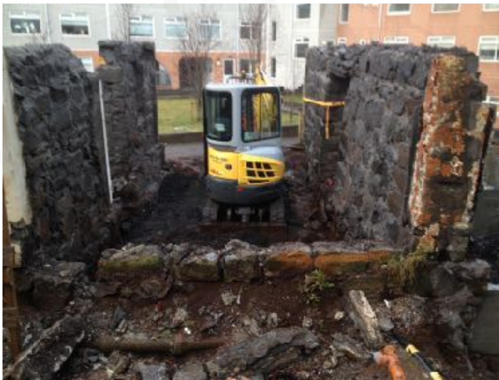
Mynd 1. Grunnur suðurveggs áður en framkvæmdir hófust. (Mynd tekin í V)

mannvirki 4 sem rannskað var árið 2015 en hlutverk þess er óþekkt. 4 Ekki var þörf á að grafa dýpra vegna framkvæmdanna. Svo virðist vera að mannvistarlög við Stórasel þykkni til suðausturs og má sjá móta fyrir hækkun í landslaginu þá átt. Það bendir til þess að þar sé hæsti hluti bæjarhólsins en steinhúsið hefur verið í jaðri hólsins. Leiða má að því líkur að þar séu enn minjar Stórasels að finna. Möl var lögð yfir minjarnar sem voru undir steinveggnum og þeim ekki raskað frekar.