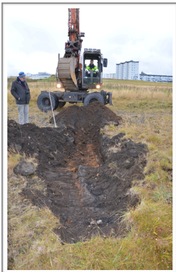
Mynd 2 Könnunarskurður grafinn. Á myndinni er Magnús Sædal Svavarsson og Erlendur Reynir Guðjónsson á gröfunni.

Eins og fram hefur komið var grafinn einn L-laga skurður sem var 6,3 m á lengd til A-V og 5,1 m á lengd til N-S og breidd var frá 1,6 m til 1,7 m. Yfir grjótgrunninum var sand- og malarlag sem var um 20 cm á þykkt sem hefur verið lagt yfir spítalagrundinn. Að vestanverðu var hleðslan tvöföld, en ekki var grafið niður á botn svo að fleiri umför kunna að vera varðveitt. Annarsstaðar sástu eingöngu eitt umfar og var þar af leiðandi dýpra