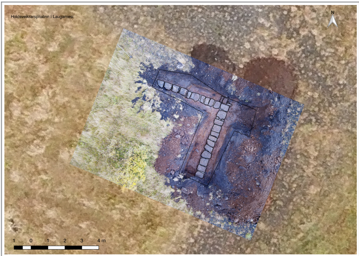
Mynd 3 Norðausturhorn spítalans og hefur teikning af skurði og grunni verið lögð yfir.