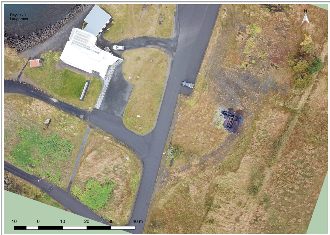
Mynd 4 Loftmynd af svæðinu. Listasafn Sigurjóns Ólafssonar er ofarlega á myndinni