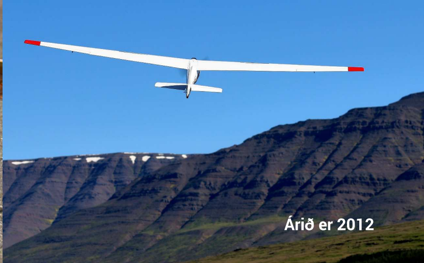
Árið er 2012