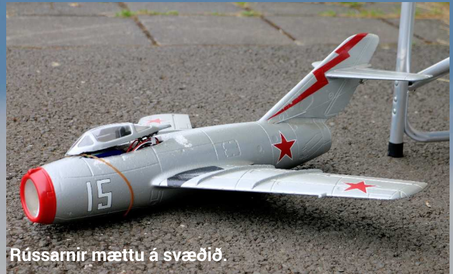
Rússarnir mættu á svæðið.