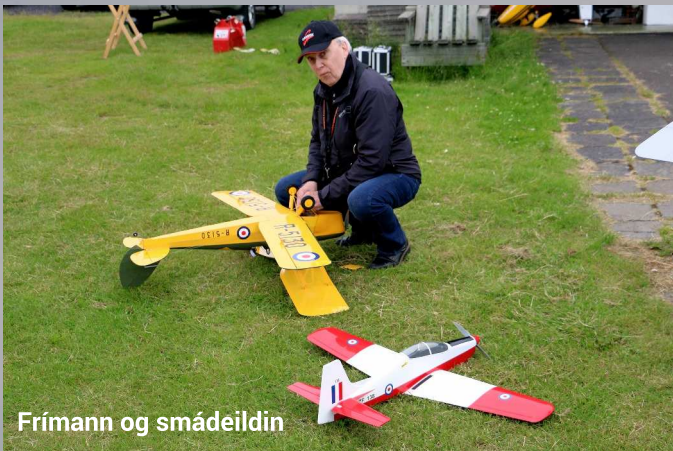
Frímann og smádeildin

Fínasta veður fram yfir hádegi, sól, hlýtt og bjart. Smá ókyrrð frá flugskýlunum en ekkert of alvarlegt. Útsendarar Öxulveldanna lágu augljóslega í leyni í nágrenninu og náðu að granda þremur flugmódelum yfir daginn. Stríðsfluglar úr fyrri heimsstyrjöld voru áberandi fjölmennastir á svæðinu eins og mörg fyrri ár en einnig sáust vélar af öllum aldri, stærðum og gerðum.