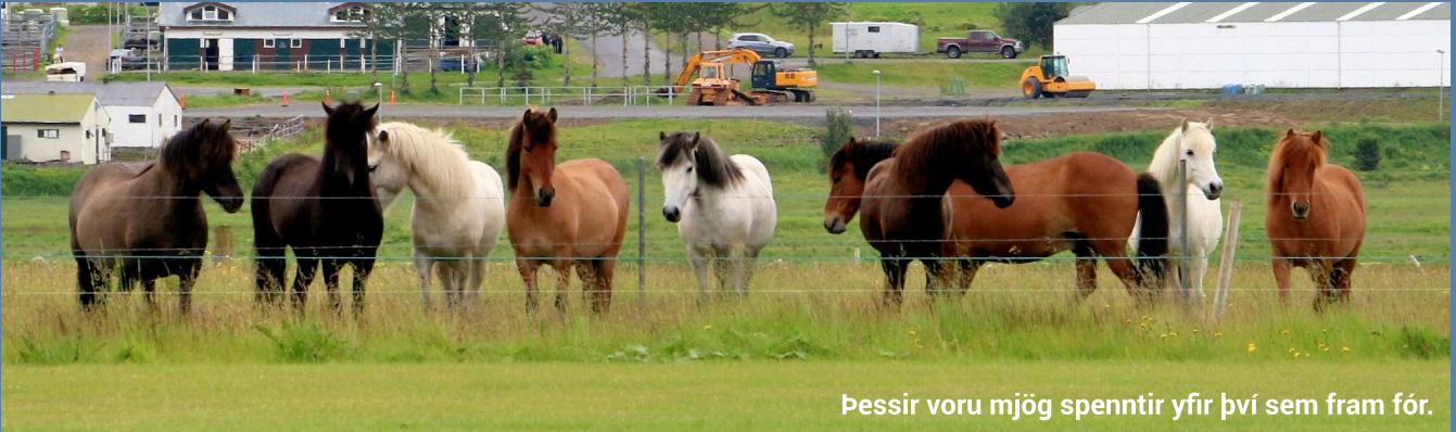
Þessir voru mjög spenntir yfir því sem fram fór.