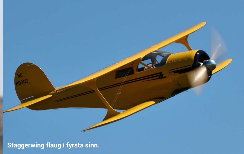
Staggerwing flaug í fyrsta sinn.