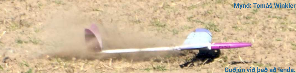
Mynd: Tomáš Winkler