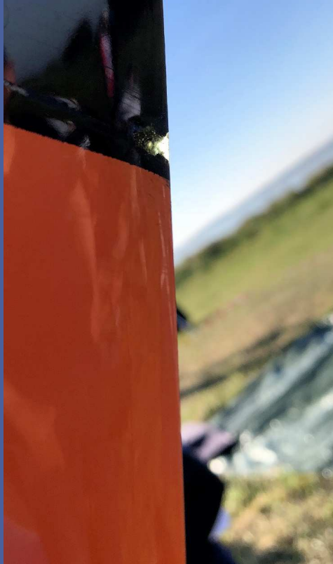
Smá epoxy lagaði steinaskemmdirnar.

Eftir það keyrðum við að Vitt og skoðuðum aðstæður. Ágætis brekka en nokkur tré sem þarf að vara sig á. Um 11 leytið kom svo tilkynning frá mótsstjórn að flogið yrði í Vitt eftir 12:30 og óvæntur atburður yrði kl. 12. Við keyrðum því út að Vitt og settum upp búðir á svæði sem var sannkölluð litla Skandinavía en við, Norðmenn og Danir vorum þarna í góðum grí.