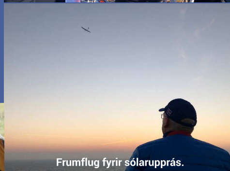
Frumflug fyrir sólarupprás.