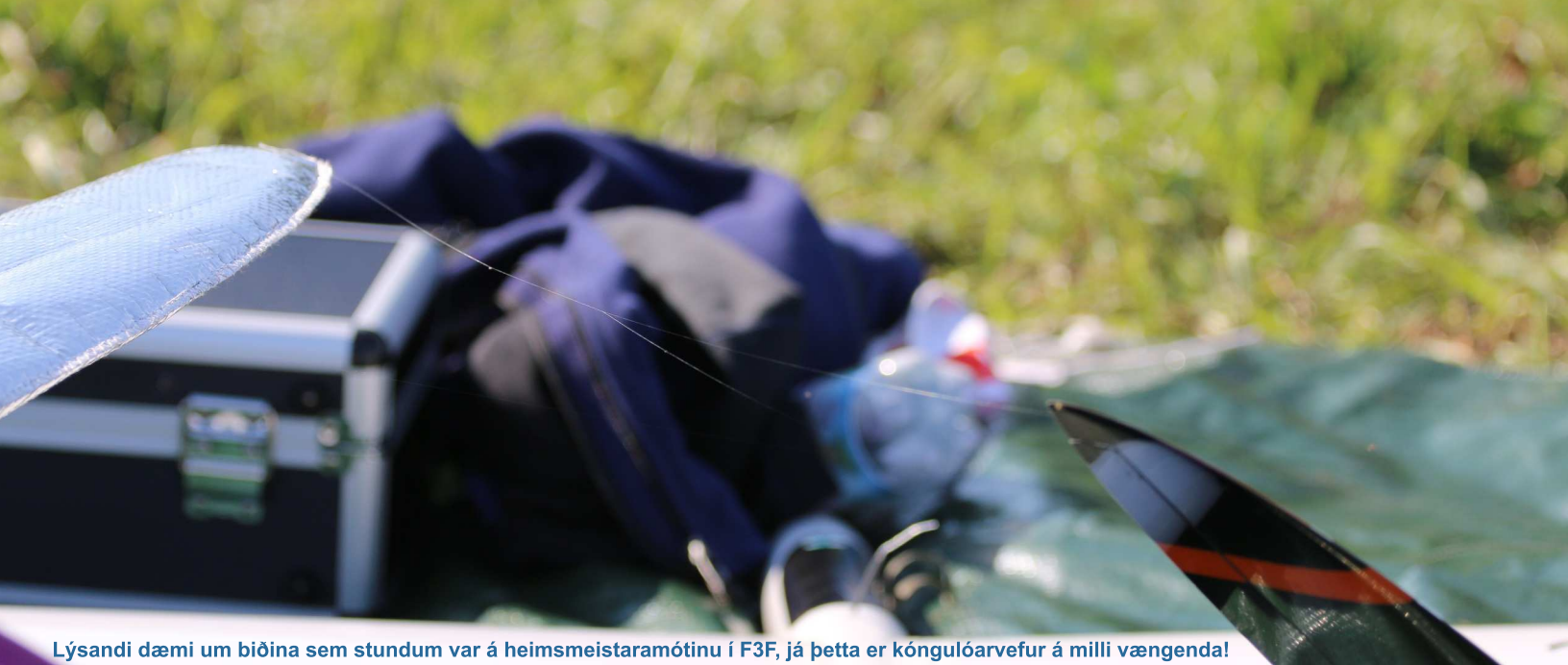
Lýsandi dæmi um biðina sem stundum var á heimsmeistaramótinu í F3F, já þetta er kóngulóarvefur á milli vængenda!