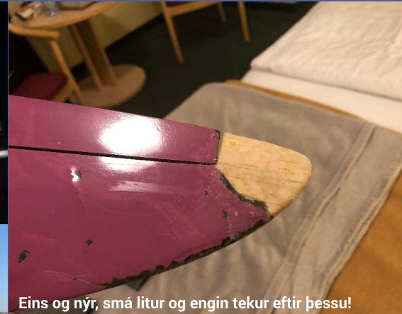
Eins og nýr, smá litur og engin tekur eftir þessu!