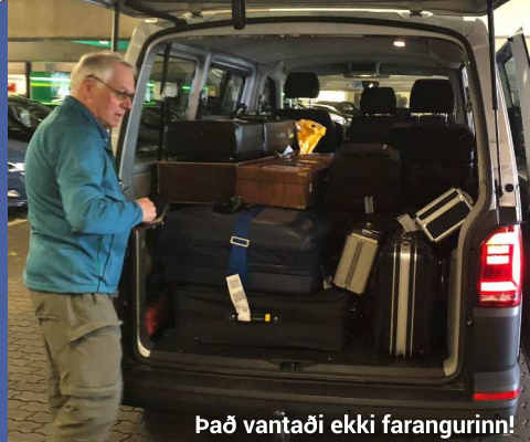
Það vantaði ekki farangurinn!

Að því loknu var rölt til baka á hótelið og næstu skref plönuð áður en haldið var í bólið.