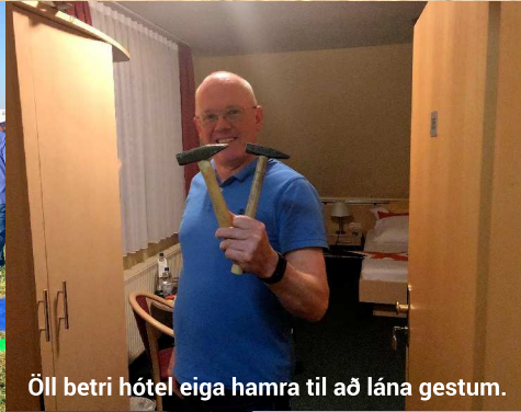
Öll betri hótél eiga hamra til að lána gestum.

hafi verið hægt að fylgjast með aðstæðum á nógu nákvæman hátt sökum þess að ekki var uppsettur vindmælir að mæla allan tímann.