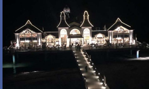
Lokahófið var haldið í þessu glæsilega húsi.

Sjá fleiri myndir á https://f3f.flugmodel.net