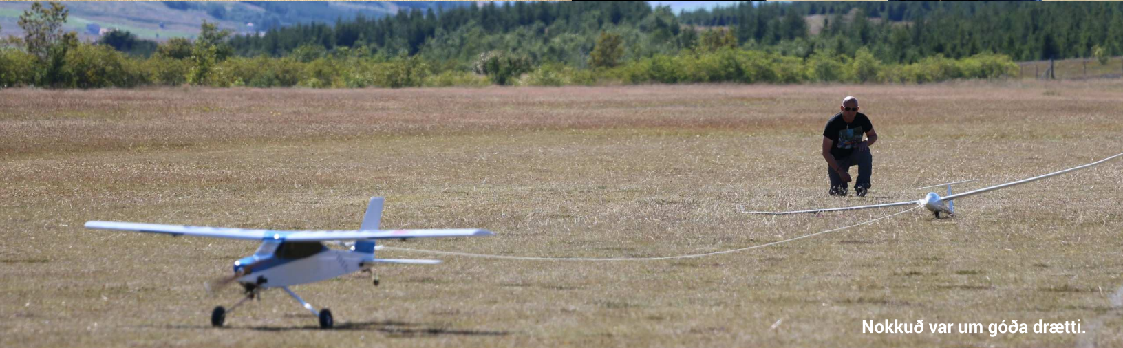
Nokkuð var um góða drætti.