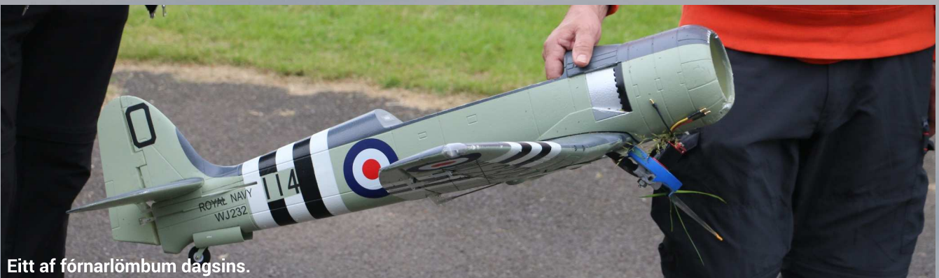
Eitt af fórnarlömbum dagsins.