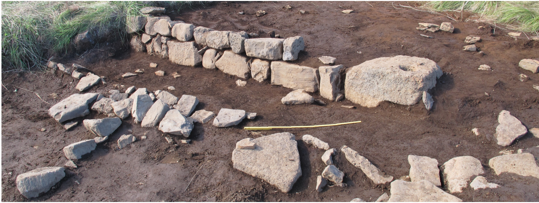
Mynd 3. Traðir í SV horni. Suðurhluti traðanna er nokkuð raskaður (í vinstra horni á mynd). Horft til norðvesturs. Ljósmyndari Lísabet Guðmundsdóttir.

Einnig var ruslaga [5098] fjarlæggt að hluta sem er staðsett í NV horni en traðirnar virðast hafa verið byggðar inn í lagið og eru því yngri. Við sigtun fannst töluvert af gripum, s.s. dýrabein, kol, múrsteinar, leirker, gler, krítarpípubrot, járnnaclar og járnklemma. Það var ekki grafið að fullu.