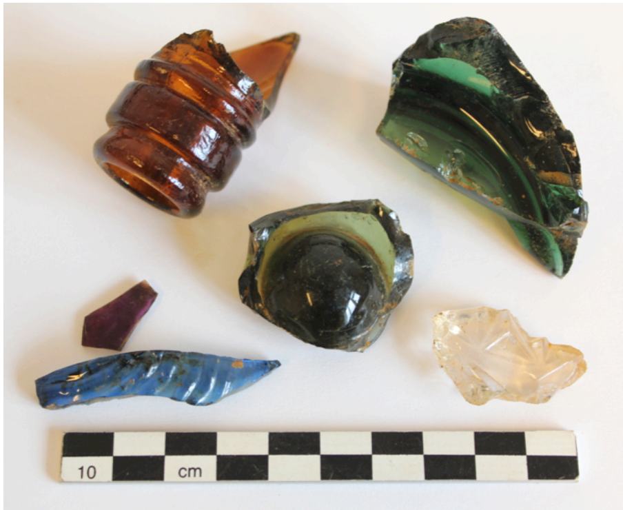
Mynd 7. Hluti af því gleri sem fannst við hreinsun á nýopnuðu svæði í SA horni á 5000.

opened in the SE corner of the main site [5000] . The aim is to uncover a building there which is located in the corner and continues under the S & E bank of the excavation area. The building was also located in a test pit [5097] from previous year, just a few meters southeast of area [5000] . It is thought to be an old printhouse that was situated in this area in the 18th century and can be seen on a re-drawing of Skálholt in 1784 by Victor Lottin.