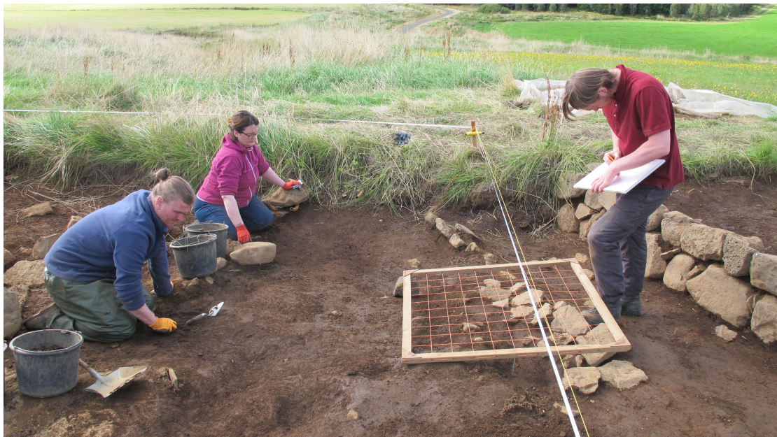
Mynd 1. Nemendur við uppgröft. Horft mót vestri.

Sérstakar þakkir til Fornleifastofnunar Íslands ses. fyrir lán á vinnubíl og Skálholtsstaðar fyrir hlýjar móttökur.