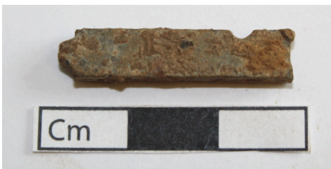
Mynd 4. Prentstafur úr blýi sem fannst við hreinsun á svæði 5000.

Einnig var ruslaga [5098] fjarlæggt að hluta sem er staðsett í NV horni en traðirnar virðast hafa verið byggðar inn í lagið og eru því yngri. Við sigtun fannst töluvert af gripum, s.s. dýrabein, kol, múrsteinar, leirker, gler, krítarpípubrot, járnnaclar og járnklemma. Það var ekki grafið að fullu.