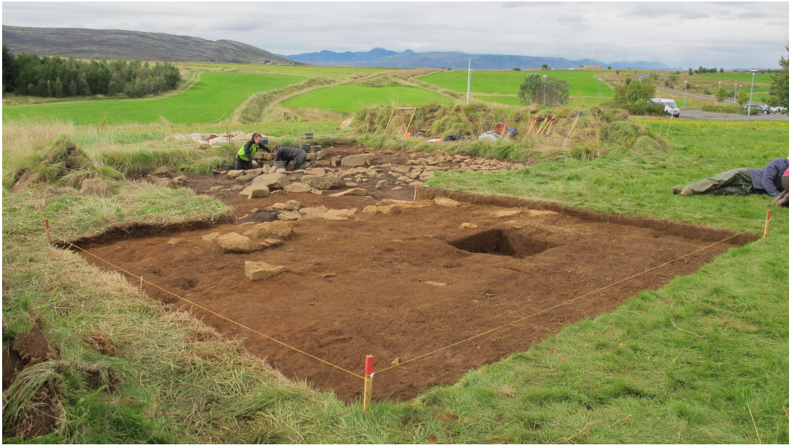
Mynd 6. Yfirlitsmynd af framlengda svæðinu. Horft til norðvesturs.

lá beint undir grasrót og innihélt svarta gjósku. Það gæti verið raskað torf úr mannvirkinu (prenthúsinu) sem er staðsett norðan við.