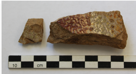
Mynd 5. Eitt af fjölda leirkersbrota sem fundust í yfirborði [5102] á framlengdu svæði 5000.

Á framlengda svæðinu voru tvö jarðlög fjarlægð. Í yfirborðslaginu [5102] sem náði yfir allt svæðið fannst mikið af gripum frá ýmsum tímabilum, m.a. kerti úr bíl, steypujárn, þakflísar, leirker, múrsteinsbrot, glerflöskubrot, textíll, brýni, krítarpípur og ýmsir járngrípur og naclar, flestir verksmiðjuframleiddir.