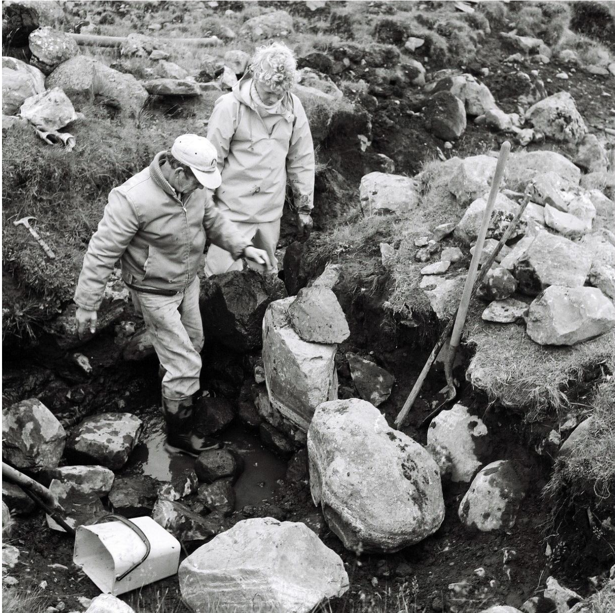
Mynd 2. Suðausturhorn Krosslaugar. Verið er að koma fyrir stórum steinum við suðuhlið laugarinnar. Í botni laugarinnar sést að steinar eru í botni hennar.