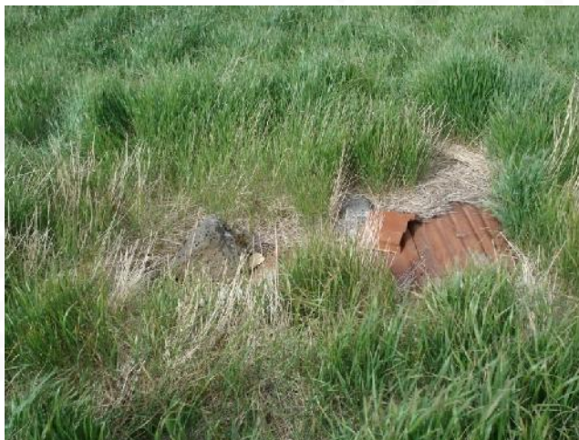
Byrgður brunnur 025, horft til vesturs