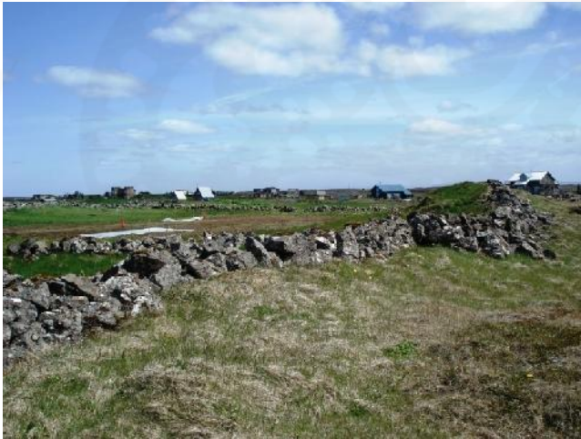
Halagerði 020, horft til austurs