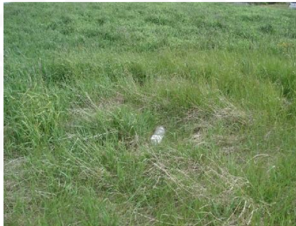
Óljós ummerki um Breiðagerðisbrunn 006, horft til austurs

Heimildir: Ö-Breiðagerði, 2; Túnakort 1919