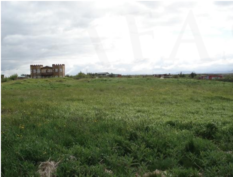
Bæjarhóll Breiðagerðis 001, horft til suðausturs

GK-145:001 Breiðagerði bæjarhóll bústaður