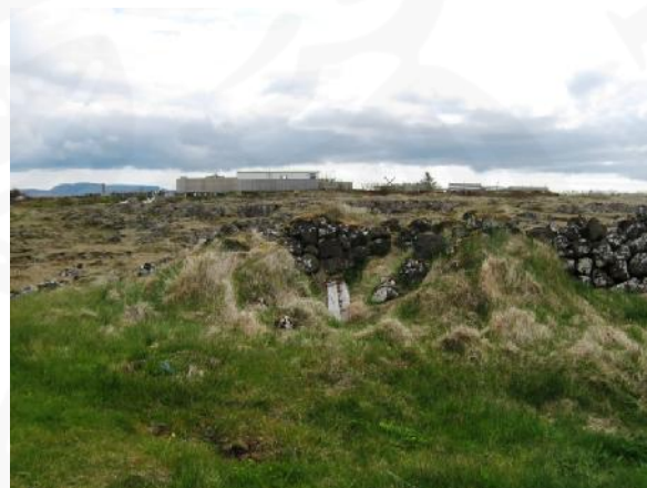
Tóft sambyggð Heiðargarði 021, horft til suðurs

Samkvæmt túnakorti frá 1919 náði Heiðargarður frá Halagerði 020, austast í túni Stóra-Knarrarness, að Vík 144:011, vestast í túni Minna-Knarrarness. Alls var garðurinn um 560 m á lengd og með ströndinni afmarkaði hann svæði sem er um 490x300 m að stærð og snýr nálega austur-vestur. Þar sem garðurinn er horfinn hefur hann verið rifinn vegna útfærslu túna, bygginga og vegagerðar. Garðurinn er grjóthlaðinn og lítið gróinn. Hleðslur eru víða hrundar og er mesta hæð um 1 m og mest sjást 5 umför. Í landi Stóra-Knarrarness er garðurinn um 170 m að lengd, liggur í boga frá suðaustri til suðvesturs. Með fjörunni afmarkarkar hann svæði sem er um 175x78 m að stærð og snýr ASA-VNV. Tóftin er sambyggð túngarðinum. Hún er einföld, um 4x3,5 m að stærð og snýr norður-suður. Innanmál hennar er 2x1,5 m. Í veggjum sjást mest 4 umför hleðslu og hæð þeirra er um 1 m og 1 m á breidd. Tóftin er grjót- og torfhlaðin. Opið inni tóftina er á norðurveggnum. Innan í tóftinni eru leifar af gamalli vírgirðingu. Í landi Minna-Knarrarness er garðbrot sem líklega er hluti af Heiðargarði. Það er um 25 m suðvestan við suðausturenda Brandargerðis 144:016. Það er ógreinilegt, er um 8 m á lengd og um 0,3 m á hæð. Ekki stendur steinn yfir steini. Ekki eru tiltækar upplýsingar um aldur Heiðargarðs og kann hann að vera allgamall í grunninn þó að hann hafi verið endurhlaðinn í gegnum tíðina.