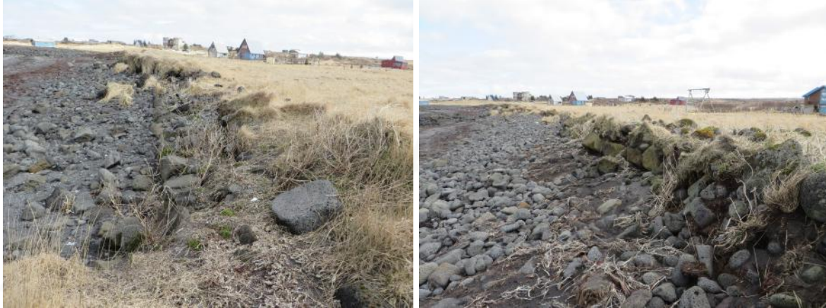
Á vinstri mynd sést garðbútur 012E, horft til ANA. Á hægri mynd sést garðbútur 012D, horft til austurs

stórgrýti er í honum. Hann snýr norðaustur-suðvestur og í honum sjást mest tvö umför hleðslu. Garðbútur C sést á um 20 m löngum kafla, snýr norðaustur-suðvestur. Hann er hruninn og illa farinn af landbroti. Í honum er stórgrýti og má enn sjá tvö umför í hleðslu á stöku stað, mesta hæð um 0,6 m. Garðurinn þjónaði bæði sem sjóvarnargarður og túngarður þar sem hann afmarkaði túnið til VNV. Ekki sjást nein merki um naustið þar sem talið er að það hafi verið og er líklegt að það sjórin hafi brotið það niður.