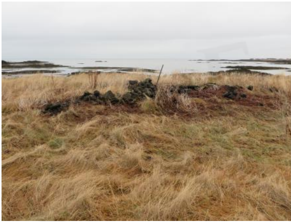
Hleðsla 037, horft til norðurs

Ógreinileg hleðsla er á grónum sjávarkamp í túnjaðri. Hún er um 20 m norðan við tóft 021B og um 150 m suðaustan við bæ 001. Hleðslan hafði áður númerið 047 í viðbótarskýrslu um deiliskráningu vegna sjóvarnargarða (FS525-13082).