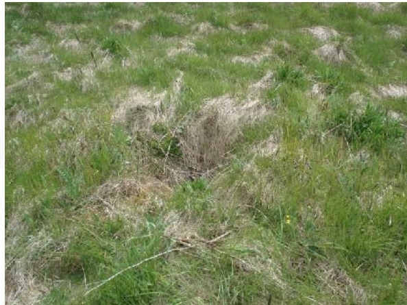
Ummerki um brunn 005, horft til austurs

GK-145:006 Breiðagerðisbrunnur heimild um brunn