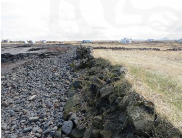
Halagerði 020, horft til austurs. Myndin var tekin í apríl 2016 og sýnir hvernig sjórinn brýtur af norðurhlíð gerðisins

"Innsti hluti túnsins nefnist Halagerði ...," segir í örnefnaskrá. "Innsti (austasti) hluti túnsins (þ.e. Austurbæjartúnsins) nefnist Halagarður," segir í örnefnaskrá KE. Halagerði er um 225 m suðaustan við bæ 001.