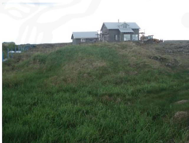
Þúst 030, horft til suðurs

GK-145:030 þúst 64°00.428N 22°19.460V Stór hóll sem líkist rústahól er um 200 m vestan við bæ 001 skammt sunnan við sjávarkamp. Hóllinn er í móa utan túns en fast