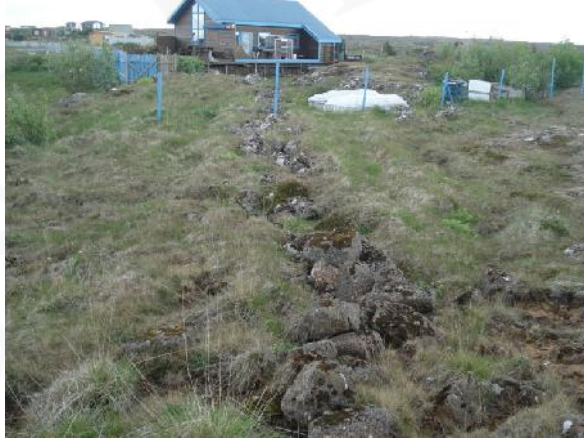
Garðlag 031, horft til austurs