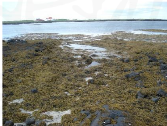
Lending 036, horft til norðvesturs