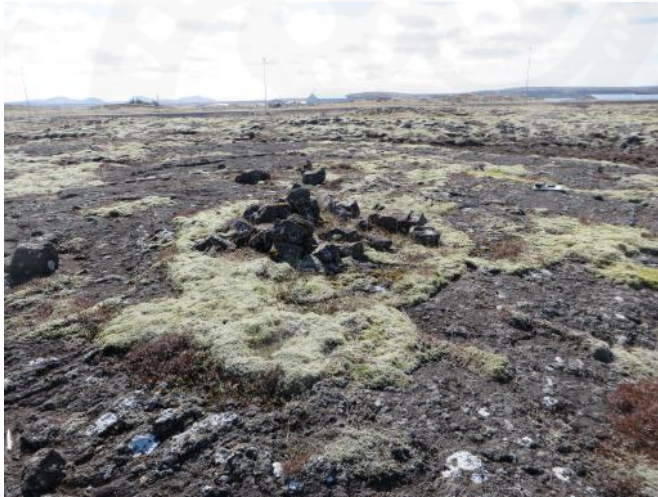
Hleðsla 191, horft til suðurs

Hleðslan er á flatri hraunhellu í mosagrónu hrauni með grónum lautum inn á milli en einnig er gróðurlaus holmói í hrauninu.