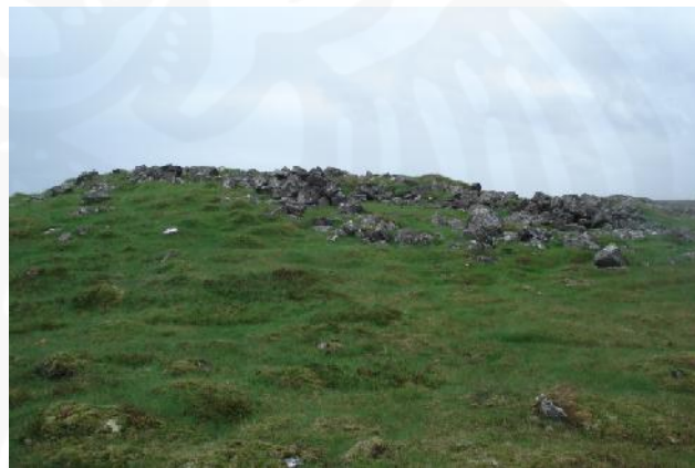
Gíslaborg 064, horft til austurs

Fjárborgin stendur á dálitlum grónum hól í uppgrónu hrauni.