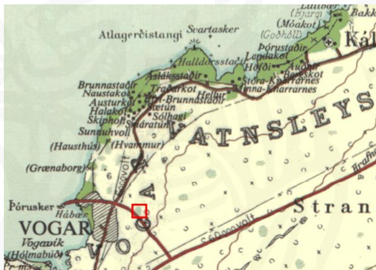
Kort sem sýnir gróflega staðsetningu iðnaðarlóðar við Vogabraut. (Herforingjaráðskort, kort 27)