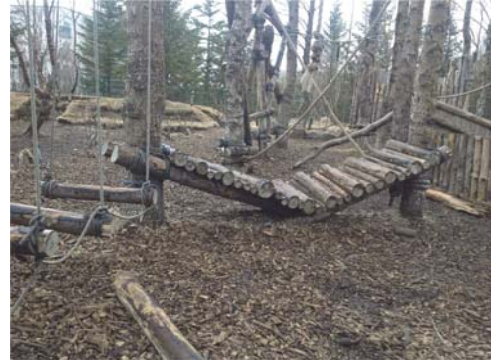
Mynd 3 Reynislundur er vinsælt útikennslusvæði

Útileiksvæði er að meginhluta sunnan við skólann og er 3675 m 2 að stærð. Reynislundur er sérstakt útikennslusvæði. Við reglubundið eftirlit heilbrigðisfulltrúa frá Reykjavíkurborg 19 í maí 2012 komu fram athugasemdir við grassvæði um að það væri holótt og að auðveldlega bærist yfir það sandur. Áhættumat er unnið af stjórnendum og byggir það á ytra eftirliti heilbrigðisfulltrúa. Í áhættumati á útileiksvæði frá september 2012 kom fram að á útileiksvæði er holóttur grasbali og brekka sem upp úr standa steinar. Samkvæmt áhættumatinu er talin hættu á falli, broti og álagi á stoðkerfi. Í framhaldi af áhættumatinu óskuðu stjórnendur eftir úttekt á lóð og lagfæringu 20 .