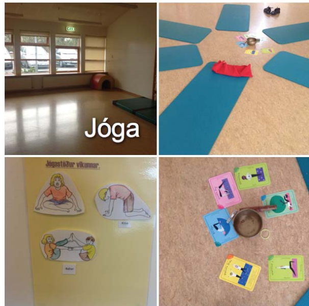
Mynd 4. Jóga

Upplýsingatækni er nýtt til að þróa starfið og til að veita upplýsingar. Áherslur leikskólans á jóga í leikskólastarfi bera vott um nýja hugsun í menntun og uppeldi ungra barna. Börnum er kennt að tileinka sér ákveðnar dyggðir til að auka þekkingu þeirra á grunngildum samfélagsins. 32 Dagskipulag leikskólans 33 hvetur til þess að börnin sýni frumkvæði og aðlögunarhæfni, komið er til móts við ólíkar þarfir þeirra og leitast er við að tryggja jafnrétti og virka þátttöku í