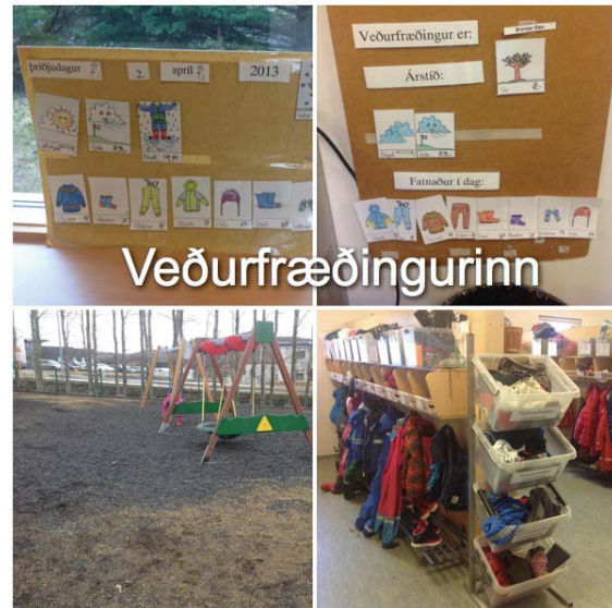
Mynd 5. Veðurfræðingurinn

Hluti grunnþátta hefur verið innleiddur en ekki hafa verið sett fram viðmið um þann árangur