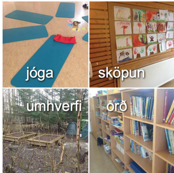
Mynd 2. Hluti af áherslum leikskólans

Áherslur og sýn leikskólans byggja á meistaraverkefni leikskólastjóra. Frá upphafi hefur áhersla verið lögð á snertingu, jóga og slökun, en fleiri þættir hafa komið inn í starfið og er umhverfismenntin nú stór hluti af áherslum skólans. Í leikskólanum hefur verið unnið að fjölbreyttum þróunarverkefnum, þau hafa verið fest í sessi og þannig hafa áherslur í skólastarfinu þróast 13 . Sem dæmi um það eru þróunarverkefni eins og Orð af orði , orðs ég leitaði og Líf og leikni . Starfsfólk leikskólans telur að markvisst sé unnið að því að halda kyrrð og ró innan veggja leikskólans og segja snertingu og hlýju vera notuð sem agatæki 14 . Það telur sameiginleg uppeldissýn innan leikskólans vera virðingu 15 .