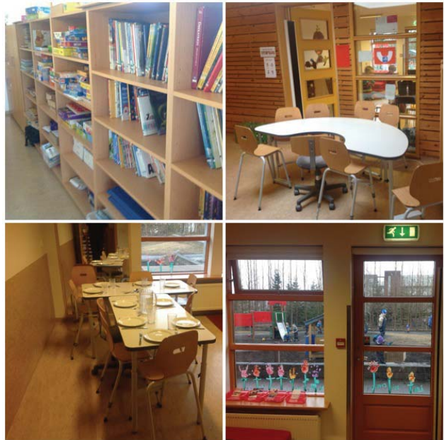
Mynd 1. Innisvæði Reynisholts

hlið hans og bílastæði er rúmt. Í leikskólanum dvelja að jafnaði 86 börn á aldrinum tveggja til sex ára, þann 1. des 2012 var kynjaskiptingin 51 piltur og 35 stúlkur 7 . Börnin skiptast á fjórar deildir eftir aldri, þær heita: Bjartilundur, Geislalundur, Sunnulundur og Stjörnulundur. Leikskólinn er opinn frá 7:30 til 17:15 alla virka daga 8 . Matur fyrir börn og starfsfólk er eldaður í eldhúsi leikskólans. Megináherslur leikskólans byggja á lífsleikni, það er jóga, umhverfismennt og efling almennrar málvitundar 9 . Þjónustumiðstöð Árbæjar veitir leikskólanum stoðþjónustu og samstarf er við Heilsugæslu Árbæjar.