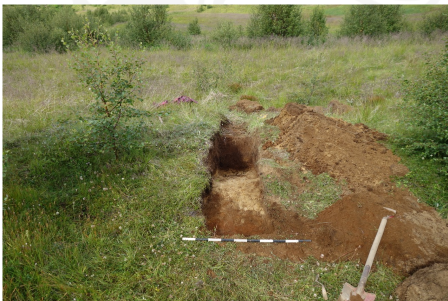
Mynd 3 Skurður í gegnum meint garðlag sem liggur í N-S. (Mynd tekin í A)

Skurður 1 var tekinn í gegnum hrygg sem lá í N-S. Hann var um 2,5-2m á breidd og um 30-40cm á hæð. Skurðurinn var 4m á lengd og um 60cm á breidd. Mesta dýpt var 70cm sem var í miðjum skurði en austan og vestan megin var skurðurinn 12cm og var stoppað þegar komið var niður á H3, ljós gjóska úr Heklu sem féll fyrir u.þ.b. 3000 árum. Engin mannvistarlög fundust í skurðinum. Hryggurinn er náttúrulegur og hefur myndast vegna jarðvegsfoks sem safnast hefur safnast saman upp við melinn sem er hærri í landslaginu. Snið var ekki teiknað þar sem ekki var um mannvirki að ræða