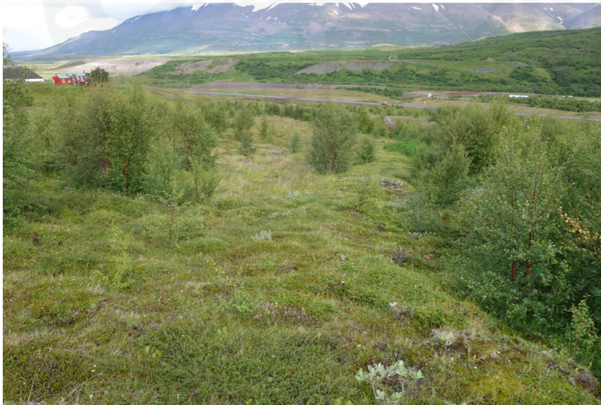
Mynd 1 Meint garðlag sem liggur u.þ.b. í N-S. (Mynd tekin í NNA)

Meint garðlagið liggur um það bil N-S upp við ógróinn mel og fylgir honum eftir til SSV.