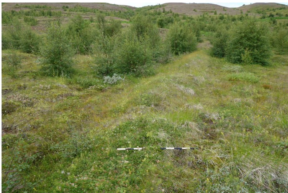
Mynd 2 Meint garðlag sem liggur í A-V. (Mynd tekin í V)