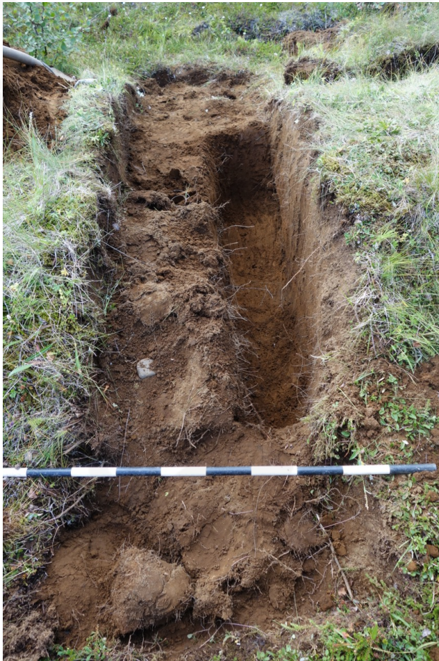
Mynd 4 Skurður í gegnum hrygginn sem liggur í A-V. (Mynd tekin í S)

Skurður 2 var tekinn í gegnum hrygg sem lá í austur-vestur. Hryggurinn var talsvert hærri en sá fyrrnefndi, um 50cm á hæð og 1,5m á breidd. Skurðurinn var 3m á lengd, 60cm á breidd og 70cm á dýpt. Grafið var niður á H3 gjóskuna og reyndist hryggurinn einnig vera náttúrulegur. Um það bil 20m sunnar var annar álíka hryggur og þegar gengið var um hlíðina fundust fleiri mjög álíka hryggir. Líklegast er um að ræða skriður sem hafa fallið niður hlíðina. Snið var ekki teiknað þar sem ekki var um mannvirki að ræða.