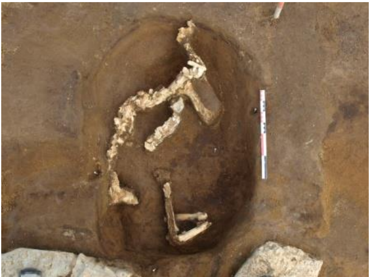
Mynd 2: Nautgripsbeinagrindin eins og hún fannst undir fjósgólfinu. Horft mót austri. Ljósmynd Sindri Ellertsson Csillag, stafrænar myndir nr. 777 (Bjarni F. Einarsson og Sindri Ellertsson Csillag, 2011).

Ekki er hægt að fullyrða um af hverju kýrin var grafin í fjósgólfinu. Mögulegt er að kýrin hafi drepist og af einhverju ástæðum hafi verið óhægt um vik að fara með skrokkinn lengra frá bænum og grafa hann þar. Hugsanlega hefur kýrinn verið grafinn rétt utan við bæjarhúsin á 11. öld og staðsetningin síðan gleymst. Við breytingar á húsaskipan hafi kýrin þannig lenti undir nýju fjósi. Einnig er mögulegt að um verndarfórn við upphaf notkunar fjóssins hafi verið að ræða. Nánar verður rætt um túlkun beinagrindarinnar í kafla 4.