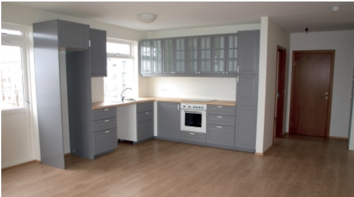
Svipmynd úr nýrri leiguíbúð í Hamrahlíð 17

Á árinu 2012 var um 4 millj. kr. varið til viðhalds og kostnaðar í Hamrahlíð 17. Tvær nýjar íbúðir, númer 312 og 412,