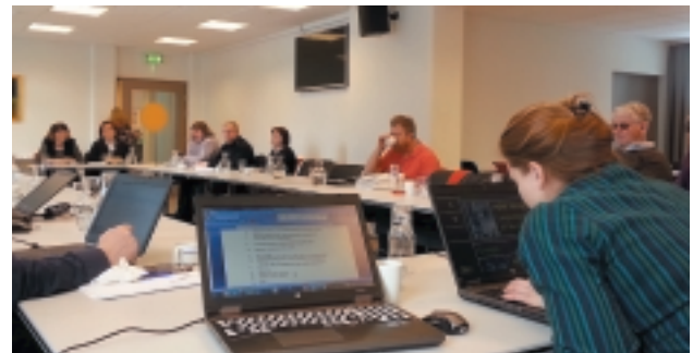
Frá NSK-fundinum í Reykjavík í mars 2014.

þeir sátu NSK-fundinn. Þeir gistu í gestaíbúðum í Hamrahlíð 17. Fulltrúar frá ISI, nýstofnuðu grænlenku blindrasamtökunum, sátu fundinn. Undir lok fundarins var ákveðið að vinna að því að ISI gætu átt fulla aðild að NSK-samstarfinu.