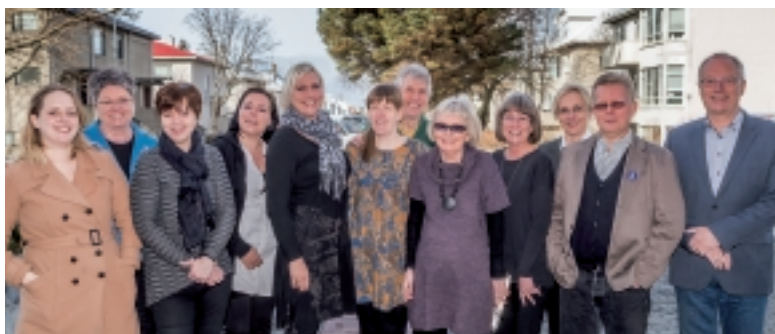
Starfsmenn Blindrafélagsins í apríl 2013