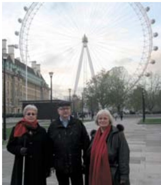
Félagar í London.

Dagana 4. til 8. október 2010 fór 12 manna hópur á Unaðsdaga í Hólminum. Hér nutum við dagskrár sem Hótel Stykkishólms bauð uppá: Gisting frá mánudegi til föstudags, morgunmaturlaun og þriggja rétta kvöldverður alla dagana, einn hádegisverður af hlaðborði, frítt í sund og sundleikfimi, gönguferðir og menningarferð um söguslóðir og náttúruperlur Snæfellsness. Öll kvöldin var dagskrá s.s. bingó, spilavist, skemmtidagskrá, dans o.fl. Allir voru duglegir að taka þátt í skemmtuninni, skemmtu sér vel ok komu ánægðir til baka.