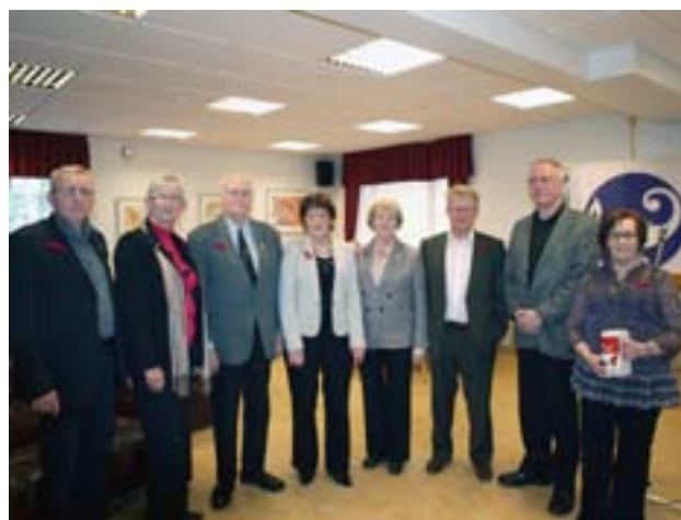
Vigdís Finnbogadóttir hleypti landssöfnun Lionshreyfingarinnar af stökkunum.

Seinni félagsfundurinn var haldinn 7. apríl og var haldinn í kjölfar athafnar þar sem frú Vigdís Finnbogadóttir hleypti af stökkunum Landssöfnun Lionshreyfingarinnar, Rauðu fjöðrinni, til styrktar talgervlaverkefni Blindrafélagsins. Á fundinum var fjallað um Talgervlaverkefnið, sem hefur fengið yfirskriftina: Nýr íslenskur talgervill í þjóðareign. Bætt lífsgæði – íslensk málrækt og nýjan styrktarsjóð Blindrafélagsins sem fengið hefur nafnið: Stuðningur til sjálfstæðis.