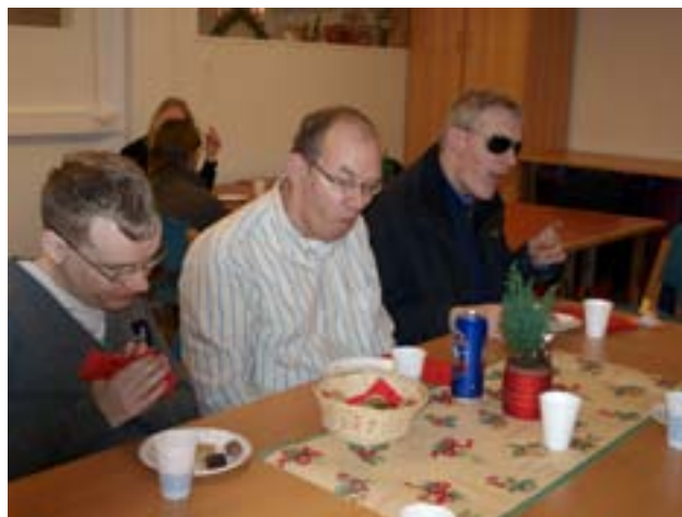
Starfsmenn Blindravinnustofunnar í jólakaffi.