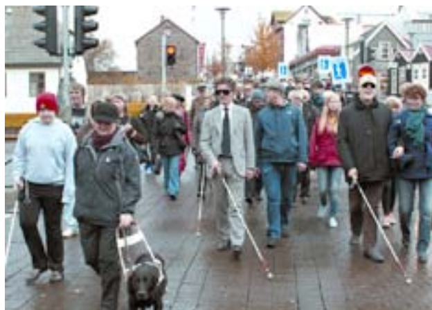
Göngufólk á Degi hvíta stafsins, 15. október 2010

Í tilefni af degi Hvíta stafsins, sem er 15. október ár hvert, stóðu Blindrafélagið og Þjónustu- og Þekkingarmiðstöð fyrir blindra, sjónskerta og daufblinda einstaklinga fyrir hóp-göngu niður Laugavegin. Þjóðþekktir einstaklingar voru fengnir til að leiða gönguna og ganga með hvítan staf og sjónhermigleraugu sem líktu eftir alvarlegum sjónskerðingum. Á leiðinni var þeim falið að leysa ýmis verkefni, svo sem að taka út úr hraðbanka og fara inn í verslanir. Að göngunni lokinni var síðan efnt til kaffisamsætis í Oddfellowhúsinu, Vonarstræti 10, og þar var m.a. tónlistarflutningur auk þess sem Samfélagslampi Blindrafélagsins var afhentur í annað sinn. Mjög góð mæting