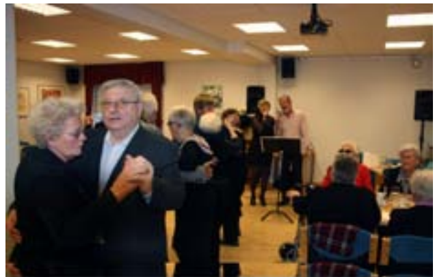
Svipmynd úr Opnu húsi.

Í vetur hafa margir góðir tónlistamenn spilað og sungið fyrir gesti, hljómsveitin Baggalútur, KK og húsbandið GHG sem skipað er 3 félagsmönnum Blindrafélagsins.