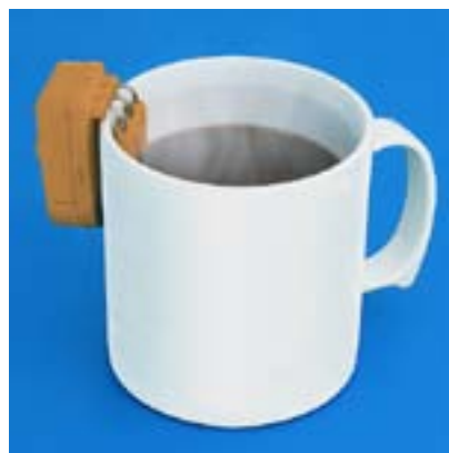
Einfalt hjálpartæki fyrir blinda.

Gerður er leigusamningur milli Blindrafélagsins og leigutaka sem skuldbindur sig til að leigja viðkomandi tæki í 12 – 36 mánuði. Nú hafa verið gerðir 5 leigusamningar, allir við grunnskóla á landsbyggðinni.