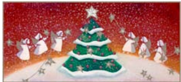
Jóla kort Blindrafélagsins 2010.

Tekjur og framlegð vegna sölu jóla korta jukust um 7 – 8% milli áranna 2010 og 2009 sem verður eð teljast óvenju gott þegar tekið er mið af stöðunni í þjóðfélaginu og mikilli samkeppni í sölu jóla korta. Þess má ennfremur geta að hefðbundin jóla kort hafa verið að missa markað á síðustu árum á sama tíma og jóla kveðjum á netinu fjölgar.