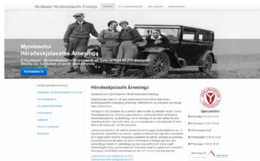
Myndasetur.is, forsiða vefsins. Óhætt er að fullyrða að aðsókn að vefnum hefur farið fram úr björtustu vonum. Flettingar á vefnum skipta þúsundum dag hvern.