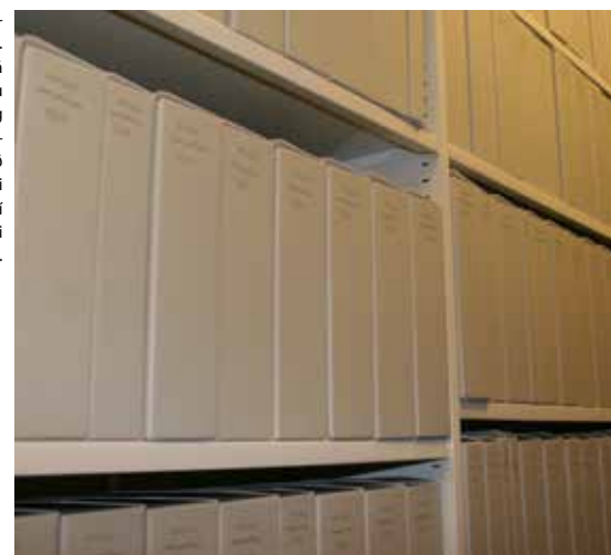
Í einni af skjalageymslum safnsins. KLUG öskjur frá Þýskalandi eru núna notaðar og mikið vinna framundan við að umpakka eldri afhendingum í viðeigandi umbúðir.

Eins og áður eru stærstu afhendingarnar frá skilaskyldum aðilum – um helmingur af fjölda afhendinga, en ef horft er til fjölda hillumetra þá er hlutfallið yfir 90% af samanlögðum hillumetraffjölda. Meginreglan er sú að starfsmenn héraðsskjalasafnsins aðstoða skilaskylda aðila með margvíslegum hætti skv. nánara samkomulagi hverju sinni. Í mörgum tilfellum ná starfsmenn skjalasafnsins í skjölin, skrá, flokka og ganga frá þeim í geymslur. Þessa vinnu greiða sveitarfélögin sérstaklega fyrir. Þetta fyrirkomulag styrkir sambandið á milli sveitarfélaganna og skjalasafnsins og mun nýtast enn betur í framtíðinni þegar skjalasafnið fer að sinna lögbundnu eftirliti.